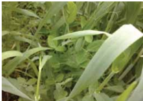
Slika 1. Smjesa stočnog graška i raži

Raž omogućuje dobru pokrovnost tla već u jesen dok ozima grahorica glavninu pokrovnosti ostvaruje u proljeće. U istraživanjima s ozimim pokrovnim usjevima u Istočnoj Hrvatskoj kojeg su proveli Brozović i sur. (2014), početni razvoj smjesa stočnog graška s raži i pšenicom (Slika 1. i 2.) bio je brži u odnosu na stočni grašak. Smjesa stočnog graška s raži ostvarila je 70% veći sklop i brži početni razvoj u odnosu na stočni grašak (Slika 3.) kao samostalan usjev. U istom istraživanju raž, grahorica i njihova smjesa (Slika 4.) pokazali su se najučinkovitiji u pokrivanju tla formiranjem najveće biomase (Brozović i sur, 2020).