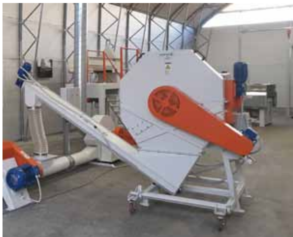
Slika 10. Rezačica biljne mase Figure 10. Herbs cutter

Namijenjena je za rezanje različitih vrsta bilja u svježem ili suhom stanju. Duljina reza bira se prema zahtjevu tehnologije. Može se koristiti i za usitnjavanje osušenih materijala prije mljevenja. Rezačica se sastoji od postolja, rotorskog i statorskog sklopa.