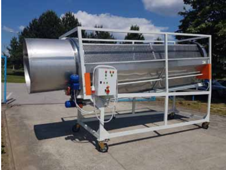
Slika 2. Cilindrični separator

Upotreba ciklindričnog separatora neizostavan je dio dorade kamilice jer se time smanjuje trošak sušenja, a povećava kvaliteta i ukupna vrijednost ubrane mase.