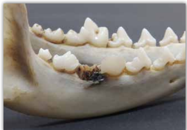
Slika 3. Komplikirani prijelom M1.

do prijeloma lako može doći prilikom borbe za teritorij te stoga ni ovaj uzrok ne treba u potpunosti odbaciti, posebice kada je riječ o većoj gustoći populacije.