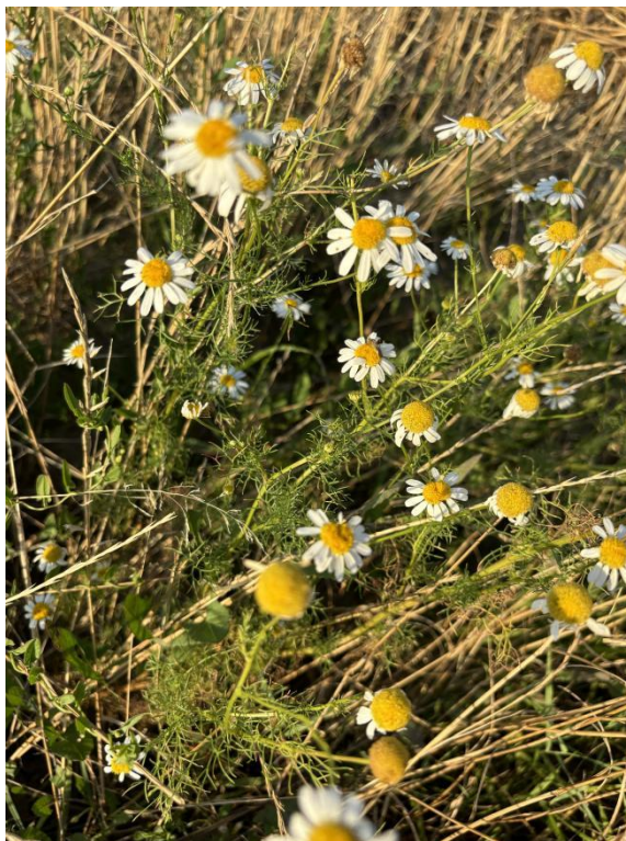
Slika 3. Obična kamilica ( Matricaria chamomilla L. )

Primjenjuje se kod želučanih problema, za usporenu probavu, proljev i mučninu; rjeđe i vrlo djelotvorno kod upale mokraćnih kanala i kod bolnih menstruacija. Izvana, lijek u obliku praha može se primijeniti na rane koje sporo zacjeljuju, za kožne infekcije, poput herpesa i čireva, također za hemoroide i za upale usta, grla i očiju (Singh i sur., 2011.).