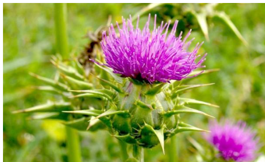
Slika 28. Sikavica ( Silybum marianum L.)

Jednom kada biljka uvene, nakon sjemena, mesnati korijen se razgrađuje, dodajući organsku tvar, minerale i ostavljajući iza sebe značajan kanal za zrak i vodu da putuju dublje u profil tla.