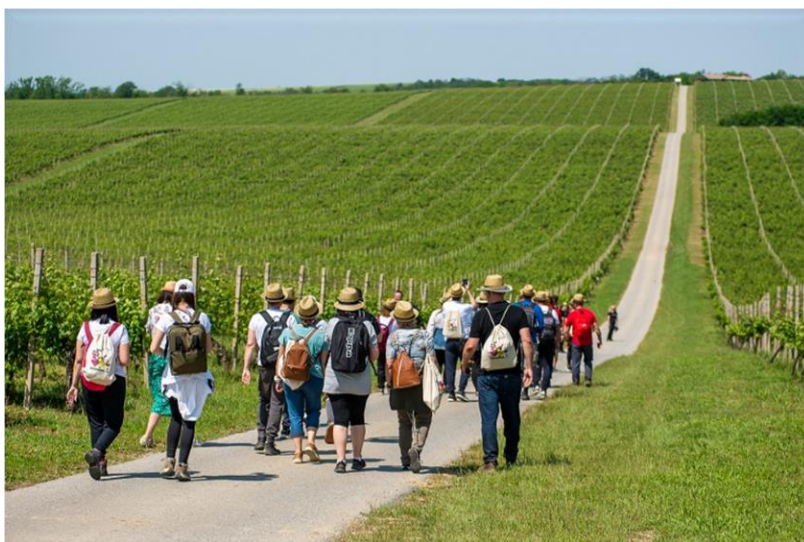
Slika 5. Manifestacija Wine & Walk