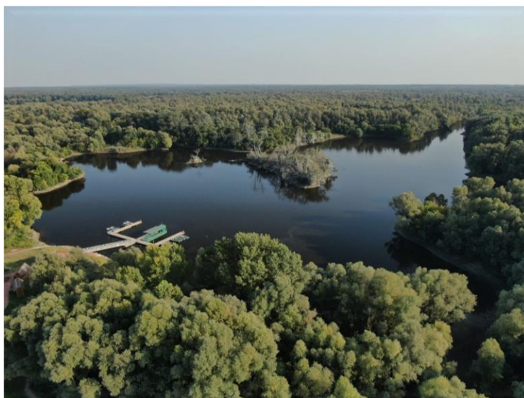
Slika 1. Park prirode Kopački rit