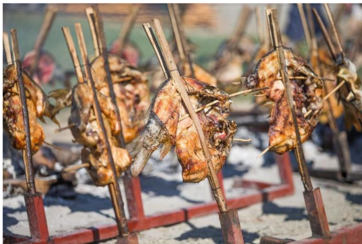
Slika 9. Ribarski dani u Kopačevu

Manifestacija karakteristična za selo Kopačevo, koja se održava u drugom ili trećem vikendu u mjesecu rujnu su Ribarski dani u Kopačevu. Manifestacija je po prvi put održana prije dvadesetak godina sa svega nekoliko okupljenih mještana, dok je danas prepoznata kao iznimno važan događaj koji okuplja više desetaka tisuća posjetitelja. Za vrijeme manifestacije, cijelim selom vladaju mirisi fiš paprikaša, nepregledni nizovi šarana nataknutih na rašlje te proizvodi lokalnih obiteljskih gospodarstava.