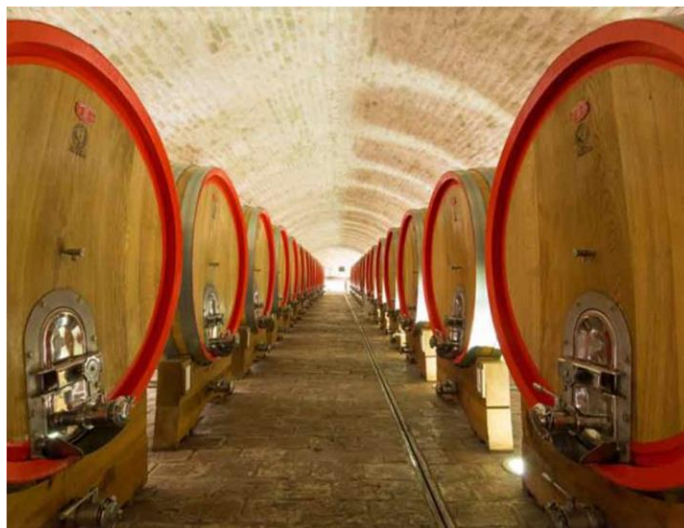
Slika 7. Vinski podrum Belje