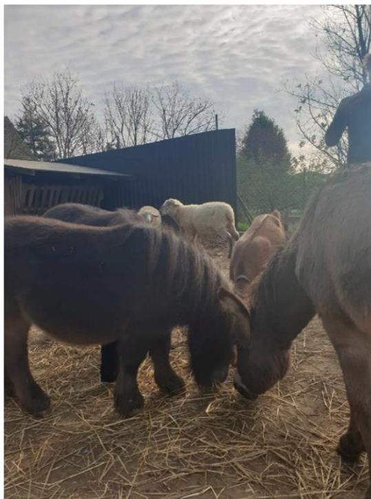
Slika 12. Uzgoj krupnih domaćih životinja na obiteljskom poljoprivrednom gospodarstvu „Duša Baranje“