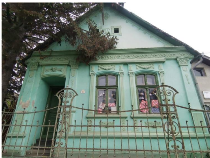
Slika 11. Obiteljsko poljoprivredno gospodarstvo „Duša Baranje“