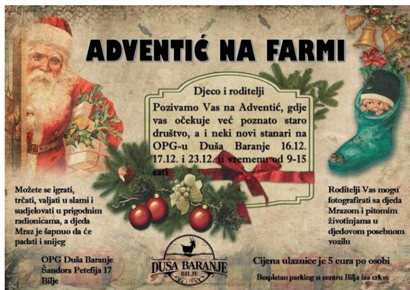
Slika 14. Božićna radionica „Adventić na farmi“