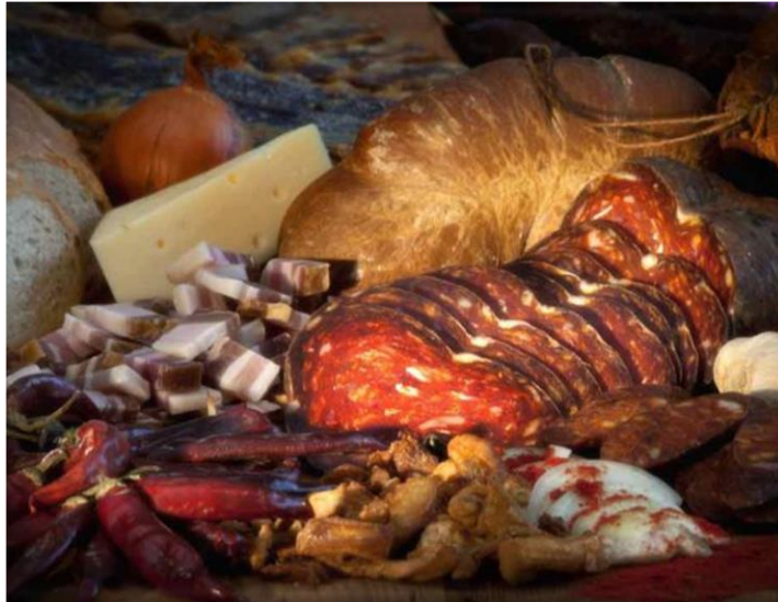
Slika 6. OPG Petar Dobrovac, baranjski kulen

daju prepoznatljivu boju, miris i okus. Sušenje je proces koji traje svega dvadesetak dana te se nakon dimljenja kulen skladišti u pušnici ili se sprema na tavan. Zbog izuzetne važnosti za panonsku Hrvatsku, Slavoniju, Baranju i Srijem, kulen je uvršten u Listu zaštićenih kulturnih dobara Republike Hrvatske.