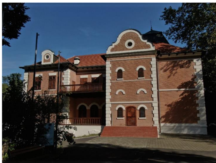
Slika 3. Kompleks dvorca Tikveš