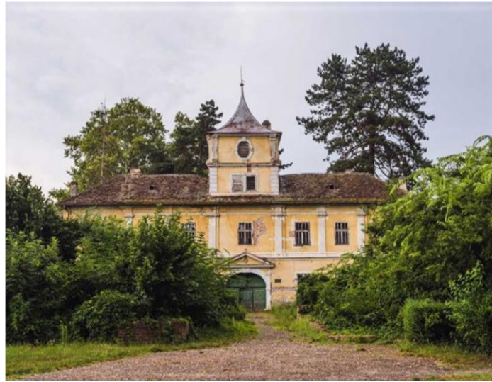
Slika 8. Dvorac Eugena Savojskog

započela 2006. godine s ciljem očuvanja kulturne baštine, umjetnosti, književnosti te raznih drugih bogatstava karakterističnih za područje Bilja i okolice.