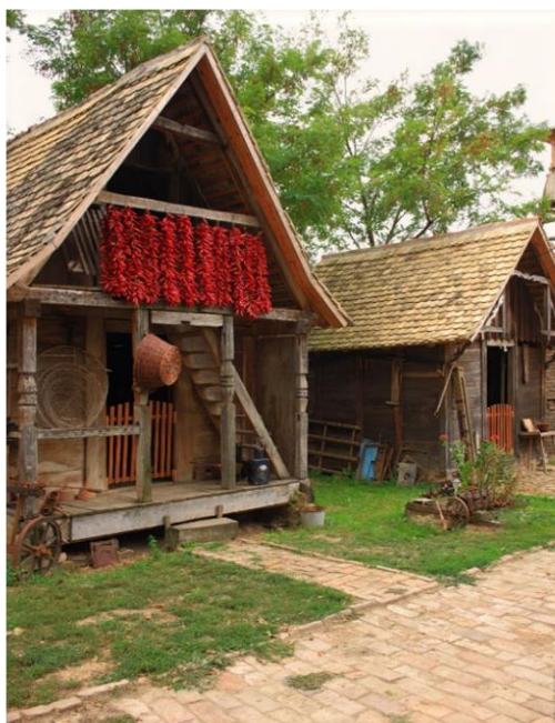
Slika 4. Ulica zaboravljenog vremena