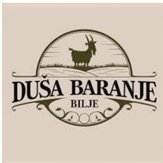
Slika 10. Logo obiteljsko poljoprivrednog gospodarstva „Duša Baranje“

U samom centru Bilja, u dvorištu gotovo stogodišnje kuće, nalazi se obiteljsko poljoprivredno gospodarstvo „Duša Baranje“. Ideja za osnivanjem obiteljsko poljoprivrednog gospodarstva „Duša Baranje“, nastala je kada su vlasnici gospodarstva, Sanja i Danijel Antonović odlučili zajedno s djecom posjestiti kamp bez struje u Lici. Istraživanjem prirodnih ljepota i kulturnih znamenitosti koje su ih okruživale, naišli su na mljekaru u blizini koje su mogli jahati konje i vidjeti magarce te razne druge životinje, što ih je posebno oduševilo te ističu kako će im taj trenutak zauvijek ostati urezan u sjećanje te kako ga se često s veseljem i radošću prisjete. Upravo je taj događaj bio ključan te je vlasnike obiteljsko poljoprivrednog gospodarstva „Duša Baranje“, Sanju i Danijela potaknuo na veće i detaljnije razmišljanje o realiziranju zamišljenog projekta.