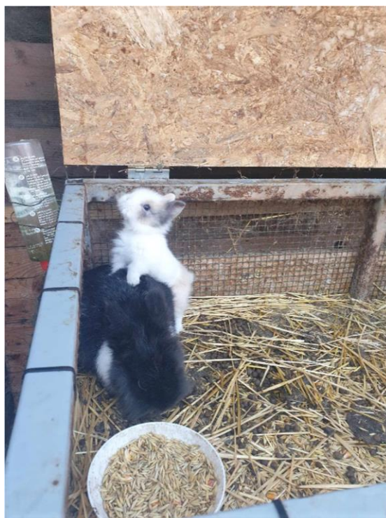
Slika 13. Uzgoj sitnih domaćih životinja na obiteljskom poljoprivrednom gospodarstvu „Duša Baranje“