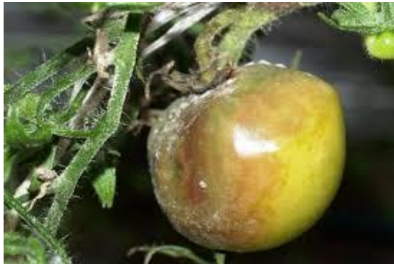
Slika 7. Bijela trulež na rajčici