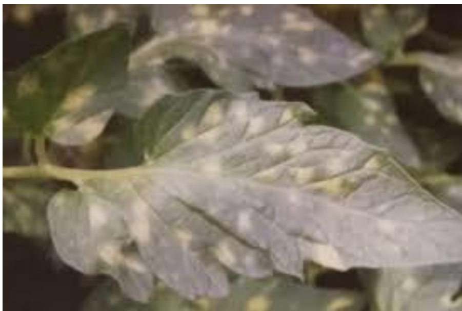
Slika 9. Baršunasta plijesan na rajčici