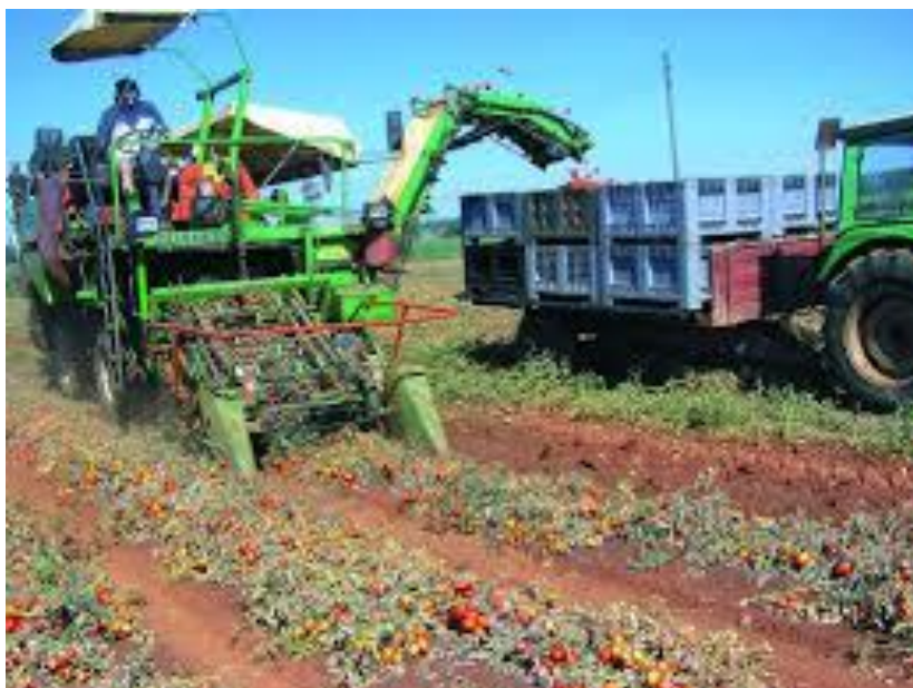
Slika 5. Mehanizirana berba rajčice