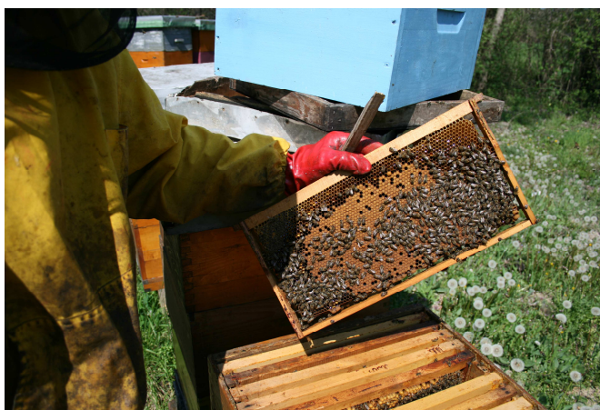
Slika 16 : Pojačavanje leglom

Pojačavanje pčelinjih zajednica pred glavnu pašu provodi se s ciljem maksimalnog iskorištavanja nadolazeće paše, tj. postizanja što većeg prinosa meda po košnici, a što postižemo povećanjem broja pčela u zajednici. Samo pojačavanje radimo dodavanjem okvira s poklopljenim leglom, prema vlastitoj procjeni (Slika 16). Okvire s leglom dodajemo najmanje petnaest dana prije početka glavne paše iz razloga da se dodano leglo izlegne i oslobodi prostor za smještaj nektara. Kod AŽ košnica pojačavanje vršimo leglom iz pomoćnih zajednica (Slika 17), dok kod LR košnica pojačavanje vršimo spajanjem nedovoljno jakih zajednica koje nisu u stanju donijeti značajne količine meda.