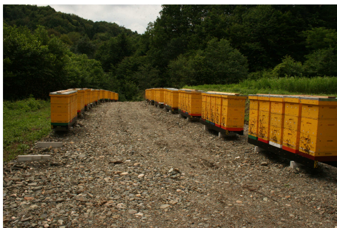
Slika 4: Otvoreni pčelinjak

Otvoreni pčelinjaci. Kod ove vrste pčelinjaka košnice su pojedinačno ili u grupama, postavljene na otvorenom prostoru (Slika 4.).