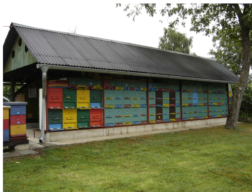
Slika 2: Stacionarni pčelinjak

U velikom broju slučajeva, kada je izbor mjesta za pčelinjak u pitanju, pčelari ne mogu baš mnogo birati. Međutim, uvijek kada je moguće treba pri izboru mjesta za pčelinjak birati terene koji su blizu pčelarevog prebivališta, zaštićene od jakih vjetrova, blago nagnute k jugoistoku i što bliže podnožju. Mjesto mora biti ocjedito i udaljeno od prometnica, kao i od visokonaponskih električnih vodova i jačih trafostanica. Bitno je isključiti mogućnost da pčele budućeg pčelinjaka ometaju susjede, kao i ljude i domaće životinje koji koriste uobičajene prolaze i poljoprivrednike na imanju. (Laktić, Z. 2008.) Potrebno je pridržavati se uputa propisanih u Pravilniku o držanju pčela i katastru pčelinje paše. («Narodne novine» br. 18/08., 29/13., 42/13., 65/14).