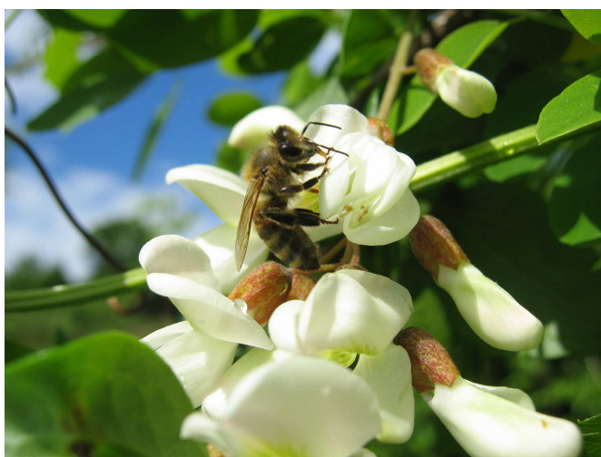
Slika 13 : Pčela na bagremu

Pčelarima je najvažniji dio biološkog kapaciteta pčelinjih zajednica skupljački kapacitet. Ukupne mogućnosti radnog nagona u pčelinjoj zajednici čine njegov skupljački kapacitet. U kojoj mjeri će se manifestirati, odnosno koliko će biti meda i ostalih pčelinjih proizvoda, zavisi još najviše od paše, vremenskih prilika i umijeća pčelarenja. U praksi se često susrećemo s dvije pojave. Prva je da ako i učinimo sve isto u svim košnicama, njihov razvoj, broj pčela i količina sakupljenog meda neće biti ista. Druga je da i kada imamo dvije zajednice koje su jednake po broju pčela, njihov rezultat neće biti jednak, ne samo po količini meda koju će skupiti, već i po tom što će se jedna rojiti, a druga neće.