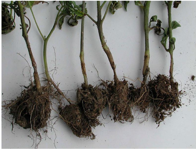
Slika 13. Trulež korijena rajčice uzrokovana patogenom gljivom A. alternata . www.omafra.gov.on.ca/IPM/english/tomatoes/diseases-and-disorders/damping-off.html