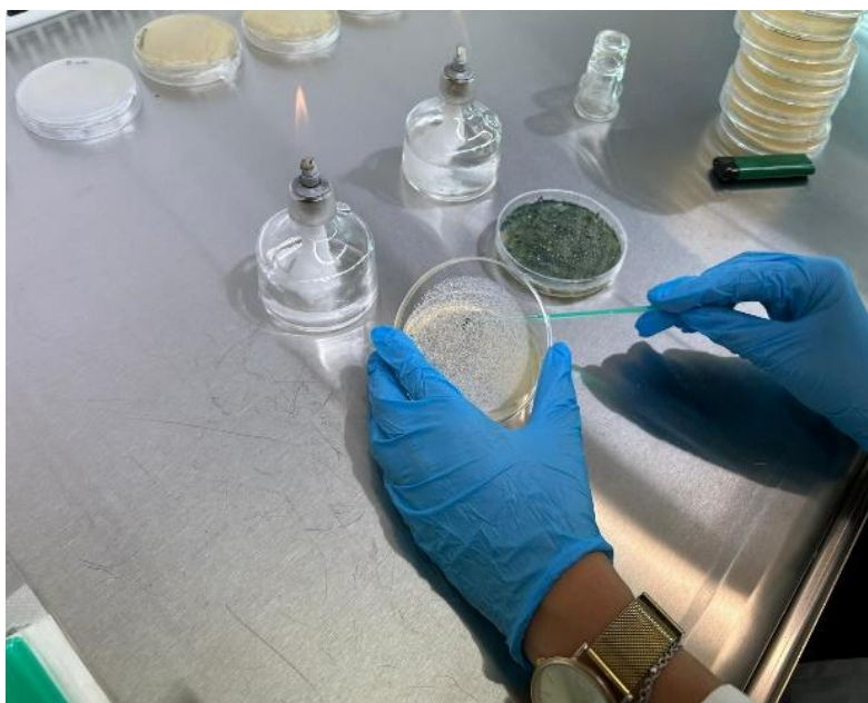
Slika 2. Nacjepeljivanje bakterija na polovicu Petrijeve zdjelice