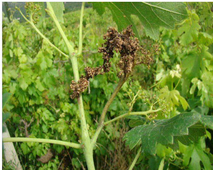
Slika 4. Simptomi plamenjače na bobama

Cvjetna kapica na cvijetu se može zaraziti i prije njegova otvaranja. Dolazi do posmeđivanja i sušenja. Sporangiofori sa sporangijima mogu se javiti na cvatu za vlažnog vremena, a dio ili čitav cvat ima bijelu prevlaku. Do potpunog sušenja peteljkovine dolazi ako je zahvaćena veća površina, a ako je samo djelomično zahvaćena onda se zajedno sa cvatom peteljka spiralno savije. Zaraza boba (slika 4.) se može dogoditi od zametanja sve do promjene boje dok ne počnu omekšavati. Bobe koje su zaražene neposredno nakon cvatnje imaju bijelu prevlaku koja potječe od sporonosnih organa parazita. Do infekcija preko puči peteljkovine dolazi kada puči na bobama prestanu funkcionirati, a to je kada bobe prijeđu jednu trećinu veličine karakteristične za određenu sortu. Pokožica boba postaje kožasta izgleda i dobiva ljubičasto – smeđu boju, a bobe se smežuraju. U grozdu je najčešće zaraženo nekoliko boba, a ostale se razvijaju normalno. Mladice su najosjetljivije na zarazu kada su dužine od 10 do 15 cm, ali su rijetko kad zaražene. Na njima se javlja bijela prevlaka ako su zaražene, a tkivo odumire i poprima razne nijanse smeđe boje. Mladica se osuši ako je veći dio mladice zaražen ( https://pinova.hr/plamenjaca-vinove-loze/ ).