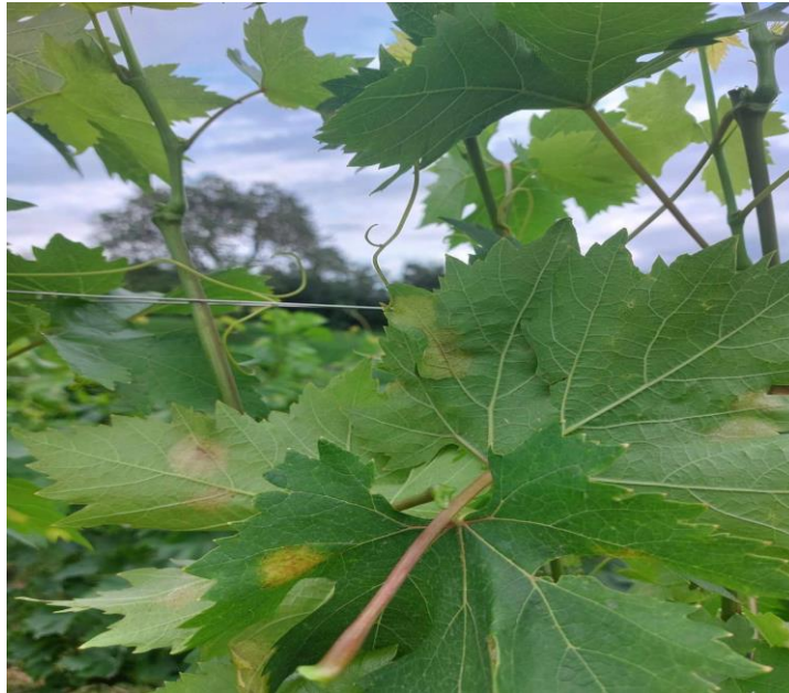
Slika 9. Simptomi plamenjače na licu i naličju lista

Pojava simptoma plamenjače na licu i naličju lista (slika 9.) uočena je krajem mjeseca svibnja, početkom lipnja. Intenzitet zaraze bio je neznatan, ukupno na oko 20 trsova.