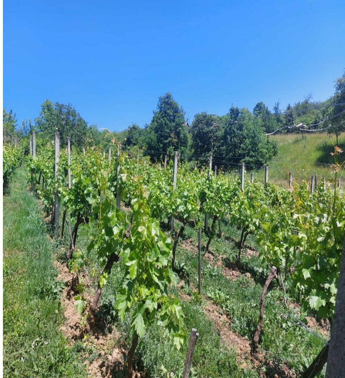
Slika 6. Vinograd OPG-a Cipar Ivan

Istraživanje za izradu diplomskog rada provedeno je u vinogradu OPG-a Cipar Ivan (slika 6.), mjesto Bartolovci u blizini Slavonskog Broda.