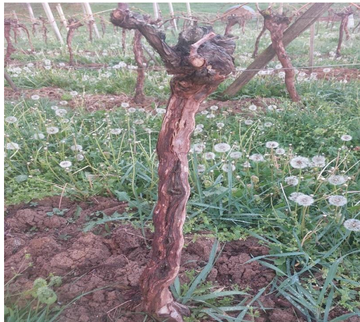
Slika 10. Simptomi eske

Pojava simptoma eske (slika 10.) uočena je krajem mjeseca lipnja. Intenzitet zaraze bio je slab, ukupno na 5 trsova. Trsovi su odmah izvađeni i zapaljeni izvan vinograda.