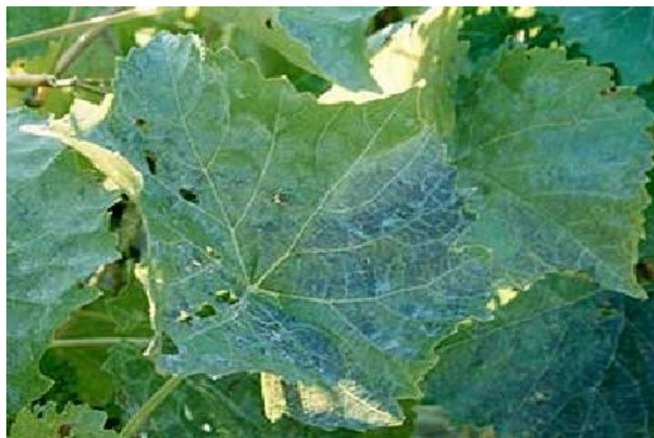
Slika 3. Simptomi pepelnice na listu

Na bobama nastaju najznačajnije štete. Bobe mogu biti napadnute od zametanja pa sve do promjene boje. Kada bobe dosegnu od 2 do 3 mm u promjeru nakon oplodnje, mogu biti potpuno pokrivene pepeljastim maškom koji potječe od micelija i oidija. Bobe izgledaju kao posute pepelom u slučaju jakih zaraza. Dolazi do zastoja u rastu kod bobica koje su zaražene neposredno nakon oplodnje, a pokožica im je znatno tvrđa i deblja nego kod nezaraženih bobica. Kod bobica koje su zaražene u fazi aktivnog rasta dolazi do pucanja. Uz pepeljastu prevlaku to je najkarakterističniji simptom. Štete obično nisu velike kod kasnih napada kada bobice prestaju s rastom osim kod bijelih stolnih sorata jer se na njima vide tamnije mrežaste zone. To umanjuje estetski izgled i samim time i tržišnu vrijednost grožđa ( https://pinova.hr/pepelnica-vinove-loze/ ).