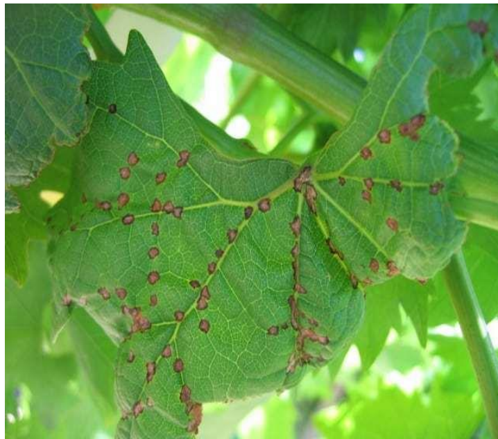
Slika 1. Simptomi crne pjegavosti na listu

prolistaju. Otežano je formiranje čokota i to sve utječe na urod. Na peteljka cvata javljaju se tamnosmeđe zone koje su različitih oblika, a okružene su svijetlim rubom. Listovi uz glavne žile u početku vegetacije imaju jednu ili nekoliko nekroza koje su u promjeru 2-3 mm i okružene žućkastim prstenom. Dio plojke koji je zaražen se nabora i deformira, a ona zaostaje u rastu. Na najdonjim internodijima mladica pojavljuju se najčešće krajem svibnja tamnoplave nekroze duguljasta oblika koje su zašiljene na krajevima. Mladice koje imaju nekroze se lome zbog vjetra ili pod teretom roda. Na zelenim mladicama se ne formiraju piknidi (Cvjetković, 2010.).