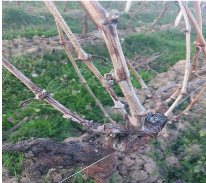
Slika 7. Simptomi crne pjegavosti rozgve

Pojava simptoma crne pjegavosti rozgve (slika 7.) uočena je krajem mjeseca svibnja, početkom lipnja. Intenzitet zaraze bio je srednje jak, ukupno na oko 30 trsova.