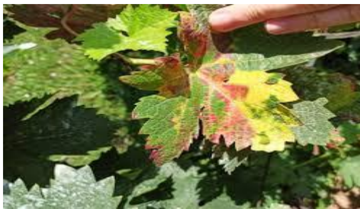
Slika 2. Simptomi eske na listu