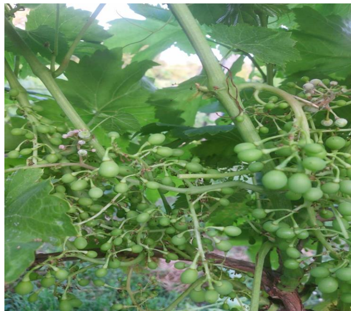
Slika 8. Simptomi pepelnice na grozdu

Pojava simptoma pepelnice na grozdu (slika 8.) uočena je početkom mjeseca svibnja i krajem lipnja. Intenzitet zaraze bio je neznatan, ukupno na oko 10 trsova.