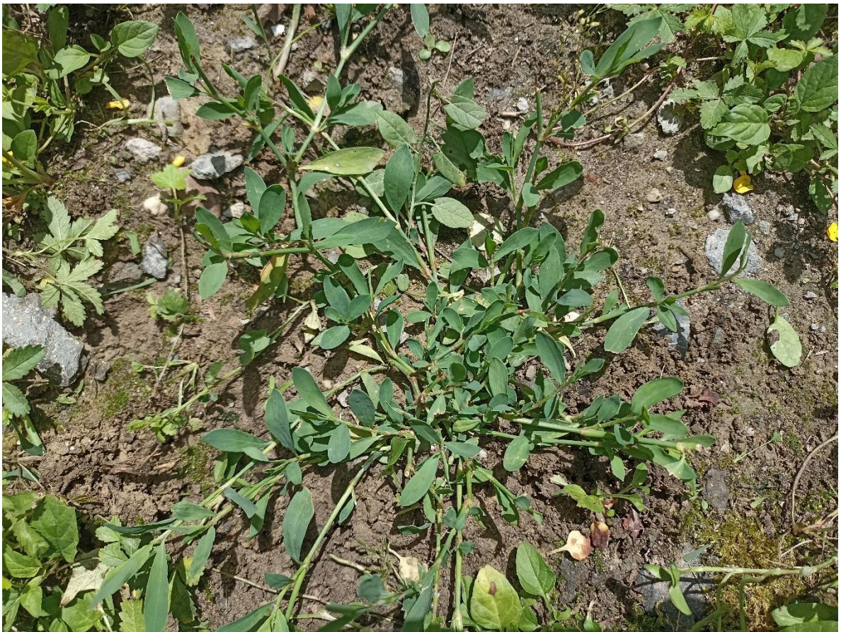
Slika 8. Ptičji dvornik ( P. aviculare )

Ptičji dvornik ( P. aviculare ) biljka iz roda Polygonum i porodice dvornici. Jednogodišnja biljna vrsta, visine 10-50 cm (Slika 8.).