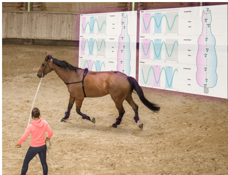
Slika 4. Prikaz mjerenja vertikalnih asimetrija uz pomoć senzora na glavi, grebenu i zdjelici

pronađena je između vertikalnih asimetrija i percepcije jahača, takva da su sa strane na kojoj se pod pretpostavkom nalazi „slabija stražnja desna noga“, odnosno ona koju konj ne želi opteretiti, minimalne vrijednosti gibanja zdjelice izraženije. U njihovom je istraživanju objektivna analiza kretnji provedena uz pomoć sustava inercijalnih mjernih jedinica (IMU) koji se sastojao od dva akcelerometara i jednog žiroskopa. Isti sustav koriste Zetterberg i sur. (2023.) koji kod ždrijebadi dokazuju da su minimalne vrijednosti senzora postavljenima na zdjelici izraženije na desnoj strani, što otvara mogućnost nizu novih istraživanja povezanih s vertikalnim asimetrijama i lateralnošću konja.