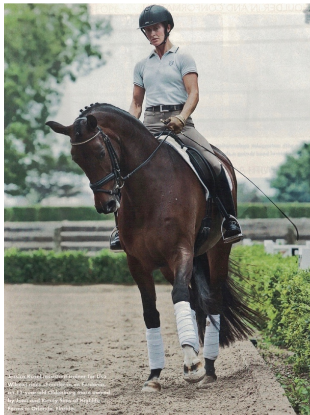
Slika 6. Priananje plečke u desno

mehanizam propriocepcije, koja podrazumijeva svjesnost o položaju i pokretima tijela te naporu, vremenu i sili mišićnih kontrakcija (Boden, 2013., cit. prema Bishopu, 2003.; Behmu i sur., 2006.). Promjene u orijentaciji tijela jahača odvijaju se uz niz drugih potrebnih signala kojeg daje konju preko raspodjele težine, promjene položaja nogu ili ciljano asimetričnog primjenjivanja pritiska nogu (De Cocq i sur., 2010., cit. prema Hölzelu i sur., 1992.). Distribucija težine jahača tijekom izvođenja primanja plečke je tema rasprave obzirom da stručna literatura nalaže pritisak na unutarnjoj strani sedla, a opće pravilo drugačije (De Cocq i sur., 2010.). Baxter i sur. (2022.) tvrde da je prilikom izvođenja primanja plečke jahačeva zdjelica paralelna sa sapima konja dok se trup, glava i ruke jahača okreću prema unutra, tako da je vanjski dizgin naslonjen na vrat konja, jahačeva unutarnja noga stoji kod kolana i primjenjuje pritisak. Kombinacija pritiska unutrašnje noge i napetosti vanjskoga dizgina rezultira pomicanjem konja bočno (Slika 6.). De Cocq i sur. (2010.) pak tvrde da je mjerenjem pritiska na sedlu utvrđeno da je pritisak veći na vanjskoj strani sedla, što ujedno odgovara i jednostavnom primanju koje se izvodi prije primanja plečke.