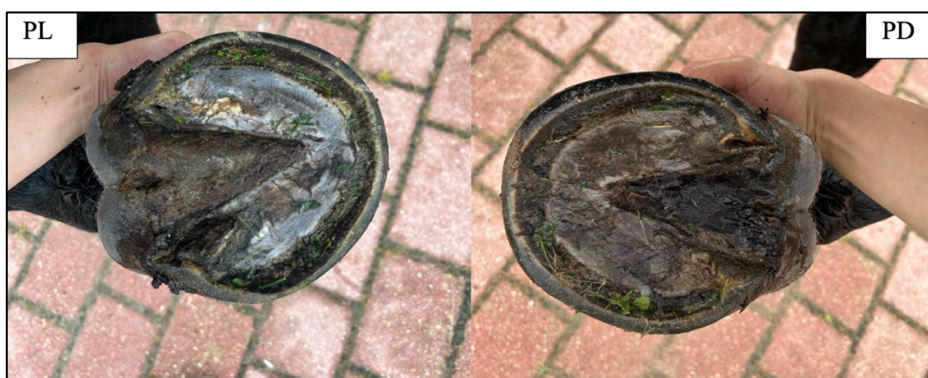
Slika 1. Različita konformacija kopita prednjih nogu (PL – prednje lijevo, PD – prednje desno kopito)

lateralnosti odnosno one koja zauzima širi asimetrični stav na ispaši. Lijevo je kopito kod čak 70% konja šire nego desno (Kuhnke, 2020., cit. prema Kummeru i sur., 2006.), ali važno je za napomenuti da potkivači uvelike utječu na simetriju kopita. Samo je jedan od primjera istraživanje Ronchetti i sur. (2011.), u kojem je utvrđeno da desnoruki potkivači imaju sklonost za preobrezivanje medijalnog dijela lijevog kopita i lateralnog dijela desnog kopita prednje noge.