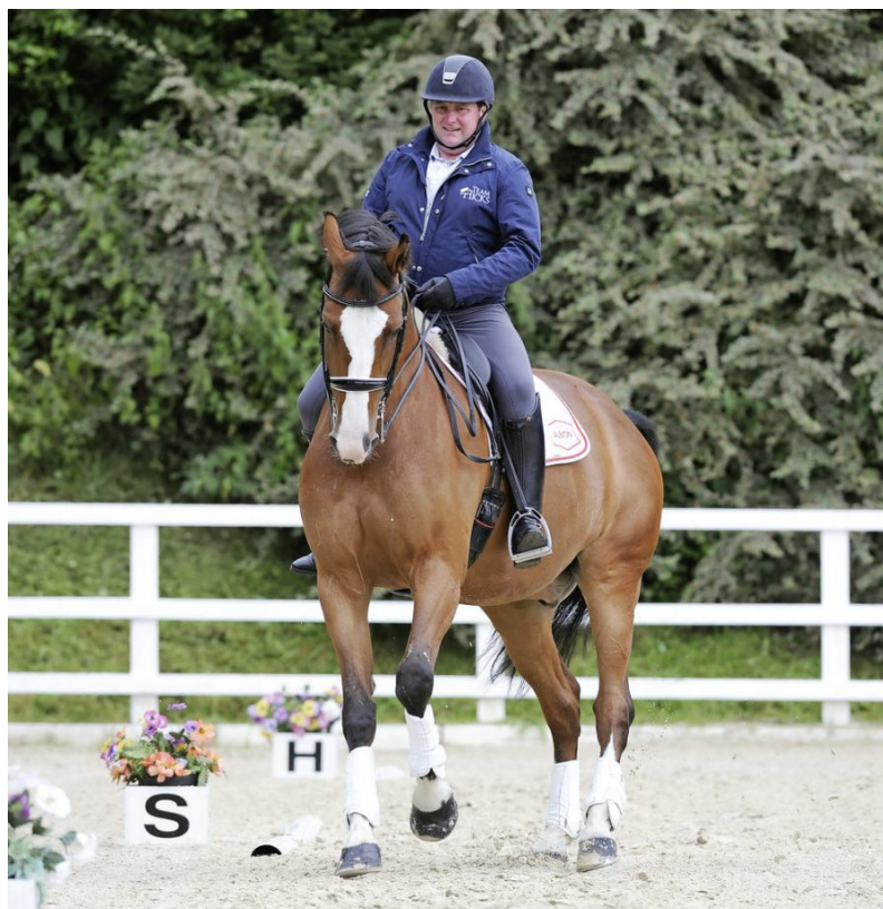
Slika 7. Primanje sapi (travers) u lijevome galopu

(Izvor: https://www.yourhorse.co.uk/horse-riding-training/schooling-dressage/the-trick-to-travers/ )