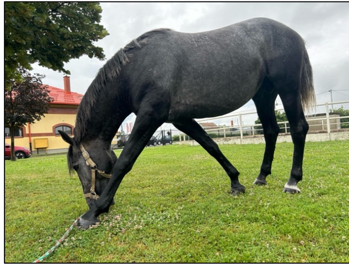
Slika 2. Značajno ispružena lijeva noga na ispaši

malu razliku između lijevo i desno lateraliziranih konja moguće tvrditi da su ti omjeri gotovo podjednaki (Crosby, 2021., cit. prema Cullyju i sur., 2018.; Grzimeku, 1968.).