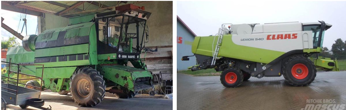
Slika 3. Kombajni upotrebljavani u uzgoju pšenice

Slika 3 prikazuje dvije vrste kombajna uz pomoć koji je obavljena žetva na istraživanim OPG-ovima.