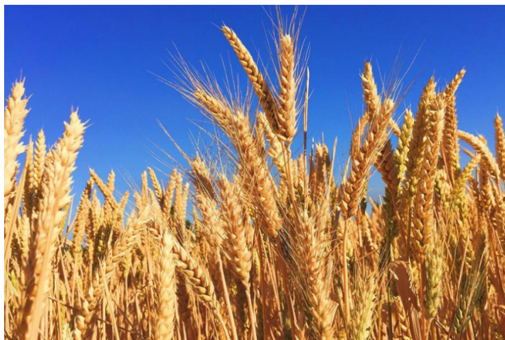
Slika 1. Pšenica „Sofru“

Primjetno je kako se površina posijane pšenice povećava, a prinos tona po hektaru se smanjuje, mnogobrojni autori navode različite čimbenike koje mogu utjecati na ovaj podatak kao što su vodozračni odnosi u tlu, negativni utjecaj klime, loš izbor obrade tla, neprovođenje tri prihrane u optimalnim rokovima i drugi.