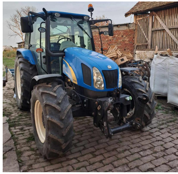
Slika 2. Traktori upotrebljavani u uzgoju pšenice