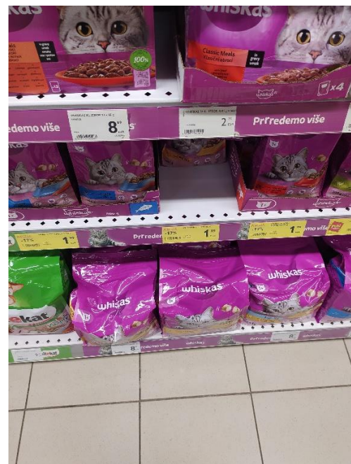
Slika 2. Whiskas