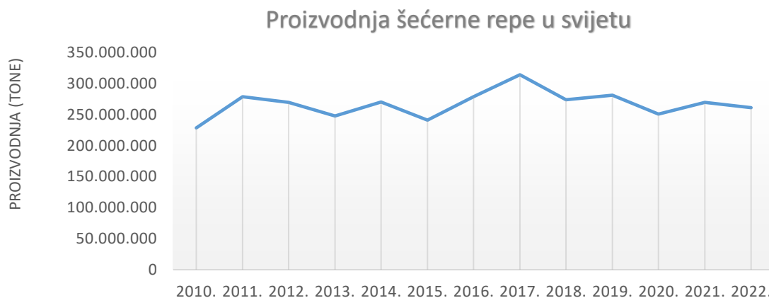
Grafikon 1. Globalna proizvodnja šećerne repe u svijetu za razdoblje od 2010. do 2022. godine (FAOSTAT, 2024.).

Iako proizvodnja šećerne repe zahtjeva puno volje, rada, znatna ulaganja, veliko znanje, precizno planiranje te pažljivu njegu, vrlo je profitabilna industrijska kultura (Bažok i sur., 2015.). Kako bi se postigla željena razina proizvodnje, potrebno je obratiti pozornost na različite čimbenike kao što su to: klimatski uvjeti, zahtjevi prema tlu, izbor sortimenta sjemena te napredak tehnoloških inovacija. Na proizvođačima šećerne repe je izazov pronalaska ravnoteže između održivosti i profitabilnosti.