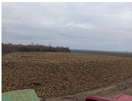
Slika 8. Izvađena repa na deponiju (Ligda, 2020.)