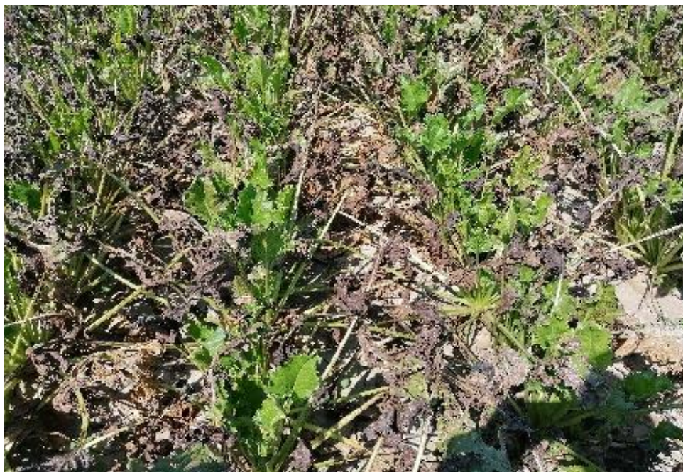
Slika 10. Bolest Cercospora beticola Sacc. na lišću (Ligda, 2018.)

Na OPG-u „Ivica Ligda“ dvije proizvodne godine (2018. i 2019.) se pamte po bolesti Cercospora beticola Sacc. (Slika 10.). Proizvođači šećerne repe su zatečeni tom situacijom jer su sva tretiranja obavljena pravovremeno i pravovaljano (Tablica 5., Slika 13.), no učinak zaštite repe od te bolesti je izostao. Šećerana u Virovitici je tijekom 2018. godine izvršila analizu zaraženih listova bolešću Cercospora beticola Sacc. mikroskopom, gdje je mikroskopsko povećanje iznosilo 1000 x (Slika 11. i 12.).