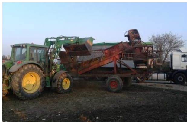
Slika 9. Pročišćavanje i utovar šećerne repe (Ligda, 2020.)