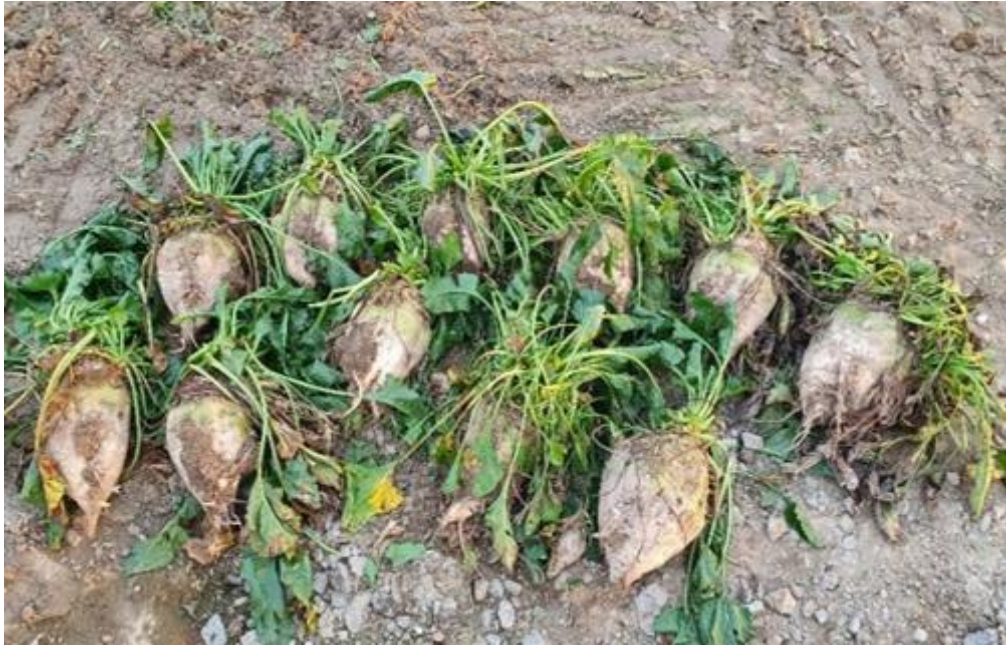
Slika 15. Korijen šećerne repe 2021. godine (Ligda, 2021.)

Godinu 2022. je obilježilo izrazito sušno ljeto, a jesen je bila izuzetno kišna. Iz navedenog razloga, došlo je do retrovegetacije lišća te ujedno i do smanjena digestije. Vađenje šećerne repe je bilo sredinom studenog kako bi prinos korijena šećerne repe bio što veći zbog kiša koje su bile u jesen.