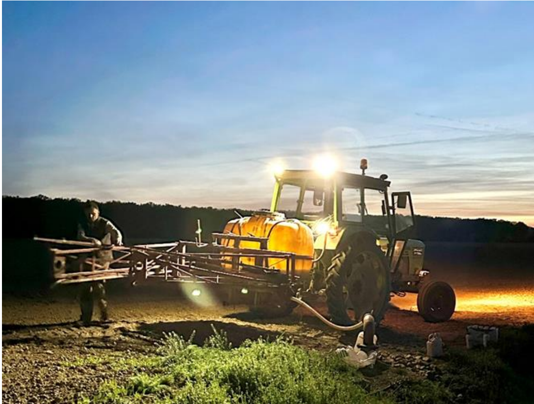
Slika 13. Pripremanje prskalice za upotrebu (Ligda, 2021.)

Iz Tablice 5. vidljivo je kako je provedeno 5 tretmana, no učinak o sprječavanju pojave bolesti Cercospora beticola Sacc. je izostao jer registrirana sredstva tih godina nisu bila učinkovita na tu bolest. U svim tretmanima koristilo se što se više moglo različitih sredstava kako bi se smanjila rezistentnost biljke na primjenjena sredstva. Zbog rane pojave te bolesti, došlo je do drastičnog smanjenja uroda i digestije.