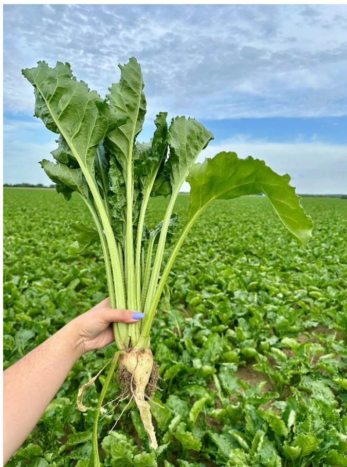
Slika 1. Šećerna repa u fazi ukorjenjivanja (Ligda, 2022.)

Šećerna repa ( Beta vulgaris L.) je dvogodišnja industrijska biljka iz porodice loboda ( Chaenopodiaceae ) (CFIA, 2012.) te je, uz šećernu trsku, glavni izvor šećera saharoze (FAO, 2009.). Iako prvi počeci uzgoja šećerne repe datiraju iz antičkih vremena, proces domestikacije započinje u 18. stoljeću eksperimentalnom ekstrakcijom šećera kemičara Andreasa Marggrafa u Njemačkoj te izgradnjom prve šećerane u Silesii (područje današnje Poljske) (Britannica, 2024.). Smatra se kako je šećerna repa porijeklom iz južne i srednje Azije (Gagro, 1998.), a njezin ekspanzivni uzgoj u Europi rezultat je otkrića Perzijanaca i Grka tijekom putovanja te uvoza šećerne repe u zapadni dio Europe (FAO, 2009.).