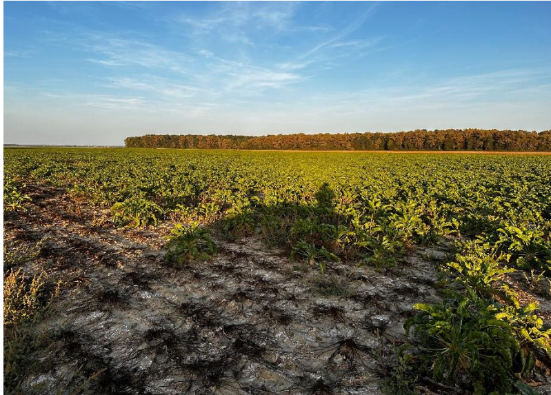
Slika 16. Trula repa u oazama na njivi 2023. godine (Ligda, 2023.)

Šimunić (2020.) navodi kako su optimalne temperature za rast i razvoj šećerne repe do 25 °C, a minimalna temperatura za klijanje i nicanje je 5 – 6 °C. S obzirom da ljeti u Slavoniji nerijetko temperature prelaze 30 °C te, uz smanjenju količinu oborina, dolazi do propadanja usjeva. Ujedno, autor navodi kako je period najveće akumulacije šećera u korijenu od kolovoza do vađenja šećerne repe. Tada je iznimno važna količina vlage u tlu.