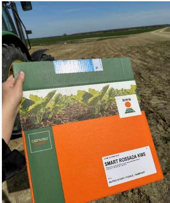
Slika 4. Sjeme šećerne repe „Rasada (Ligda, 2023.)