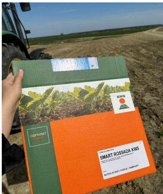
Slika 4. Sjeme šećerne repe „Rasada (Ligda, 2023.)