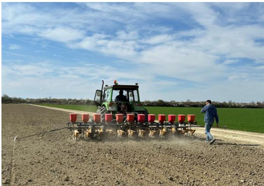
Slika 3. Sjetva šećerne repe 2023. godine na OPG-u „Ivica Ligda“ (Ligda, 2023.)

Sjetva šećerne repe 2018. godine je obavljena krajem ožujka na površini od 43 hektara. U sjetvi je utrošeno 110 000 sjemenki po hektaru, a sjeme je iz sjemenarske kuće KWS – hibrid Terranova. Sredinom ožujka 2019. godine je obavljena sjetva na površini od 41 hektar. Utrošeno je 110 000 sjemenki ha^{-1} , hibridi Terranova i Smart Belamie. U sjetvi 2020. godine utrošeno je 115 000 sjemenki po hektaru hibrida Belamia. Sjetva je započela u drugoj polovici ožujka, a zasijano je 40,5 hektara. U proizvodnoj godini 2021. sjetva je započela krajem ožujka na površini od 40,5 hektara. Korišteni su hibridi Smart Rosada i Smart Djerba, a utrošeno je 110 000 sjemenki (po hektaru). Za sjetvu u 2022. godini je utrošeno 115 000 sjemenki po hektaru hibrida Smart Rosada. Sjetva je započela krajem ožujka, zasijano je 42,5 hektara. Proizvodna godina 2023. je započela sa sjetvom šećerne repe krajem ožujka-početkom travnja (Slika 3.). Utrošeno je 110 000 sjemenki po hektaru, a zasijano je 41 hektar. Hibridi su Samrt Perla i Samrt Rasada (Slika 4.).