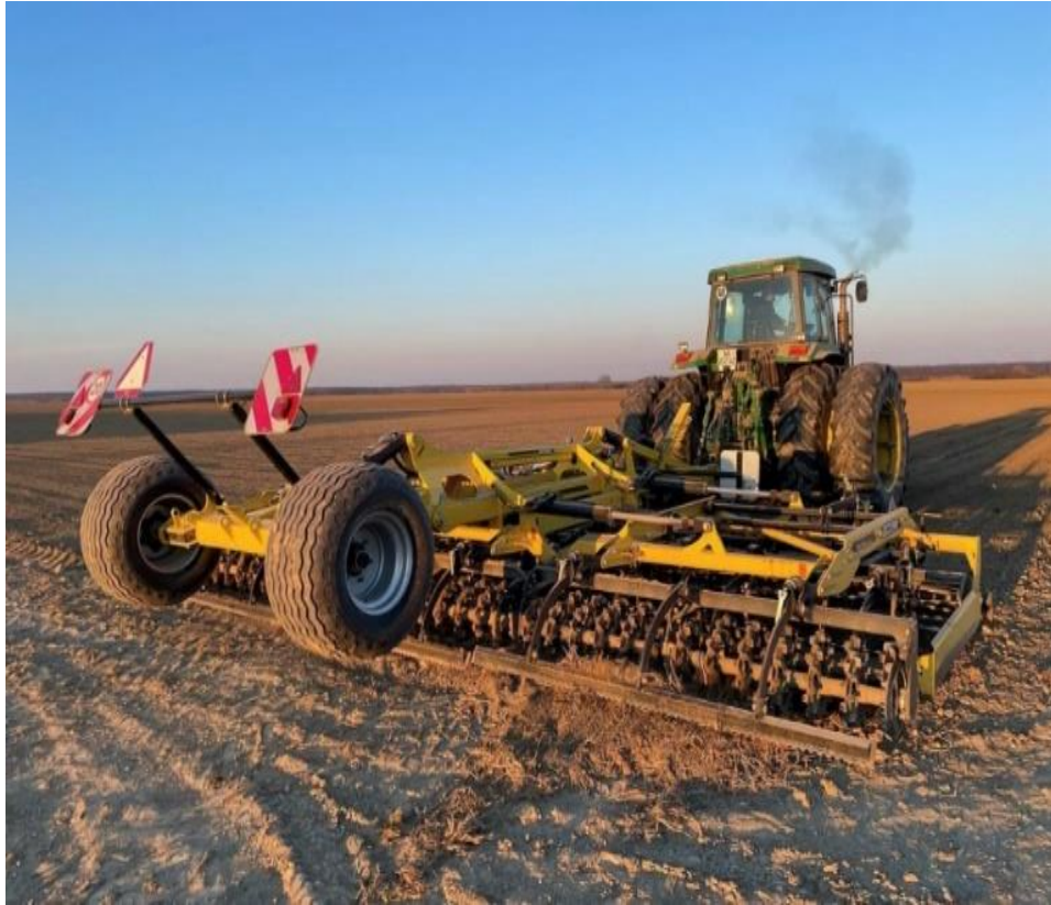
Slika 6. Priprema tla sjetvu spremačem za sjetvu šećerne repe (Ligda, 2022.)

Za razliku od agrotehnike prethodne tri godine, agrotehnika za 2021., 2022. i 2023. godinu se razlikuje. Stoga je, početkom srpnja, obavljena plitka obrada Gruberom nakon čega je zasijana postrna soja. Fosfor i kalij dodaju se obično prije sjetve, dok se dušik aplicira nekoliko puta. Ukupna količina dušika iznosi između 160 i 250 kg/ha (Draycott, 2006.). U jesen je postrna soja zaorana i bačeno je 350 kg/ha KCl-a (60 %) i 175 kg/ha MAP-a (12% N i 52% P). Pred sjetvu je bačeno 200 kg/ha KAN-a i zatim je izvršena priprema tla sjetvospremačem u dva prohoda. Prema Rešiću (2014.), kod osnovne obrade je važno izvođenje po suhome pri svim operacijama.