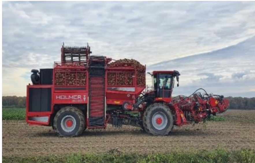
Slika 7. Vađenje šećerne repe (Ligda, 2019.)

Vađenje šećerne repe provedeno je samohodnim kombajnima. U proizvodnim godinama 2018. i 2019. provedeno je vađenje krajem rujna, 2020. i 2021. krajem listopada dok je 2022. godine vađenje provedeno tijekom sredine studenoga, a 2023. godine vađenje je započelo sredinom listopada.