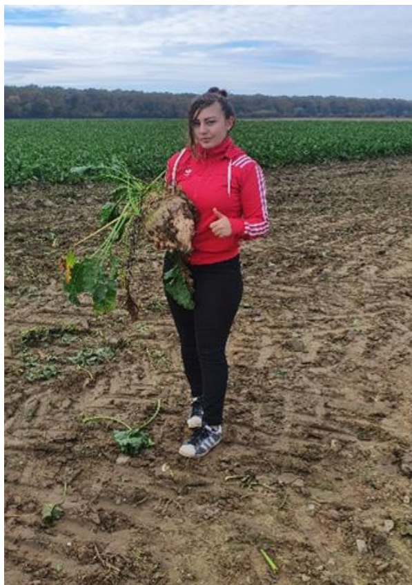
Slika 14. Korijen šećerne repe teži od 2 kg (Ligda, 2021.)

U proizvodnoj godini 2021. vađenje repe je započelo krajem listopada (repa je bila zdrava), a prosječan prinos korijena iznosio je 95,6 t ha -1 , uz sadržaj šećera od 17,6%. Najveći prinos i sadržaj šećera po godinama, ostvareni su upravo 2021. godine. (Slika 14.), prikazuje korijen šećerne repe koji je teži od 2 kilograma, dok (Slika 15.) prikazuje korijene šećerne repe u 2021. godini.