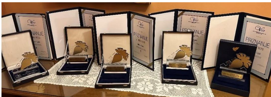
Slika 2. Priznanja i Zlatne repe OPG-u „Ivica Ligda“ (Ligda, 2023.)

Istraživanje je provedeno na OPG-u „Ivica Ligda“ čije sjedište je u Jelisavcu (općina Našice). OPG je u vlasništvu Ivice Ligde. Ukupno se obrađuje 200 hektara zemlje te su zaposlene 2 osobe. Proizvodnja šećerne repe na OPG-u „Ivica Ligda“ ima dugu tradiciju koja je započela 1993. godine osnivanjem djedovog OPG-a „Josip Ligda“. Generacijskim preuzimanjem djedovog OPG-a, Ivica Ligda povećava površine za sjetvu šećerne repe. U prilog uspješnosti poljoprivredne proizvodnje na OPG-u „Ivica Ligda“ govore 5 osvojenih nagrada „Zlatna repa“ (Slika 2.) .