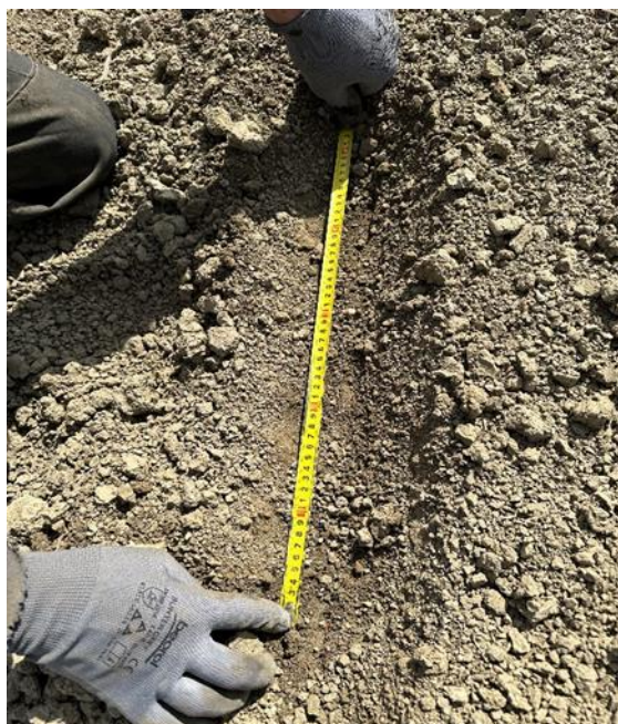
Slika 5. Razmak unutar redova sjetve repe (Ligda, 2023.)