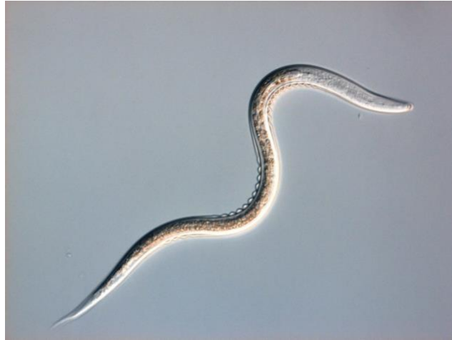
Slika 2. Entomopatogena nematoda iz roda Heterorhabditis