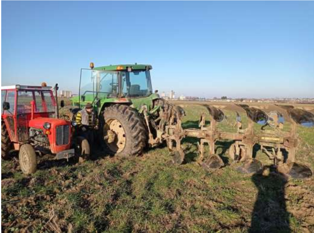
Slika 2. Priprema zemljišta