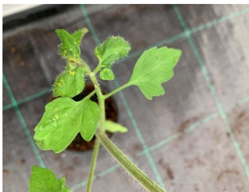
Slika 13. Lisne uši na listu rajčice.

Pojava lisnih ušiju je opasna jer izazivaju zastoje u rastu biljke i dolazi do kovrčanja listova. Iza njih ostaje medna rosa koja kaplje po donjim listovima čineći ih ljepljivim gdje se nakon toga razvijaju gljive čađavice. Lisne uši su vektori virusa. Javljaju se u proljeće i jesen za vrijeme toplog i suhog vremena kao i nakon obilnih kiša. Prirodni neprijatelj lisnih ušiju je bubamara.