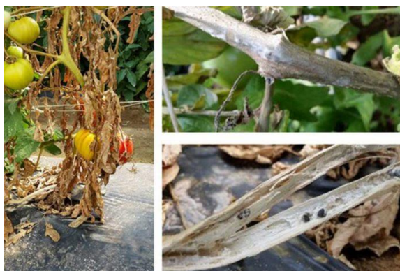
Slika 7. Bijela trulež rajčice.

Bijelu trulež uzrokuje polifagni parazit Sclerotinia sclerotiorum . Kod pojave bolesti glavni izvor zaraze su sklerociji. Sklerociji kličaju u micelij ili apotecij s askusima i askosporama. Klijanjem sklerocija u tlu dolazi do stvaranja micelija koji se prvo nastanjuje na mrtvu organsku tvar, a zatim prodire u korijen i vrši zarazu. Ako se bolest pojavi na stabljici zarazu obavljaju askospore. Hife iz proklijalih askospora se šire s lista na lisnu peteljku i stabljiku. Rajčica je na bijelu trulež osjetljiva u svim razvojnim stadijima, iako se prvi simptomi uočavaju u cvatnji. Zaraza se pojavljuje na stabljici u razini tla, iako ulazna mjesta za gljivu mogu biti pazušci zaperaka ili rane otkinutih zaperaka (Ivić, 2016.).