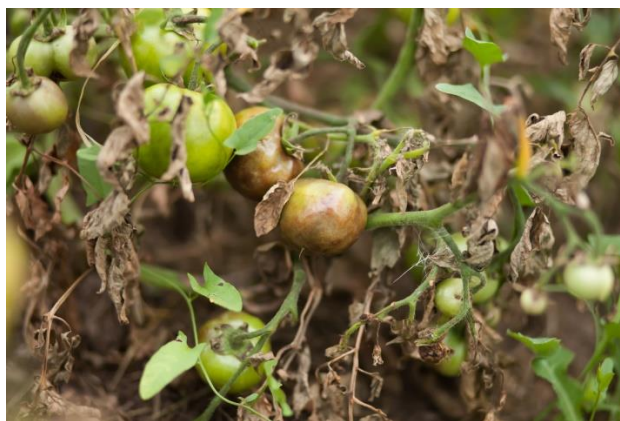
Slika 6. Prikaz plamenjače na nadzemnim dijelovima rajčice.