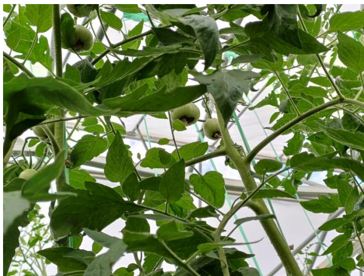
Slika 27. Pojava plamenjače na plodu rajčice.

Tijekom proizvodnog ciklusa i to pred sam početak zriobe plodova pojavila se plamenjača. Sukladno, obavljeno je jedno tretiranje s Polyram-om u dozi od 100 g na 400 kvadrata.