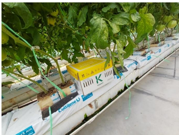
Slika 26. Košnica s bumbarima postavljena u hidropon.

Tijekom proizvodnog ciklusa i to pred sam početak zriobe plodova pojavila se plamenjača. Sukladno, obavljeno je jedno tretiranje s Polyram-om u dozi od 100 g na 400 kvadrata.