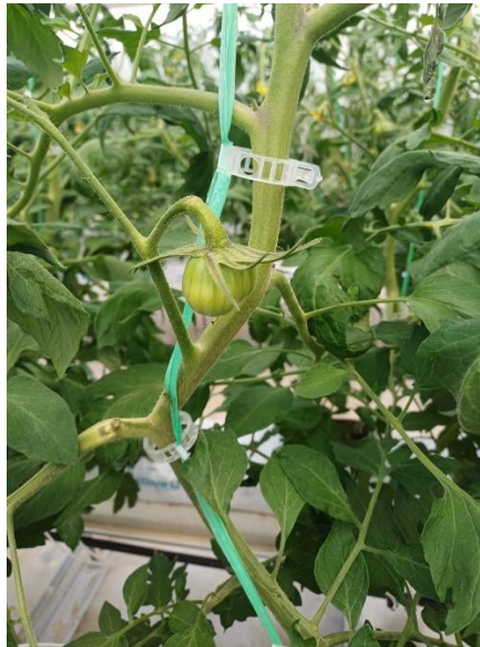
Slika 25. Prikaz pojave sive plijesni rajčice.

bolesti. Slika 25. prikazuje pojavu sive plijesni rajčice na mjestima uklanjanja zaperaka. S obzirom da se bolest pojavila samo na nekoliko biljaka, i to zbog neprofesionalnog uklanjanja zaperaka, zaražene biljke su uklonjene iz zaštićenog prostora kako ne bi došlo do daljnjeg širenja zaraze.