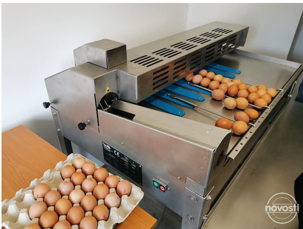
Slika 3. Pakirnica jaja u Lovasu

Agroklaster je 2018. godine pokrenuo proizvodnju jaja iz slobodnog uzgoja u vlastitom objektu u Soljanima i gdje je organizirana proizvodnja te sortirnica i pakirnica u Lovasu (slika 3) što je financirano iz EU projekata. U klaster proizvođača jaja uključeno je 18 kooperanata koji dnevno proizvedu oko 5.500 komada jaja. Agroklaster svojim članovima osigurava redoviti plasman proizvoda svojom mrežom prodaje, kao i stručnu podršku, a potrošačima redovito snabdjevanje. Proizvodnjom jaja je u okviru Agroklastera osigurano 25 radnih mjesta, pretežito teže zapošljivih osoba iz ruralnih područja. Konačni cilj je stvaranje preduvjeta za udruživanje proizvođača jaja u zadruhu ili proizvođačku organizaciju koje će moći samostalno tržišno poslovati.