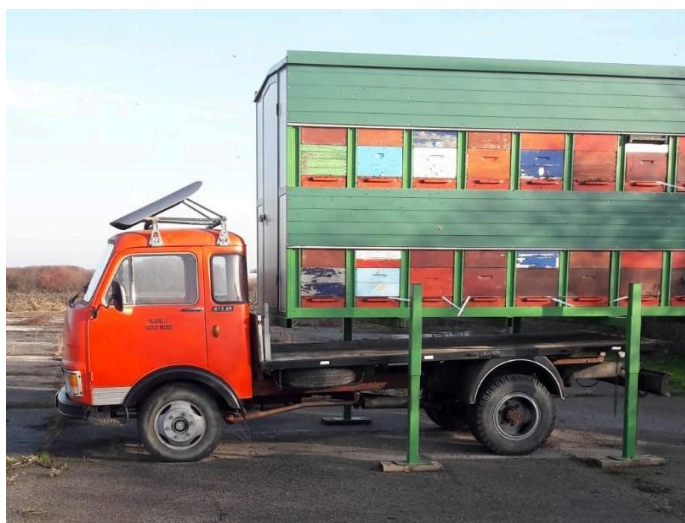
Slika 6. LR košnice u transportnom vozilu

Za svoje medove također je dobio i višebrojne diplome zlatnog i srebrnog obilježja. Osim medova, na ovom Opg-u se može naći i propolis, cvjetni prah, te vosak. Prodaju tih proizvoda zasad vrše sa kućnog praga te isporučuju narudžbe na veće količine.