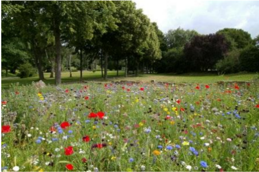
Slika 4. Livadna paša