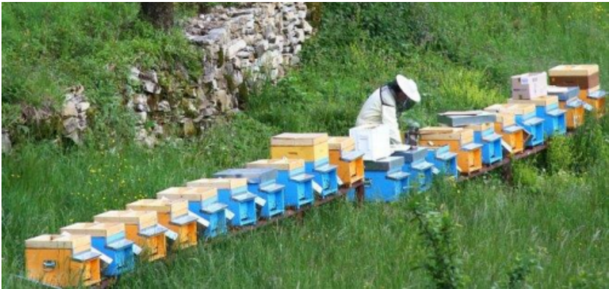
Slika 13. Stacionirani pčelinjak

Stacionirano pčelarstvo je način pčelarenja kod kojeg su košnice smještene na jednom mjestu, bez selidbe na udaljene paše. Kod ovog načina pčelarenja, troškovi su manji jer nije potrebno lagati u transportno vozilo i ostale slične troškove. Ovakvim načinom pčelarenja bave se početnici ili ljudi koji u pčelarstvu vide isključivo hobi, a rijetki su profesionalni uzgajivači koji svoje košnice drže na jednom mjestu. Ovakav način može biti uspješan u slučaju da je pčelinjak postavljen uz pašu koja dobro rodi te u blizini ima još nekoliko medonosnih biljaka.