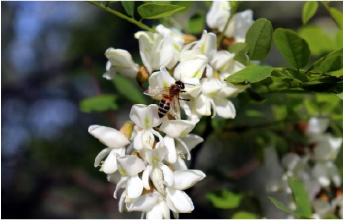
Slika 3. Bagrem u cvatu