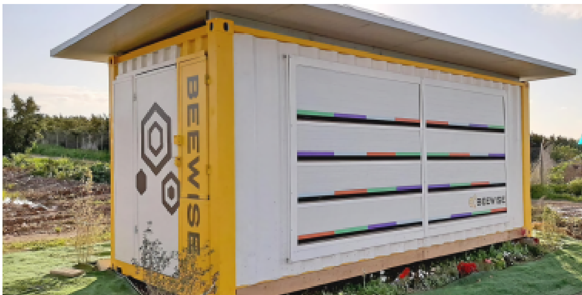
Slika 10. Beewise robotski pčelinjak