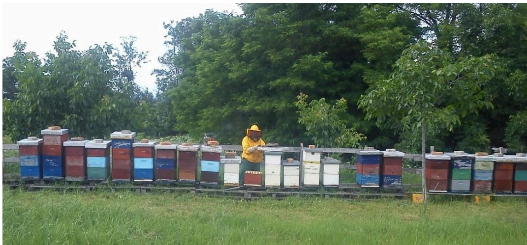
Slika 8. Košnice na livadi