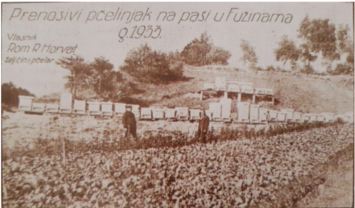
Slika 12. pčelinjak u Fužinama 1933. godine

Počeci ovog tipa pčelarstva spominju se još davne 1933. godine u Fužinama. Svako doba donosi svoje načine pa su ljudi nekada košnice selili željeznicom, što je danas vrlo rijetka praksa. Ova vrsta pčelarenja najpogodnija je pčelarima jer iste košnice mogu premjestiti na drugo područje te na taj način iskoristiti bilje sa više livada.