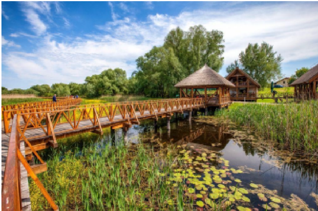
Slika 1. Park prirode Kopački rit