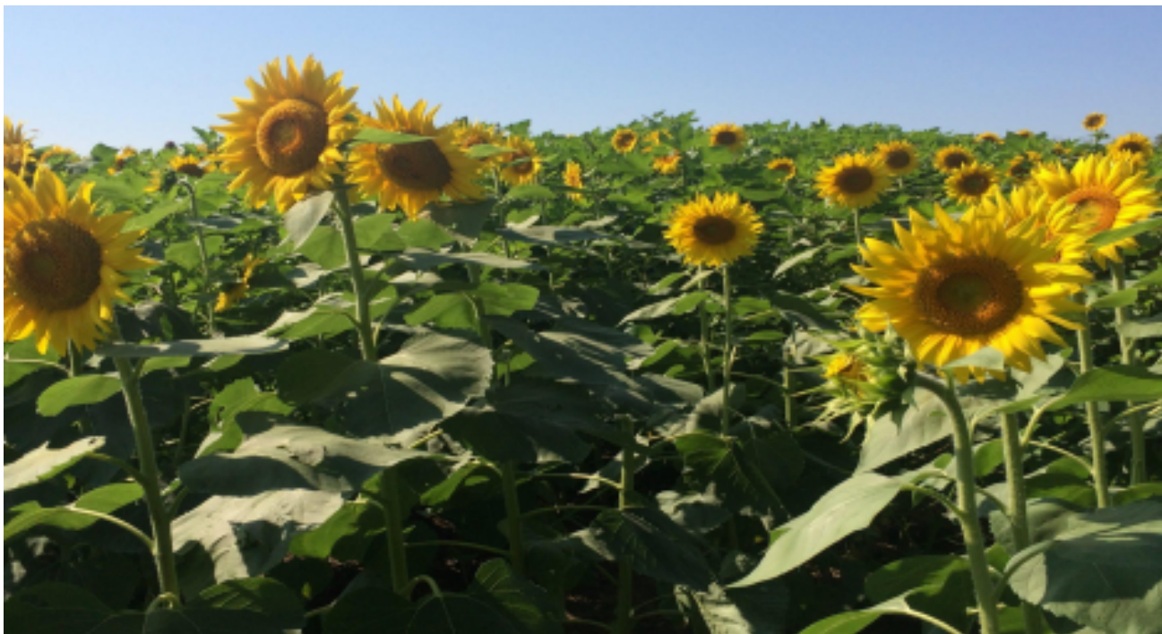
Slika 5. Suncokret