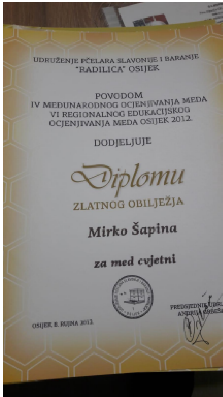
Slika 7. Diploma zlatnog obilježja za cvjetni med