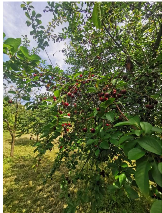
Slika 8. Sorta višnje ciganymeggy -plod