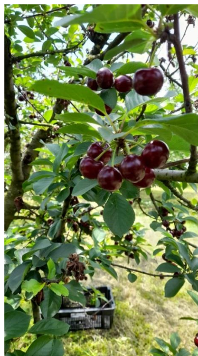
Slika 6. Oblačinska višnja-plod