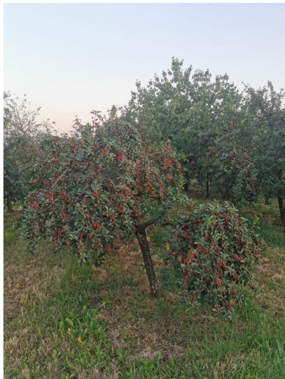
Slika 2. Vegetativni organi višnje