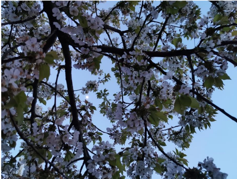
Slika 3. Generativni organi višnje-cvijet