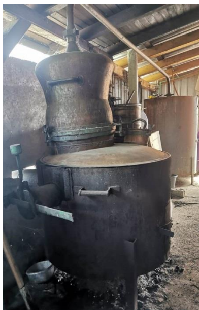
Slika 9. Kotao za proizvodnju destilata