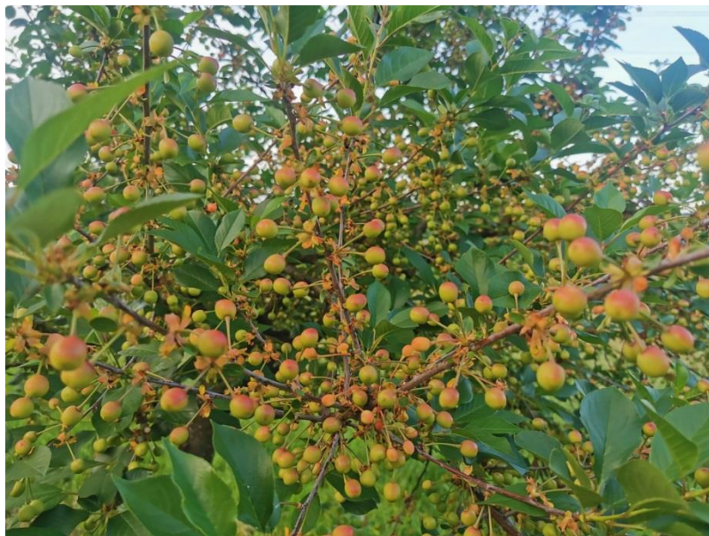
Slika 4. Generativni organi višnje- plod