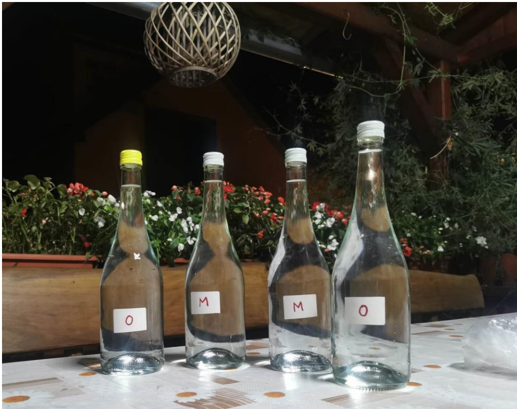
Slika 16. Skladištenje rakije