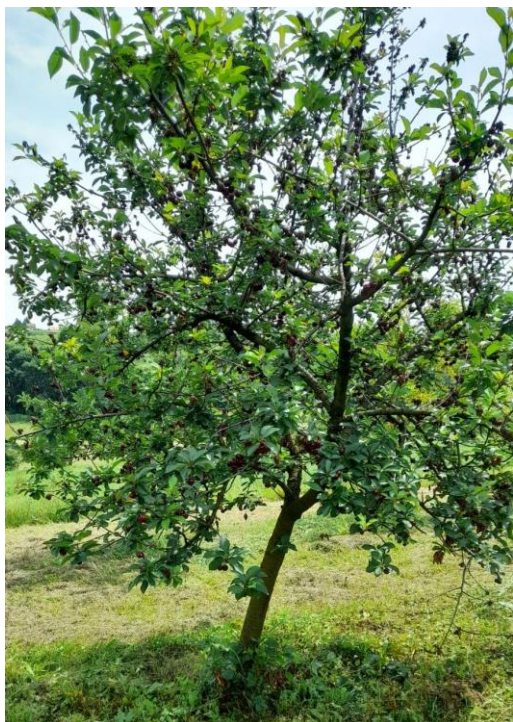
Slika 5. Oblačinska višnja-krošnja

Oblačinska sorta višnje je samooplodna. Tamnocrvena, tanka pokožica te crveno, srednje čvrsto, sočno meso čine plod koji je sitan i teži oko 3 grama. Okruglastog je oblika. (Slika 6.) Plodovi su ujednačene krupnoće i vremena zrenja. Suha tvar tamnocrvenog soka je vrlo bogata te iznosi od 18 do 22 %. (Mratinić, 2002.)