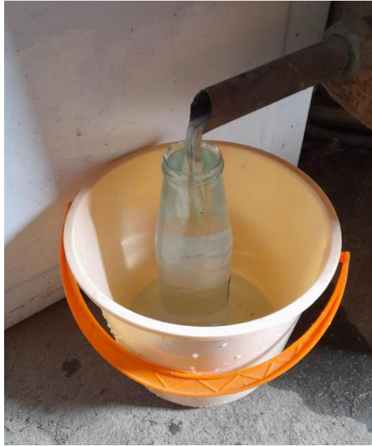
Slika 15. Druga destilacija, srednji tok