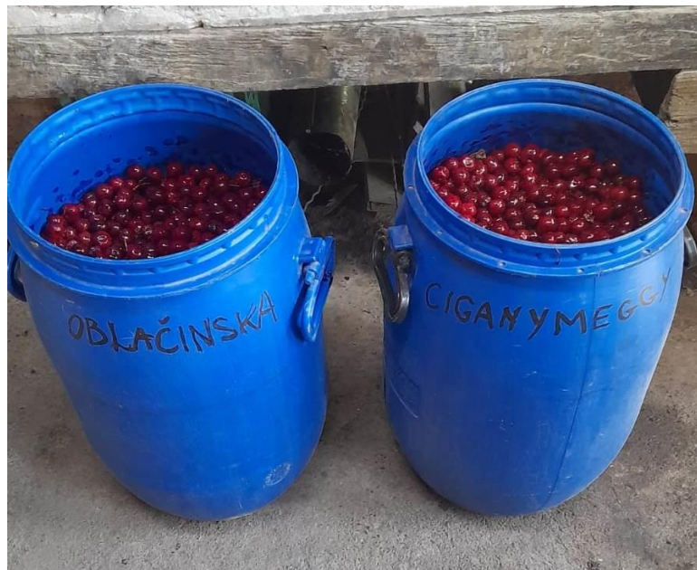
Slika 11. Prikupljeni plodovi obje sorte

Kako bi se plodovi višnje ubrali u pravom trenutku za daljnu preradu, potrebno je kontrolirati suhu tvar pomoću refraktometra. Kod višnje koja će se koristiti za preradu u domaću voćnu rakiju potrebno je čekati punu zrelost ploda. Suha tvar mjerena je na način da se sa svakoga stabla ubralo nekoliko plodova te su izgnječeni u zasebnim posudama. Zatim, pomoću kapaljke uzme se tekućina koja je dobivena gnječenjem te se istisne na stakleno ogledalce refraktometra. Refraktometar se okrene prema suncu te se na skali po Brixu izmjeri suha tvar. (Slika 10.) Za sortu oblačinsku suha tvar je iznosila 19,6, a za sortu ciganymeggy je iznosila 20,1. Usljedila je ručna berba plodova višnje sorte na način da se odmah odvoji plod od peteljke. Plodovi su razdijeljeni prema sorti u zasebne plastične posude. (Slika 11.)