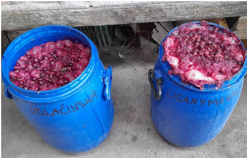
Slika 12. Početak fermentacije

Provode se dvije uzastopne destilacije, kako bi se odvojile u potpunosti štetne i opasne tvari iz destilata. Drugom destilacijom destilat je odvojen u tri toka. U prvom toku izuzet je metanol i ostali štetni spojevi. U srednjem toku prikupljene su najbolje arome koje formiraju rakiju. (Slika 15.) Uslijedilo je mjerenje alkoholne jakosti te kada je destilat pao na 55 % vol., započinje odvajanje trećeg toka (patoke). Cijeli postupak provodi se zasebno za obje sorte.