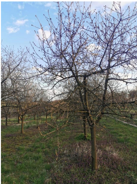
Slika 1. Vegetativni organi višnje

Drvni, lisni, adventivni i latetni pripadaju vegetativnim pupoljcima. Iz drvnih pupova razvija se mladica, koja nosi list. Iz lisnih pupova nastaje list. Na osnovi izbojka javlja se latetni pup koji kora s vremenom prekrije. Adventivni pupovi javljaju se na mjestima obilnog priticanja hranjiva.