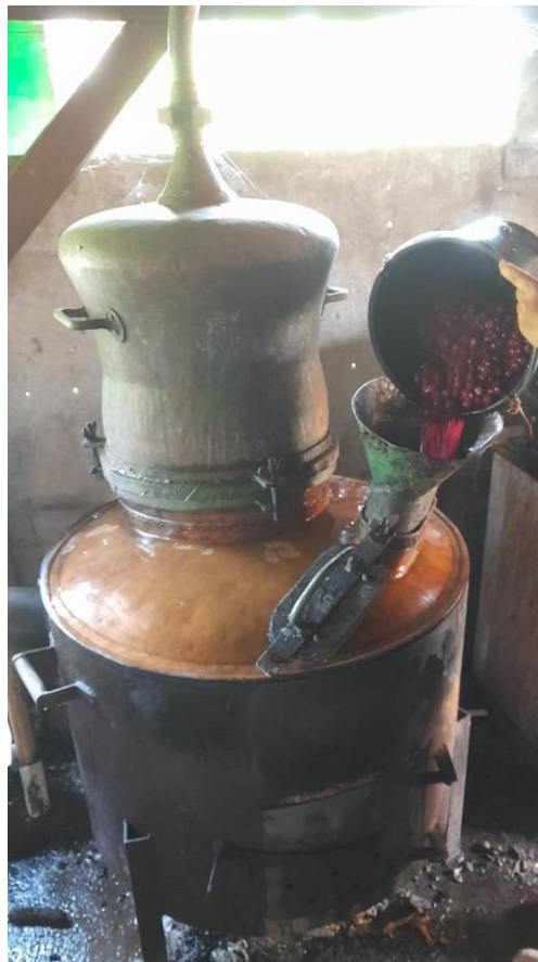
Slika 14. Dodavanje fermentirane smjese u kazan