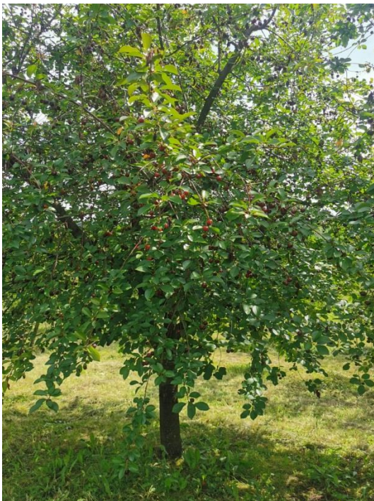
Slika 7. Sorta višnje ciganymeggy -stablo

Ciganymeggy je samooplodna sorta, plod je malen te obično teži oko 3 do 4 grama (Slika 8). Plod je slatko kiselkast s visokim sadržajem kiseline i suhe tvari (www. meggyinfo.hu, 2023. ).