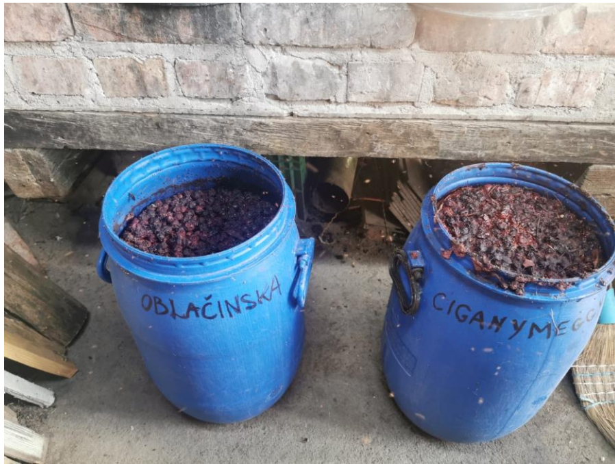
Slika 13. Kraj fermentacije