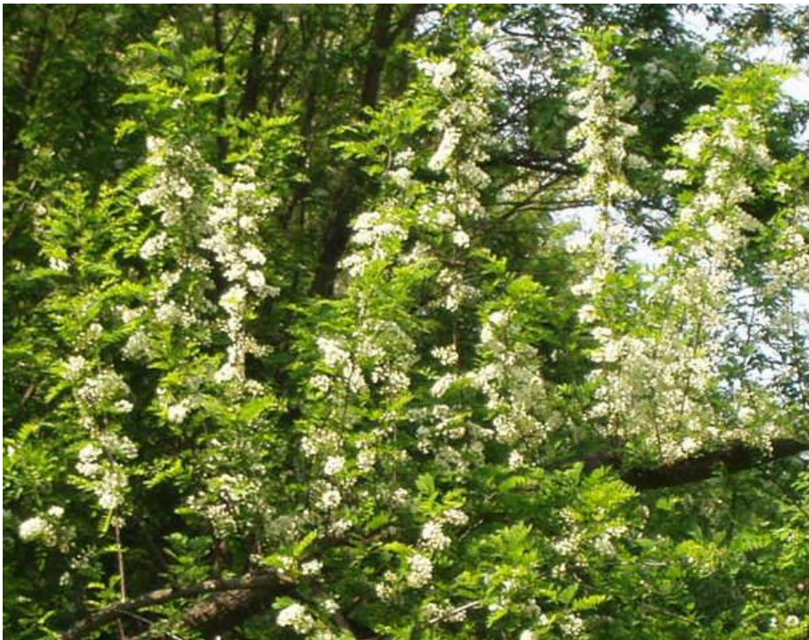
Slika 6. Paša za pčele: bagrem u proljeće

Posebna priča o tome medu počinje 2010. kada na Svjetskom natjecanju u Semiču u Sloveniji Ivan Kožić iz Udruge Nektar u Konjščini postaje njime šampion odnosno apsolutni pobjednik. Također u Sloveniji u listopadu 2011. Vinko Ferenčić također iz Udruge Nektar iz Konjščine na 13. međunarodnom ocjenjivanju meda ponovno je imao najbolje ocijenjen bagremov med.