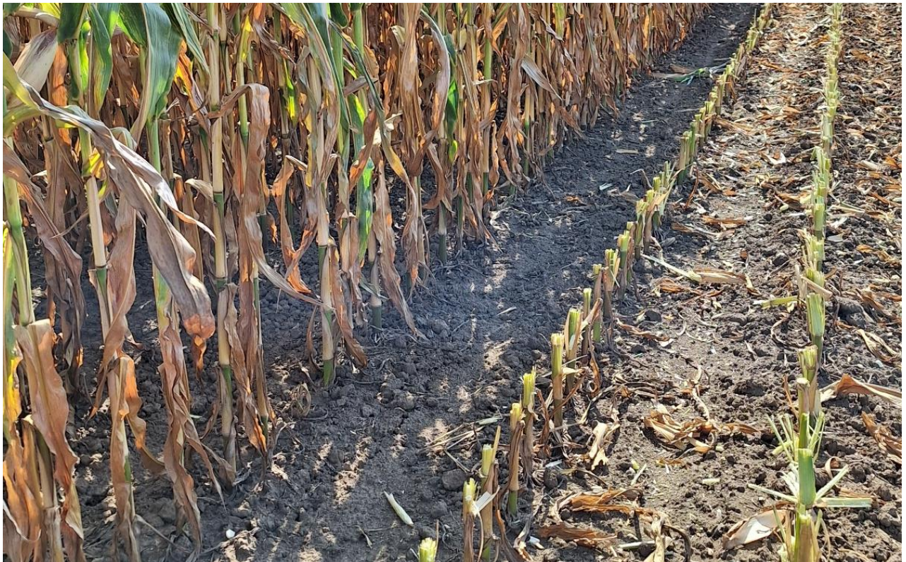
Slika 4. Visina košnje u standardnoj sjetvi istraživanog hibrida

Na Slici 4 prikazana je visina košnje u standardnoj sjetvi, a na Slici 5 visina košnje kod sjetve u udvojene redove.