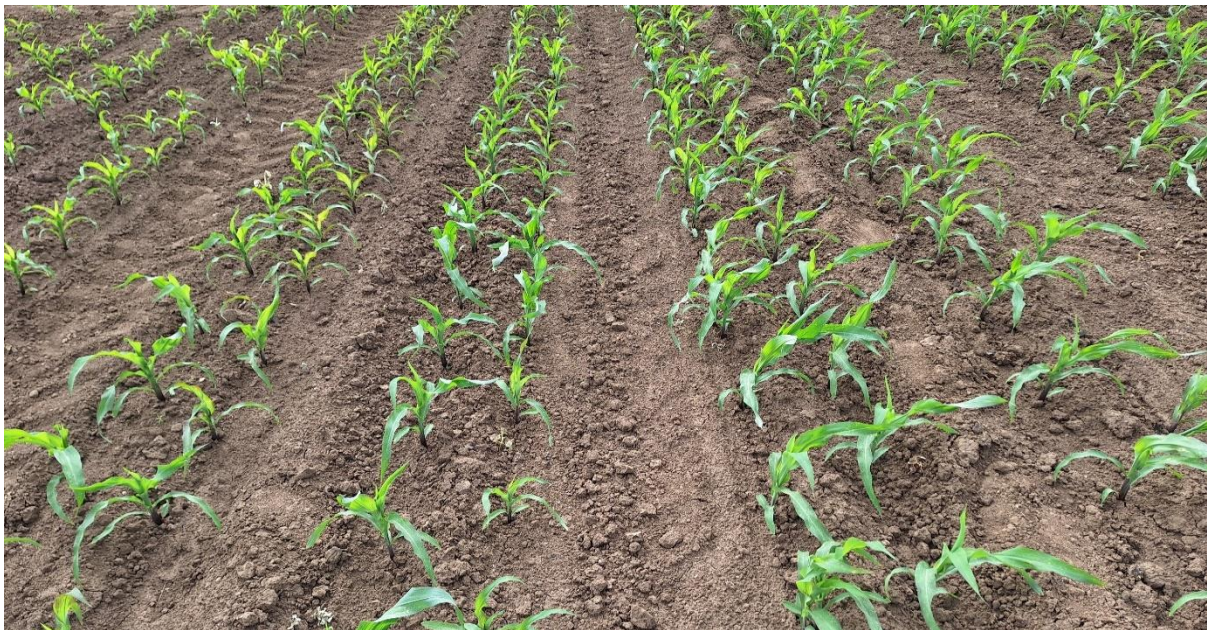
Slika 2. Sjetveni pokus silažnog kukuruza Mikado kod sjetve u udvojene redove

Na Slici 2 prikazan je sklop kukuruza kod sjetve u udvojene redove, a na Slici 3 sklop kukuruza kod standardne sjetve.