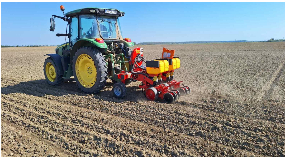
Slika 1. Sijačica tvrtke MaterMacc S.p.a. – Twin Row–2

Sjetveni pokus hibrida u tehnologiji standardnog oblika (razmak redova 70 cm) na Tabli K-24 obavljena je 27. 04. 2023. godine osmorednom sijačicom ED tvrtke Amazone. Tijekom rada sjetva je obavljena na dubinu između 3,5 i 4,5 cm ovisno o zbijenosti tla. Radna brzina tehničkog sustava u vrijeme sjetve bila je u granicama od 8 do 10 km h -1 . Sjetva u tehnologiji udvojenih redova radi nestabilnog vremena i prevelike vlažnosti tla obavljena je 05.05.2023. godine sijačicom MaterMacc Twin Row-2 na radnu dubinu oko 4 cm (Slika 1). Za standardnu sjetvu sijačica je podešena na teorijski sklop oko 75 000 biljaka ha -1 .