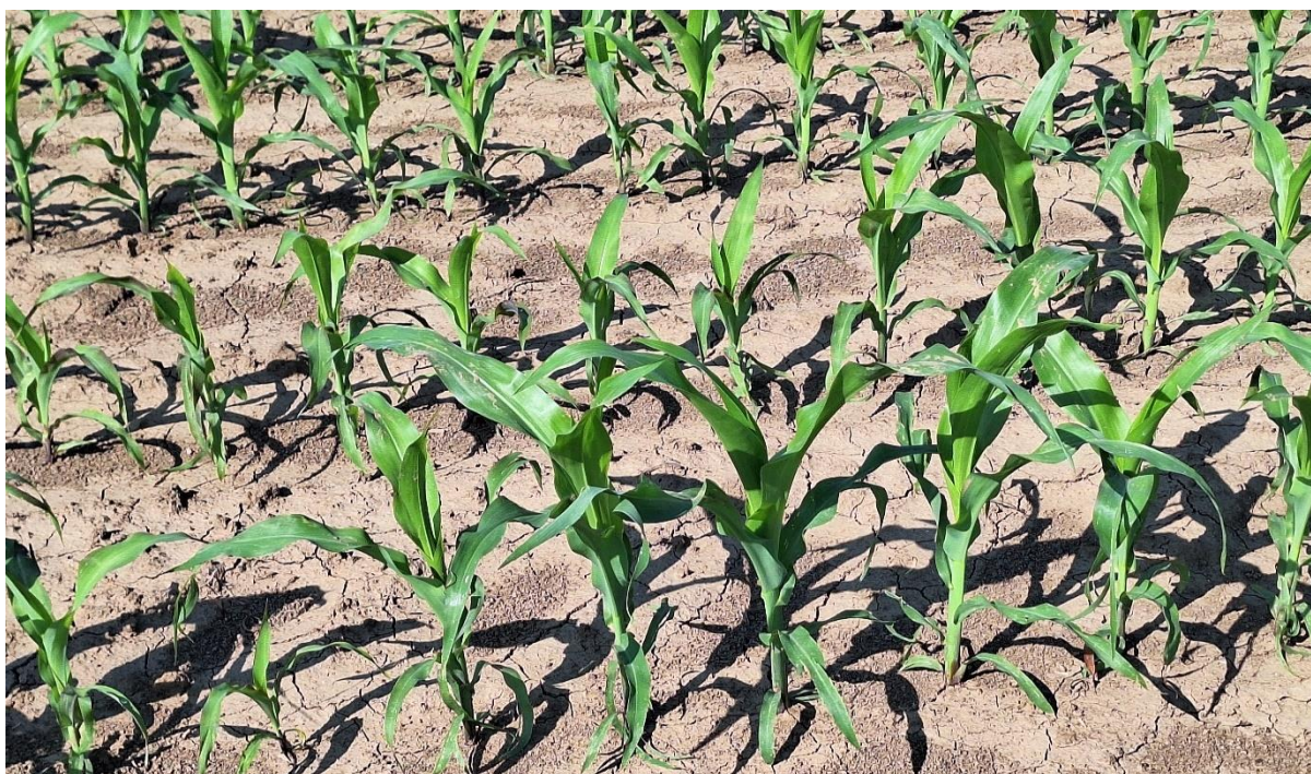
Slika 3. Sjetveni pokus silažnog kukuruza Mikado kod sjetve u standardne redove