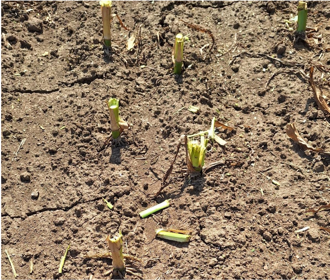
Slika 5. Visina košnje kod sjetve u udvojene redove