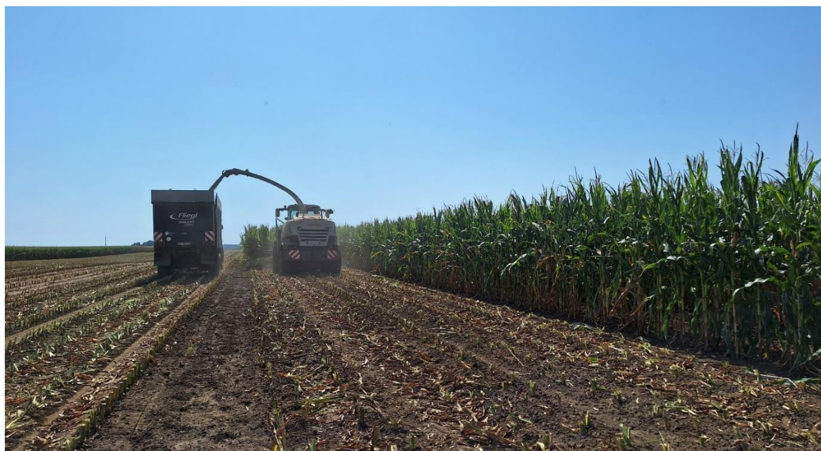
Slika 6. Siliranje hibrida Mikado u standardnoj sjetvi