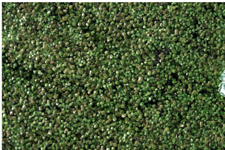
Slika 3: Vodena l

Vodena leća ( Lemna spp. ) bogata je proteinima, s udjelom suhe tvari koji može varirati od 25 % do 45 % proteina, što je usporedivo s drugim biljnim (sojina sačma) i životinjskim krmivima (riblje brašno) koje u krmnim smjesama za perad koristimo kao izvor proteina. Vodena leća sadrži esencijalne aminokiseline, poput lizina, međutim sadrži malo metionina koji je često nedostatan i u biljnim proteinima. Ovaj nedostatak metionina može se nadoknaditi dodatkom umjetnih aminokiselina u krmne smjese za perad.