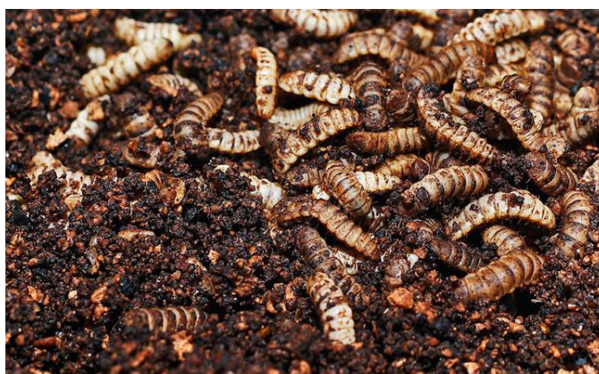
Slika 1: Ličinke crne vojničke muhe ( Hermetia illucens )

Kukci su izuzetno dobri bio-konverteri koji mogu transformirati biomasu niske kvalitete u nutritivno vrijedne bjelančevine. Crna vojnička muha ( Hermetia illucens ) je muha ( Diptera ) iz porodice Stratiomyidae . Prvotno stanište bila su joj područja tropskih i suptropskih klima, ali se brzo raširila diljem svijeta (Müller i sur., 2017.). Ličinke crne vojničke muhe ( Hermetia illucens ) bogate su visokokvalitetnim proteinima, esencijalnim aminokiselinama i masnim kiselinama koje su ključne za zdrav rast i razvoj peradi (Slika 1.).