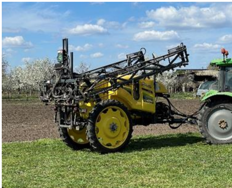
Slika 5. Prskalica Caffini (Novković, 2023.)

Prije prskanja, potrebno je identificirati problem koji zahtijeva intervenciju. To može biti prisutnost štetnika, bolesti ili korova koji mogu ugroziti rast i razvoj usjeva. Temeljita analiza problema omogućuje odabir odgovarajuće kemijske tvari i primjenu specifičnih mjera zaštite. Primjena kemijskih sredstava za zaštitu šećerne repe od štetnika i bolesti važan je dio proizvodnje (Drezner i Šimon, 2014.).