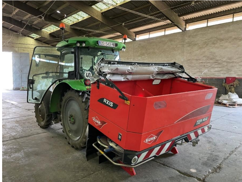
Slika 2. Slika prikazuje rasipač KUHN 40.2 EMC (Novković, 2023.)