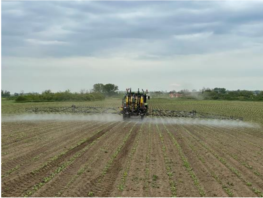
Slika 6. Prskalica Caffini u radu (Novković, 2023.)