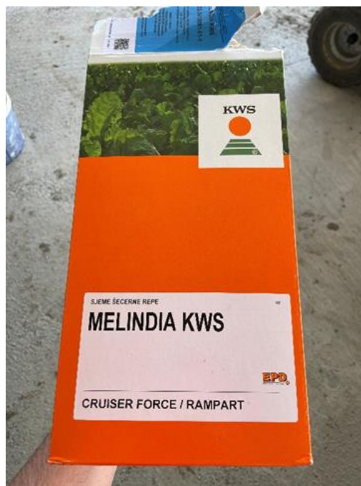
Slika 4. Hibrid šećerne repe KWS Melindia (Novković, 2023.)