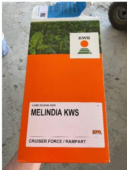
Slika 4. Hibrid šećerne repe KWS Melindia (Novković, 2023.)