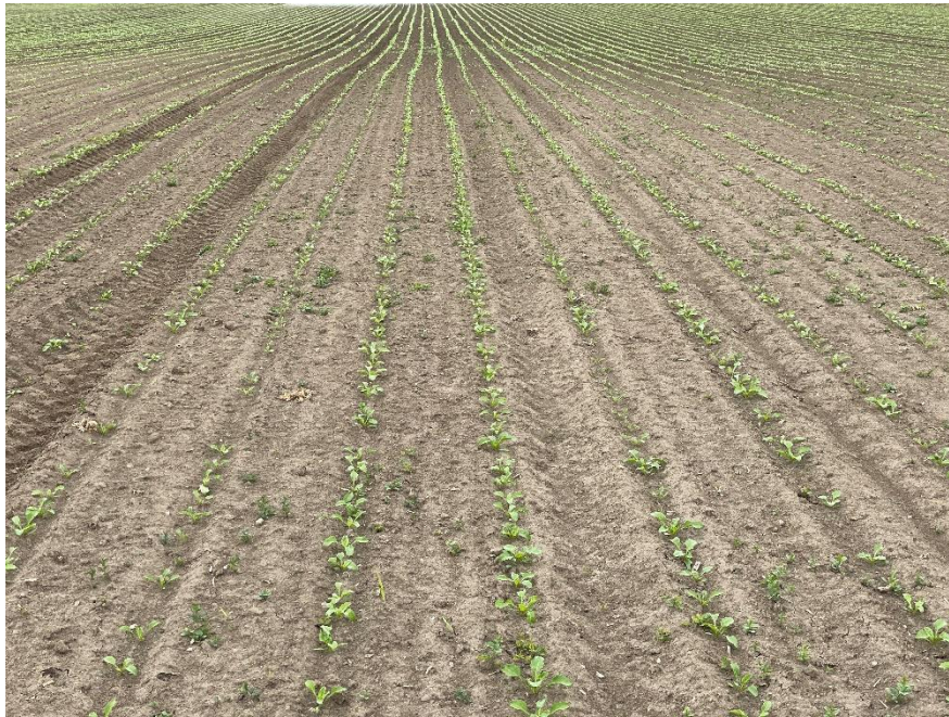
Slika 1. Tlo na kojem je posijana šećerna repa (Novković, 2023.)

hranjivim tvarima, posebno dušikom, fosforom i kalijem. Ukoliko tlo nedostaje određenih hranjivih tvari, mogu se primijeniti gnojiva kako bi se osigurao optimalan rast usjeva.