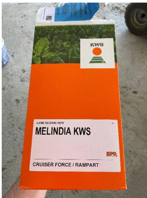
Slika 4. Hibrid šećerne repe KWS Melindia (Novković, 2023.)