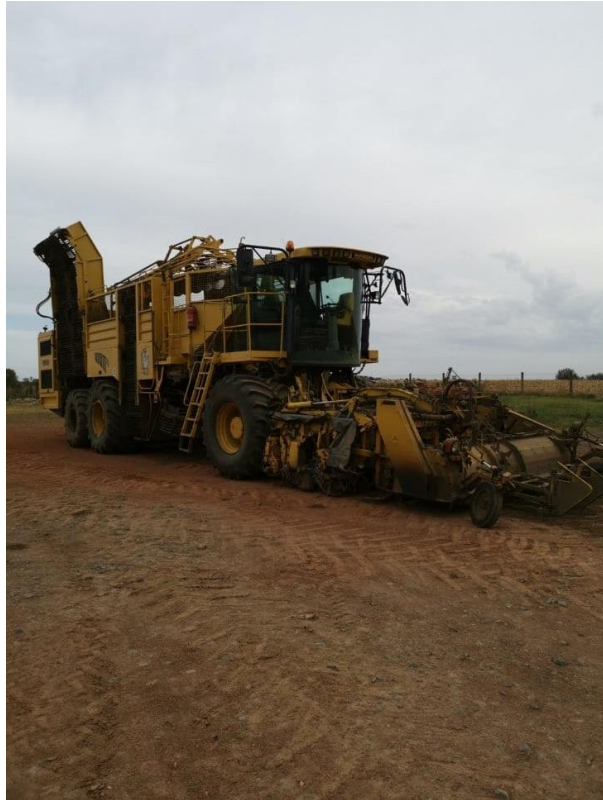
Slika 7. Vadilica repe ROPA TIGER (Novković, 2022.)