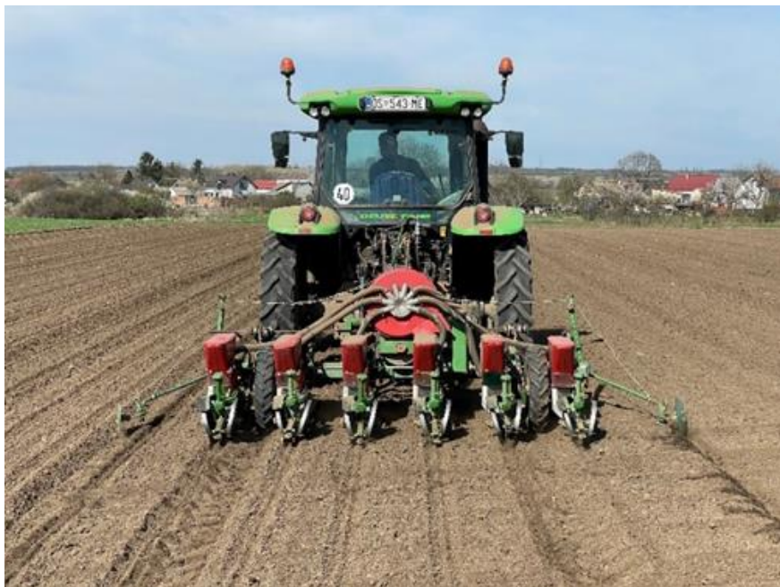
Slika 3. Šestoredna sijačica OLT (Novković, 2023.)

odgovarajućem vremenskom razdoblju kako bi se osigurala optimalna klijavost sjemena i rast mladih biljaka (Fruk i sur., 2017.). Sjetva se obavlja sijačicom marke „OLT“ 6x50 centimetara (Slika 3.).