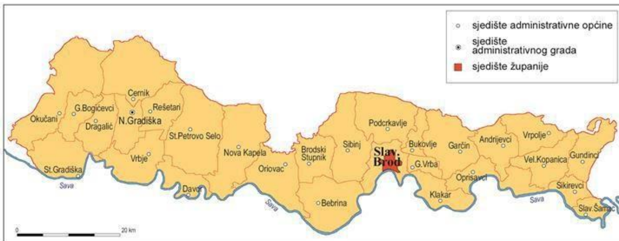
Slika 2. Gradovi i općine Brodsko-posavske županije