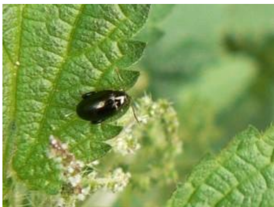
Slika 8. Repičin buhač

Repin buhač, jedan od ključnih štetnika šećerne repe, je sitan kukac ovalnog tijela, veličine 1,5 do 2 mm, s debelim stražnjim nogama i snažnim bedrima, koje mu omogućuju skakanje. Tijelo mu je tamno s metalnim sjajem (slika 8). Odrasli kukci prezimljuju u tlu, a njihova pojava iz tla podudara se s vremenom nicanja šećerne repe, kada temperatura zraka dosegne 12 °C. Odrasli kukci nanose štetu izgrizajući lišće i ostavljajući male rupice promjera 1 mm koje se šire kako list raste (slika 9). Najveće štete na šećernoj repi nastaju kada buhač napadne tek iznikle biljke, grizući ne samo listove, već i stabljiku. Neophodno je da repa što prije prođe fazu sjemenskog lista što u velikoj mjeri ovisi o agrotehnici, ali i vremenskim uvjetima. Suzbijanje se vrši različitim mjerama od kojih su najznačajnije agrotehničke mjere što podrazumijeva raniju sjetvu i pravilnu gnojidbu, da bi biljka što brže prošla osjetljivu fazu ( https://rezistentnost-szb.hr/stetnici/agronomija/repin-buhac ).