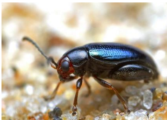
Slika 14. Imago repičinog crvenoglavog buhača

Imago repičinog crvenoglavog buhača je crno-plave ili zelenkasto-plave sjajne boje, dugačak 3,2 - 4,5 mm (slika 14). Jaja su svjetlo narančaste boje. Ličinka je bijela sa smeđom glavom, naraste 7 - 8 mm (Alasić, 2008.). Imago napada u ranim fazama uljane repice. Prema nekim autorima, ženka može odložiti i do 1000 jaja. Prve se ličinke nalaze u biljkama od kraja rujna i prave velike štete u peteljke listova (Štivić, 2018.). Šupljine koje nastaju kao posljedica ishrane ličinki, većinom se napune vodom, pa za vrijeme jačeg mraza dolazi do loma biljke. U takvim oštećenim biljkama dolazi do gubitka vigora, a veći broj ličinki većinom uzrokuje sušenje cijele biljke uljane repice (Maceljski, 2002). Tijekom razvoja vegetacije neke ličinke dolaze i do viših dijelova biljaka kao što je cvat. Ličinke čitav život provode unutar repice gdje i prezime. U proljeće se spuštaju u tlo i kukulje. Krajem veljače prve kukuljice se nalaze u tlu (Alasić, 2008.). Buhač može letjeti 4 km, ali su najjače su napadnuti usjevi u blizini prošlogodišnjeg usjeva. Preporuča se praćenje vremenskih prilika za agronome na terenu. Prema podacima Ministarstva poljoprivrede Republike Hrvatske (FIS, 2024), popis najčešćih registriranih sredstava za suzbijanje ovog štetnika u 2024. godini su Decis 2,5 EC, Sumialfa 5 FL, Cythrin Max, "Cyclone", Columbo 0,8 MG, Cypgold.