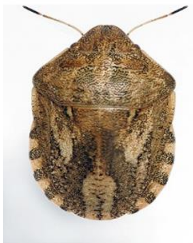
Slika 7. Žitna stjenica