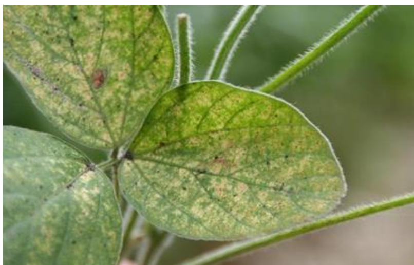
Slika 20. Simptomi napada običnog (koprivinog) crvenog pauka

Obični crveni pauk ili koprivina grinja je polifagni štetnik. Štete prave na listu na kojem su vidljive točkice bijelo-srebrne do žute boje, a uslijed jakog napada list postaje mramoriran (slika 20). Na napadnutim listovima javlja se paučinasta prevlaka, a kod jačeg napada može doći do povezivanja više listova (Maceljski, 2002.). Tijekom godine razvije do 10 generacija. Prezimljuje u stadiju jaja, ali ukoliko se ne prati pojava ovog štetnika u pogodnim uvjetima za njihov razvoj može doći do značajnog smanjenja prinosa soje. Trajanje razvojnog ciklusa od jaja do odraslog oblika traje 8 - 12 dana (Maceljski i sur., 2004.). Zbog prekomjerne upotrebe sredstava za zaštitu bilja, došlo je do rezistentnosti na djelatne tvari kod običnog crvenog pauka, stoga su biološke mjere prihvatljivije jer ne zagađuju okoliš i ne stvaraju rezistentnost. Najčešće se koriste prirodni neprijatelji od kojih su poznatije grabežljive grinje Phytoseiulus persimilis , Amblyseius andersoni , Amblyseius cucumeris , Neoseiulus californicus , mušica Feltiella acarisuga , te grabežljiva stjenica Macrolophus pygmaeus (Čajkulić, 2019.). Akaricidi koji su dozvoljeni za suzbijanje ovih grinja su: Flipper, Kumulus DF, Chromosul 80 (FIS, 2024.).