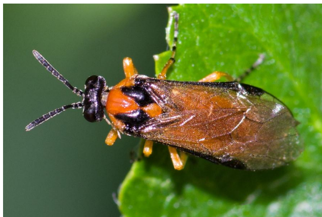
Slika 15. Repičina osa listarica

Osa listarica je važan jesenski štetnik uljane repice. Svake se godine prosječno suzbija na 70 % posijane površine (Maceljski i Igrc, 1991.). Imago je dug oko 8 mm, žuto - narančaste boje (slika 15), dok je ličinka crnosive boje, ima 11 pari nogu i naraste do 20 mm duljine. Ove ličinke vrlo su slične gusjenicama pa su još nazvane i pagusjenice (Maceljski i Igrc, 1991.). Osa listarica ima dvije generacije godišnje, prva generacija se javlja u proljeće i nije toliko značajna dok druga generacija izlazi ljeti i pravi najveće štete, ali često je izlijeganje produženo stoga se vrhunac doseže negdje sredinom rujna kada rade najznačajnije štete (Šimić, 2012.). Prema Maceljskom i Igrc smatra se da dvije pagusjenice na jednoj biljci mogu smanjiti prinos za oko 60 % jer 75 % ukupne količine hrane pagusjenice pojedju u zadnja tri dana svog razvoja. Kada je utvrđena prisutnost jedne ili više osa po m 2 , priprema se za suzbijanje (Maceljski i Igrc, 1991.). Vrlo efikasni insekticidi koji suzbijaju većinu štetnika koji napadaju u vrijeme ose listarice su većinom iz skupine piretroida. Prema popisu registriranih sredstava za zaštitu bilja 2024. za tretiranje ovog štetnika dozvoljeni su sljedeći insekticidi: Mospilan 20 SG, Sumialfa 5 FL i Decis 2,5 EC.