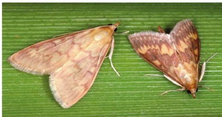
Slika 1. Imago kukuruznoga moljca

Suzbijanje kukuruznog moljca otežava njegova polifagnošć (Maceljki i Igrc, 1991.). Igrc-Barčić (2007) navodi dvije grupe mjera: preventivne mjere (agrotehničke i mehaničke metode, uzgoj otpornih hibrida) i kurativne mjere (biološke, biotehničke i kemijske metode). Agrotehničke metode sastoje se u pravilnom izboru plodoreda, smanjenju šteta ranijom sjetvom te uništavanju drugih biljnih domaćina (Maceljki, 2002). Mehaničke metode su važne zbog uništavanja kukuruzinca u kojem prezimljuju gusjenice. Biološke metode se odnose na primjenu prirodnih neprijatelja ili bioinsekticida, dok se biotehničke odnose na korištenje regulator razvoja, a kemijske se primjenjuju u vegetaciji (Bažok, 2015., Maceljki, 2002.). Preporuča se primjena ekološki povoljnih bioinsekticida poput Biobita XL. Također se mogu koristiti kemijski insekticid Decis 2,25 EC, Mimic, Rotor super, Decis 100 EC (FIS, 2024.).