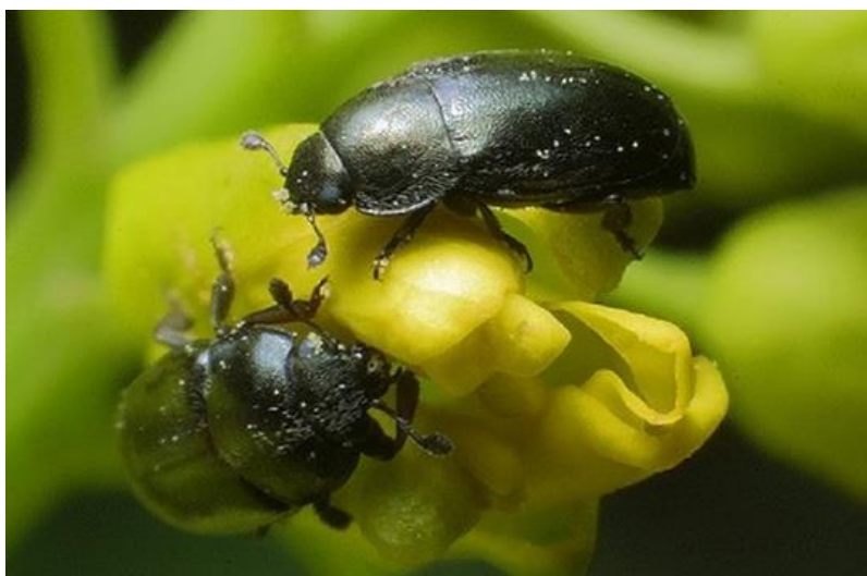
Slika 13. Repičin sjajnik

Repičin sjajnik je najznačajniji štetnik koji se javlja svake godine, a može smanjiti prinos više od 50 % (Gotlin Čuljak i sur., 2016.). To je kornjaš crne, tamnozeleno ili tamnoplave boje, tijela dugog oko 2 mm (slika 13). Prezimljuje u tlu, a izlazi pri temperaturama od 8 °C. Štete čini hraneći se pupovima koje buši i izgriza čim se pojave, stoga se pupovi najčešće osuše ( https://www.chromos-agro.hr/repicin-sjajnik-meligethes-aeneus/ ). Ženka odlaže jaja u pupove veličine 2 - 3 mm, iz njih se izlegu ličinke koje se hrane u pupu i cvijetu pa se zatim kukulje. Sjajnik se javlja u svibnju i lipnju, ali je u cvatnji zabranjena primjena insekticida, stoga je optimalni rok primjene 10-ak dana prije početka cvatnje. Važno je istaknuti da se godišnje pojavljuje samo u jednoj generaciji. Razina štetnosti ovisi o fenofazi uljane repice u trenutku njegove pojave, gustoći štetnika, razdoblju između njegove pojave i cvatnje, te sposobnosti biljke da se oporavi. Prag za odluku kod cvjetnih pupova koji su još zaštićeni lišćem je 0,8 - 1 sjajnik po terminalnom cvatu, dok je za vidljive cvjetne pupove prag odluke 1 - 1,5 sjajnika po terminalnom cvatu. Prije pojave prvih cvjetova, najveći prag je 2 - 3 sjajnika po terminalnom cvatu (Maceljki i sur.,1997.). Najčešći insekticidi za suzbijanje repičinog sjajnika su: Decis 2,5 EC, Sumialfa 5 FL, Mospilan 20 SG, Poleci, Cythrin Max (FIS, 2024.).