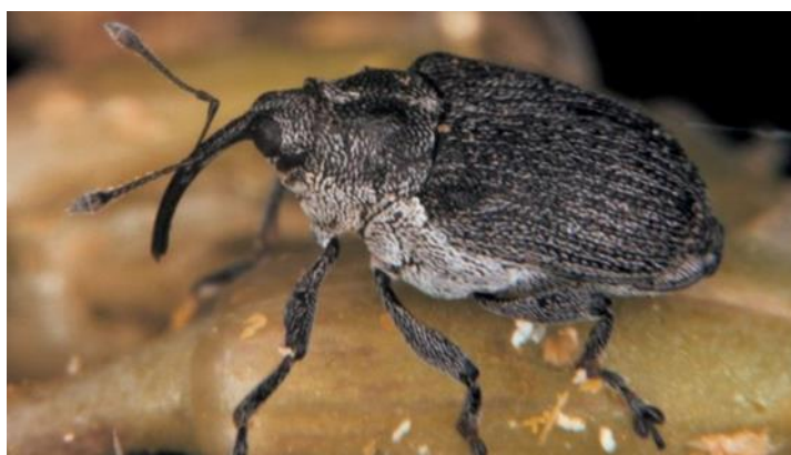
Slika 16. Repičina pipa komušarica

Tijelo repičine pipe komušarice dugo je 2,3 - 3 mm i sjajno crne je boje (slika 16). Ličinke su bijele boje, bez nogu i narastu do 6 mm. Štete prave odrasle pipe ishranom na pupovima i komuškama te odlaganjem jaja, dok najveću štetu čini ličinka koja smanjuje prinos i do 50 %. Štete koje su učinjene se određuju otvaranjem 200 komuški po polju, te se uzima u obzir broj zaraženih komuški i broj uništenih sjemenki (Alasić, 2008.). Suzbijanje je potrebno ako se utvrdi više od 0,5 - 1 pipa po biljci (Maceljki, 2002.). Prema popisu registriranih sredstava za zaštitu bilja Ministarstva poljoprivrede Republike Hrvastke dozvoljeni insekticidi su: Sumialfa 5 FL i Cyclone.