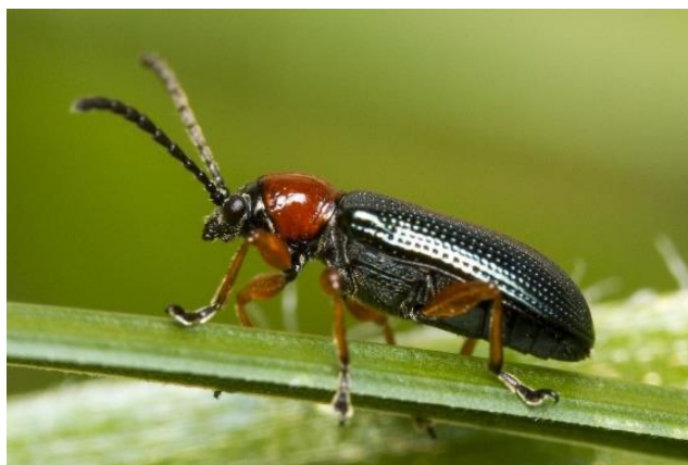
Slika 5. Žitni balac

Imago žitnog balca ima plava pokrilja, crvene noge, usko tijelo dugo 4 – 6 mm (slika 5). Odrasli izgrizaju lišće između žila, pa ostaju grizotine na listu. Ličinke se javljaju na biljkama između svibnja i srpnja i obično ostaju na istoj biljci tijekom cijelog svog razvoja, jer se uglavnom ne kreću. Nova generacija odraslih kornjaša početkom kolovoza nastavlja se hraniti na strnim žitaricama i travnjacima (Kher i sur., 2013.). Smanjenje prinosa također ovisi o tome gdje na biljci ličinka nanosi štetu. Ako su oštećenja nastala na zastavici biljke, prinos će znatno pasti zbog smanjenja broja sjemena (Dimitrijević i sur., 2001.).