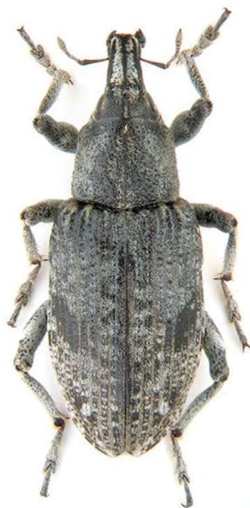
Slika 10. Repina pipa (Izvor: https://agronomija.rs )

Poželjno je koristiti insekticide koje imaju jako želučano djelovanje kao što su Cythrin Max, Sherpa 100 EW, Decis 2,5 EC, Kofumin 308 EC, Poleci itd. (Glasilo Zaštite bilja, 2024.).