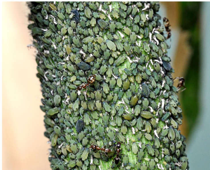
Slika 4. Kukuruzna lisna uš

Kukuruzna lisna uš je vrlo česta vrsta štetnika kukuruza. Veličine je 0,9 - 2,4 mm, tamno zelene boje (slika 4). Anholociklička je i heterecijska vrsta. Prezimi odrasla ženka ili ličinka na samoniklim klasastim travama. Razmnožavanje se odvija obično u vrijeme izbacivanja metlice. Kukuruzna lisna uš napada list, stabljiku i cvat, dok su posljedice napadnute biljke zaostatak u rastu, zakržljaloš, a na lišću je velika količina medne rose na koju se naseljavaju gljive čađavice, pa lišće često izgleda ljepljivo i crno. Napad može biti problematičan ako se dogodi u proljeće kada je kukuruz visine do 40 cm. Kada kukuruz ojača, mjesto gdje će se smjestiti kolonija lisnih uši može biti negdje u blizini metlice pri vrhu biljke. Često dolazi zajedno s vrstama Rhopalosiphum padi i Rh. insertum . Kukuruzne lisne uši imaju prirodne neprijatelje od kojih su najznačajniji porodica Coccinellidae (buba mare). Pregled i ocjena intenziteta napada vrše se po Banksu (Maceljki i Igrc, 1991.). Prema FIS – u (2024.) dozvoljeni insekticid za suzbijanje kukuruzne lisne uši je Decis 2,5 EC.