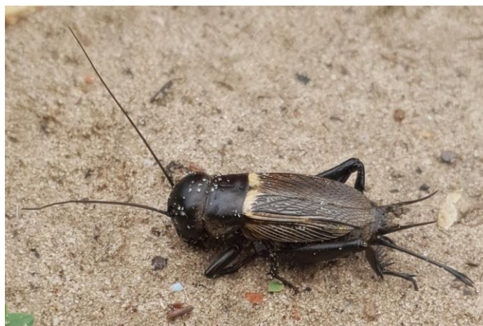
Slika 17. Poljski šturak

Poljski šturak je polifagi štetnik, crne boje, dužine 20 - 30 mm (slika 17) koji ima razvijene noge za skakanje. Prezimi u obliku imaga ili ličinke (Maceljski i Igrc, 1991.). Ima jednu generaciju godišnje. Nakon polaganja jaja, ženka ugiba. Ličinka prolazi kroz 9 do 13 stadija mijenjajući boju tijela u tamnije. Poljski šturak je aktivan tijekom noći i preferira vlažne terene (Ivezić, 2008.). Najveću štetu čine izgrizanjem na listu suncokreta. Iako su štetnici, imaju i korisnu ulogu jer se hrane jajima i ličinkama drugih kukaca (Kalac, 2015.). Najveći prirodni neprijatelji šturaka su ptice i ježevi, a mogu se koristiti i prirodni pripravci na bazi od koprive ili duhana ( https://www.agroklub.com/povrcarstvo/gdje-se-skrivaju-sturci-i-koje-stete-cine-bilju/23288/ ).