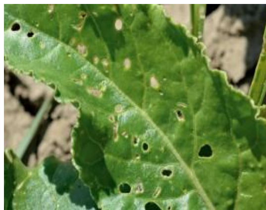
Slika 9. Štete od repičinog buhača