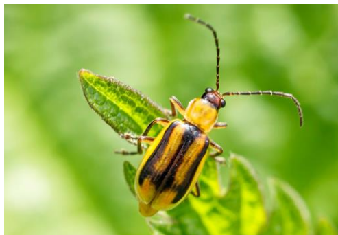
Slika 3. Imago kukuruzne zlatice

Kukuruzna zlatica najvažniju štetu uzrokuje tijekom stadija ličinke ishranom na korijenu. Tijelo imaga varira od žute do zelene boje, ticala su nitasta. Gornja krila su žuta s uzdužnim tamnim crnim prugama (slika 3). Ličinke kukuruzne zlatice uzrokuju najveću štetu jer se ubušuju u korijen biljke i kasnije ga pregrizu blizu glavne stabljike. Zbog ovakve ishrane, korijen postaje oštećen, što dovodi do smanjenog prinosa. Međutim, najveći problem je što biljke s oštećenim korijenom postaju nestabilne i sklone polijeganju (Maceljki, 2002, https://www.agroklub.com ).