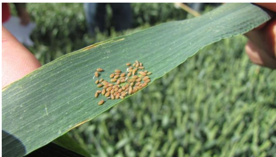
Slika 6. Lisne uši