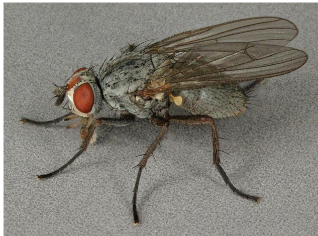
Slika 12. Repina muha

Repina muha sličnog je izgleda domaće muhe (slika 12). Tijelo je dugo 6 – 8 mm i sive je boje. Ženka repine muhe odlaže jaja na lišću koja su karakterističnog oblika: bijela, uska i poredana u skupine. Ličinka muhe je najštetnija jer minira list praveći hodnike, zatim podiže epidermu ispod koje nema parenhima, pa je list nešto svjetlije boje. Štete su lako prepoznatljive i uočljive. Ima dvije do tri generacije godišnje. Prezimljuje u tlu u obliku kukuljice, te u proljeće izlazi imago. Ženka odloži 50 - 100 jaja čiji razvoj traje 4 - 10 dana (Maceljski i Igrc, 1991.). Suzbijanje repine muhe je potrebno provoditi od ranog razvoja do približno 6-lisnog do 8-lisnog stadija repe, prema FIS – u dozvoljene registrirane tvari za suzbijanje repine muhe su: Decis 2,5 EC, Decis 100 EC, Scatto, Rotor Super, Demetrina 25 EC, Deltagri.