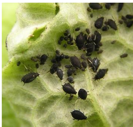
Slika 11. Crna repina uš

Odrasle jedinke crne repine uši su crne boje (slika 11), dok su ličinke zelene boje. Odrasli su dugi 1,3 - 2,6 mm s ticalima duljim od polovice tijela ( https://www.chromos-agro.hr/crna-repina-us/ ). Obično se javljaju u svibnju na rubovima repišta, te se nedugo zatim prošire po cijelom repištu. Nalaze se na naličju lišća, obično u kolonijama koje čine štetu sisanjem sokova te na taj način uzrokuje kovrčanje lista, stoga biljke zaostaju u razvoju. Izuzev ovakvih šteta, uši su prijenosnici raznih virusa. Lisne uši imaju više generacija godišnje, dakle zaraza se može naglo povećati. Za vrijeme jakog napada mogu prinos smanjiti i do 90 %, ali obično su štete oko 15 % (Maceljčki i sur.,1997.). Najpogodnije temperature za razvoj se kreću 20 - 25 °C. Suzbijanje se obično obavlja kada se utvrdi da je 20 – 30 % biljaka repe zaraženo (Maceljčki i sur.,1997.). Sredstva za suzbijanje crne lisne uši su: Mavrik Flo, Evure (FIS, 2024.)