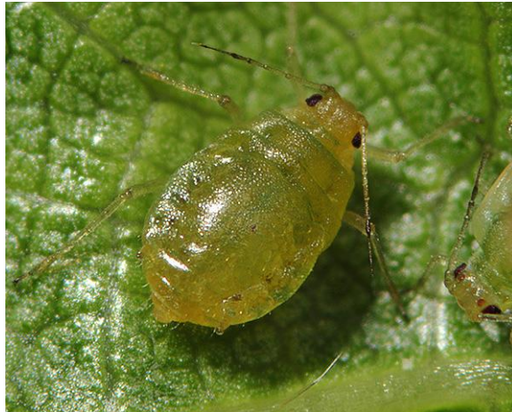
Slika 18. Šljivina uš kovrčalica

Šljivina uš kovrčalica ima tijelo zelene boje, dugo 1,5 - 2,0 mm (slika 18). Prezimi u stadiju jaja. Javlja se krajem svibnja i početkom lipnja, te je tada najjači napad spomenutih lisnih uši. Napada sve dijelove, ali najčešće se nalaze na lišću i nerascvjetaloj glavici, stoga se ona više ne razvija. Suzbijanje ovog štetnika se smanjuje optimalnim sklopom (Maceljski i Igrc, 1991.), a insekticidi koji se koriste u borbi protiv šljivinih uši kovčalica su Evure, Mavrik Jet, Flipper, Mavrik Flo (FIS, 2024.)