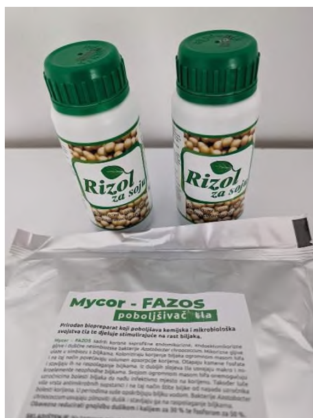
Slika 3. Mikrobiološki preparati

Prije sjetve soja je tretirana preparatom Rizol za soju (Slika 3.) koji sadrži korisne bakterije Bradyrhizobium japonicum koje žive u simbiozi s korijenom soje te fiksiraju dušik iz atmosfere. Sjeme je također tretirano i s preparatom Mycor (FAZOS) koji sadrži mikorizne gljive koje žive u simbiozi s korijenom soje, opskrbljuju s nedostupnim hranjivima i vodom. Sjeme dvije eksperimentalne sorte zaštićeno je i fungicidom.