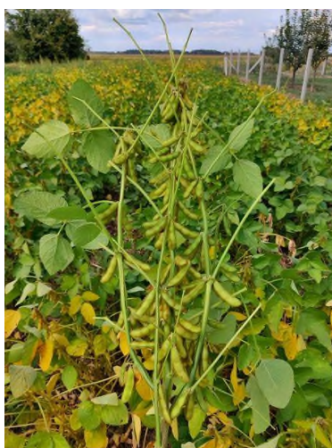
Slika 12. Usjev postrne soje u vrijeme nalijevanja zrna 2023. godine (Prša F., 2023.)

Soja je kultura koja će zasigurno u budućnosti pronalaziti sve više mjesta na površinama uz mnogo prostora za napredovanje u segmentu prinosa soje. Dolaskom novog sortimenta i novih tehnologija biostimulatora otkrivamo nove mogućnosti u uzgoju soje. Pozitivan trend rasta prinosa vjerojatno će se i nastaviti. S obzirom na dužinu vegetacije možemo reći da je u Republici Hrvatskoj uz pravilan odabir sortimenta, parcele, agrotehnike i zaštite te uz mogućnost navodnjavanja ostvariv vrlo dobar prinos soje. Porastom površina koje imaju pristup navodnjavanju dodatno raste i potencijal uzgoja postrne soje. Trenutno se radi i na proizvodnji ječmova specijalne namjene za postrnu sjetvu. To su sorte koje imaju 14-20 dana kraću vegetaciju te su u prosječnoj proizvodnoj godini spremni za žetvu krajem svibnja ( https://www.axereal.hr/sites/default/files/2024-04/Vertti.pdf ). Razvoj No-till tehnologije također je značajno unaprijedio i olakšao proizvodnju postrne soje. Definitivno možemo zaključiti da je soja biljka budućnosti!