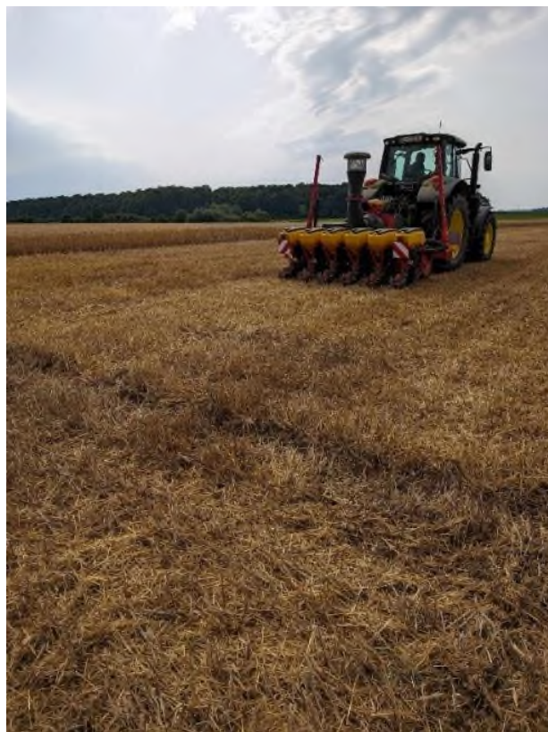
Slika 7. Sjetva postrne soje (Prša F., 2023.)

Postrna sjetva većinom se obavlja od 20. lipnja do 1. srpnja. Nažalost za trend sjetve postrne soje se ne bilježe službeni rezultati. Nisu točno poznate površine na kojima se ova kultura uzgaja.