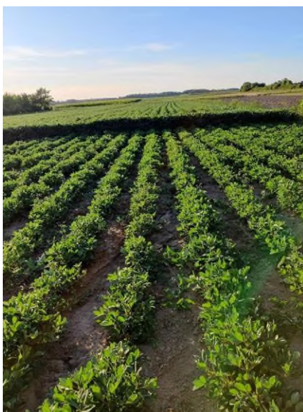
Slika 1. Uzgoj kikirikija (Prša, F., 2023.)

Istraživanje je provedeno na OPG-u Prša čije je sjedište u mjestu Kutovi u Virovitičko-podravskoj županiji. Gospodarstvo je u vlasništvu Vlade Prše. Na površini od 14 hektara gospodarstvo proizvodi ratarske kulture. U sklopu gospodarstva nalazi se i svinjogojska farma s godišnjom proizvodnjom od 50 tovljenika. Posljednjih nekoliko godina također proizvode crveni kukuruz i kikiriki (Slika 1.) po čemu su postali vrlo prepoznatljivi.