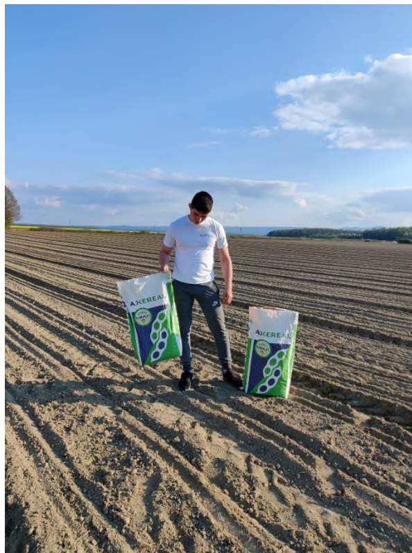
Slika 4. Sjetva soje (Prša F., 2021.)

Na OPG-u Prša 90 % soje zasijane u redovnim rokovima sjetve pripada u 1. grupu zrenja. Sva soja zasijana u redovnom roku sjetve na OPG-u Prša sije se na međuredni razmak od 70 cm. Zbog visoke intenzivnosti uzgoja soja se sije na najniži preporučeni sklop. Tako se potiče grananje, te povećava otpornost na polijeganje i bolesti.