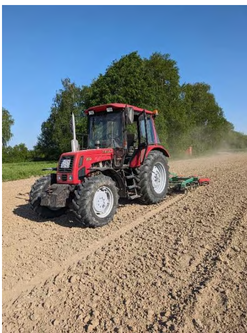
Slika 2. Predsjetvena priprema tla (Prša F., 2022.)

U proljeće se što je ranije moguće zimska brazda zatvara teškom drljačom (Slika 2) kako bi spriječili kapilarni uspon vode i gubitak vlage akumulirane tijekom zimskih mjeseci. Prilikom zatvaranja zimske brazde u tlo se unosi 175 kg/ha gnojiva NPK 8-20-30, a predsjetveno još 85 kg/ha KAN-a (27 % N).