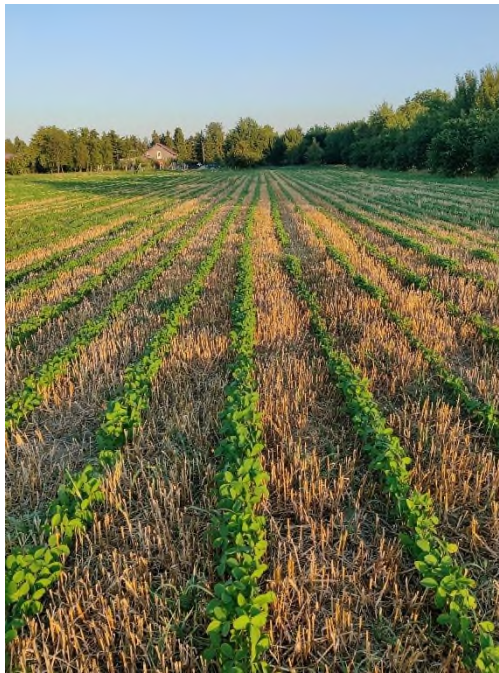
Slika 6. Postrna soja (Prša F., 2023.)

Ukoliko postoji mogućnost navodnjavanja usjeva, soja može postići prinose gotovo iste kao i u redovnoj sjetvi. Bez navodnjavanja prinosi su nešto niži. Predkulture u postrnoj sjetvi soje mogu biti: ječam, pšenica ili djetelinsko travne smjese. Iznimno je bitno da je razdoblje između žetve predusjeva i sjetve postrne soje što kraće jer se tako najbolje iskorištava vlaga u zemljištu.