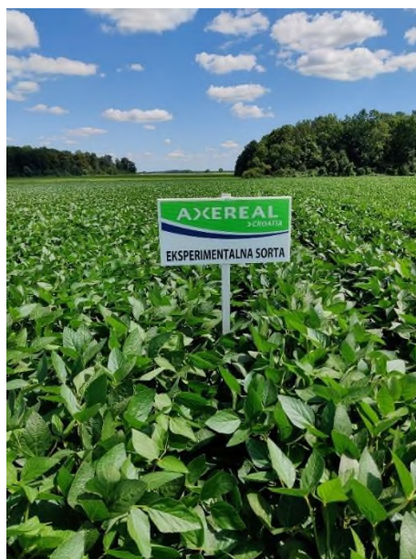
Slika 11. Eksperimentalne sorte (Prša F., 2023.)

Sorte RGT Stocata, RGT Straviata i LID Survivor pokazuju odlične osobine i potencijal veći od ES Palladora. U 2022. i 2023. godini vremenske prilike nisu bile povoljne za uzgoj soje, stoga soja nije uspjela doseći svoj puni potencijal rodnosti.