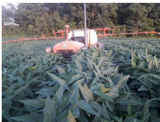
Slika 8. Zaštita soje od crvenog pauka (Prša F., 2021.)

Jači napad crvenog pauka uočen je 2021. godine, tako da je u 2021. godini na OPG-u Prša provedena zaštita od crvenog pauka (Slika 8.).