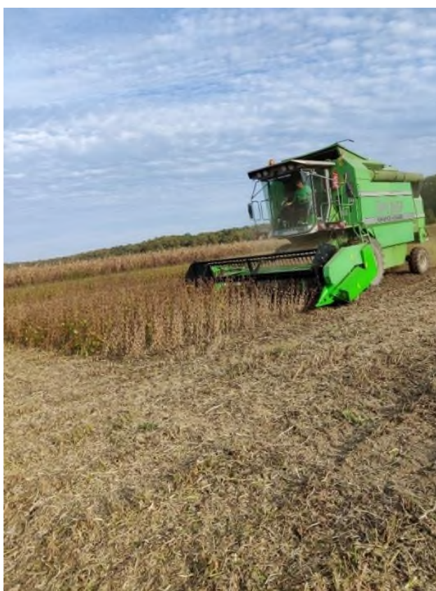
Slika 10. Žetva soje (Prša F., 2021.)

Žetva soje većinom se obavlja krajem rujna ili početkom listopada (Slika 10.). S obzirom da se u redovnoj sjetvi siju kasne sorte, a u postrnoj rane te tako obje soje dozrijevaju u isto vrijeme. Žetva se obavlja kombajnom koji je opremljen adapterom za pšenicu i dodatcima za žetvu soje. Dopuštena vlažnost zrna prilikom žetve soje je 13 %. Ukoliko je vlaga viša od dozvoljene potrebno je dosušivanje zrna, što uzrokuje dodatne troškove u proizvodnji. Vaganje prinosa pojedinih sorti obavlja se na parceli pomoću preciznih vaga. Prilikom toga se ispunjava tablica s prinosima za svaku sortu. Nakon žetve soja se skladišti u jumbo vrećama, a prije korištenja za hranidbu svinja mora se termički obraditi.