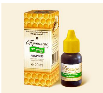
Slika 11. Propolis u alkoholnoj otopini

Termalne inhalacije propolisom izvode se pomoću vodene kupke s propolisom i voskom, te se preporučaju kod bolesti dišnog sustava. U posudu za inhalaciju stavimo 60 g propolisa i 40 g pčelinjeg voska, te tu posudu stavljamo u veću posudu sa kipućom vodom nad kojom možemo izvoditi tretman termalne inhalacije.