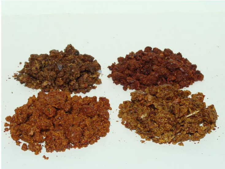
Slika 10. Sušeni propolis