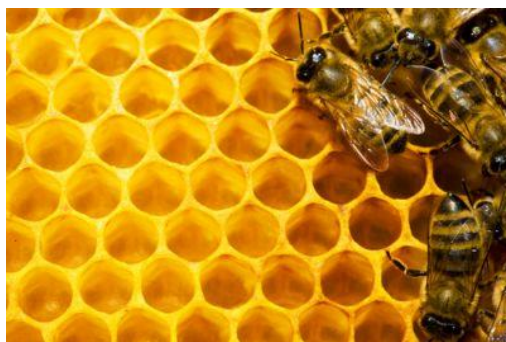
Slika 1. Pčelinje saće