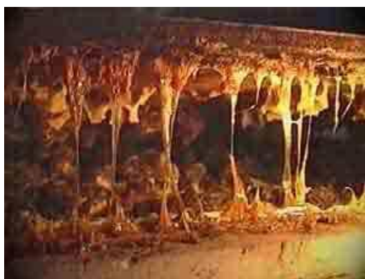
Slika 9. Zatvaranje košnice pomoću propolisa

Propolis je smolasti pčelinji proizvod koji pčele skupljaju sa biljaka i koji se smatra prvom linijom obrane pčela od različitih štetnih utjecaja brojnih organizama i mikroorganizama. Propolis je prirodni antibiotik koji svojim antibiotskim i antivirotskim djelovanjem štiti pčelinju zajednicu, te pčelin organizam. Aristotel je rekao kako pčele zatvaraju svoju zajednicu pomoću tvari koju prikupljaju od suza cvijeća i nekog drveća.