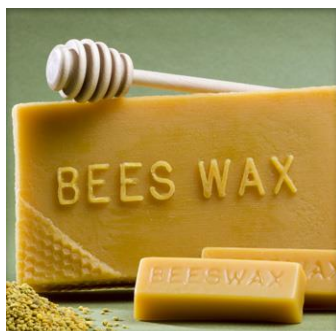
Slika16. Prerađeni pčelinji vosak