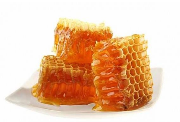
Slika 3. Med u saću