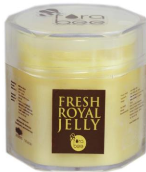
Slika 7. Kupovna matična mliječ u svježem obliku