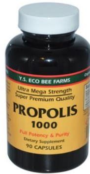
Slika 12. Propolis u tabletama