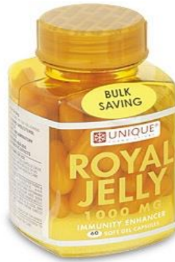
Slika 8. Matična mliječ u tabletama