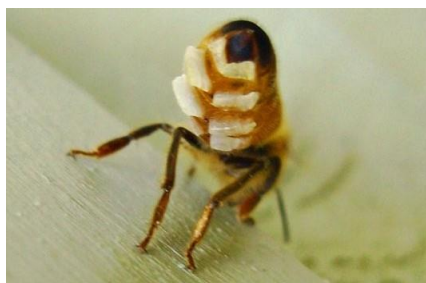
Slika 15. Izlučivanje pčelinjeg voska

Pčelinji vosak je nusproizvod voskovnih žlijezda u pčela radilica. Pčela ima četiri para voskovnih žlijezda, položenih na trbušnoj strani. Voskovne žlijezde povezane su sa otvorima na površinu tijela pčele, te sekret žlijezda koji izlazi kroz otvore na zraku se stvrdnjava i oblikuje voštane pločice, koje nazivamo pčelinji vosak. Za proizvodnju voska potrebna je određena količina energije te određenih tvari. Za tu energiju u organizmu pčela zaslužni su ugljikohidrati, ponajviše glukoza, fruktoza i saharoza.