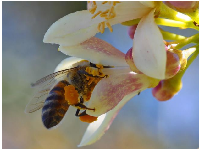
Slika 4.: Nakupine cvjetnog praha na nogama pčele

U normalnim okolnostima, pčela odjednom u košnicu donese 16 do 24 mikrograma peluda, što je približno 3 do 4 milijuna peludnih zrnaca, a to predstavlja desetinu njene težine. U cijeloj sezoni pčelinja zajednica prikupi i koristi oko 30 kilograma peludi, a godišnje pčelinja zajednica sabere 30 do 40 kilograma te dragocjene hrane.