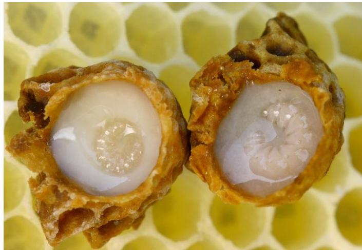
Slika 6. Matična mliječ

Matična mliječ je homogena, gusta, kremasta tvar, blijedo žućkaste boje, te karakterističnog mirisa i specifično kiselo-slatkog okusa. Gustoća matične mliječi iznosi oko 1,1 g/cm 3 . Protočnost ili viskoznost matične mliječi je promjenjive prirode, te se mijenja ovisno o sadržaju vode i starosti, a sa starošću matična mliječ postaje viskoznija. ( Lercker i sur., 1992.)