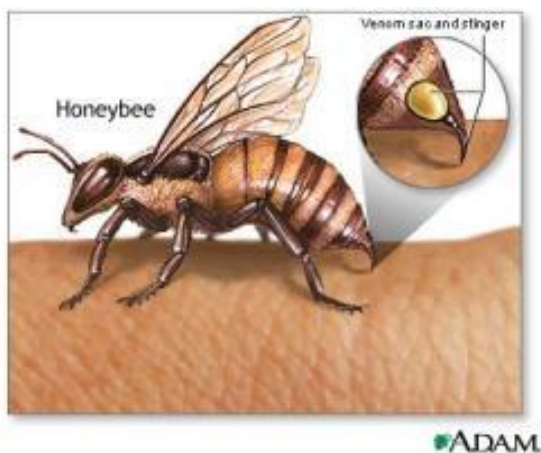
Slika 13. Pčelinji otrov

Pčelinji otrov ili na latinski: apitoksin , dolazi od riječi apis i toxicum što prevedno na hrvatski znači pčela i otrov. Priroda se evolucijski pobrinula da pčele imaju i fizičku zaštitu od mogućih predatora, te su pčele radilice i matice razvile žalac na kraju zatka, kroz koji ubrizguju u predatora pčelinji otrov. Pčelinji otrov je zapravo tekućina složenog kemijskog sastava koja u sebi ima puno enzima koji djeluju toksično u organizmu eventualnog predatora. Danas u svrhe alternativne medicine uzimamo pčelinji otrov putem električne stimulacije. Otrovnost pčela radilica drugačijeg je kemijskog sastava od otrova matice, te je otrov dobiven ubodom također drugačijeg kemijskog sastava od otrova dobivenog električnom stimulacijom.