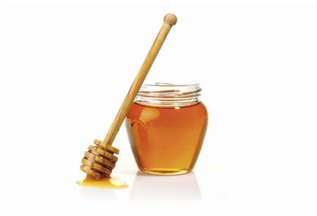
Slika 2: Med

Med je prirodni proizvod pčela u gustom tekućem ili kristaliziranom obliku, koji nastaje preradom nektara i medljike u mednom mjehuru pčela. Cilj sakupljanja nektara i proizvodnje meda je stvaranje zalihe hrane za hladan i dug zimski period. Organoleptička svojstva meda kao što su boja, miris i okus ovise o cvjetnom nektaru te je med iz tog razloga drugačiji po tim svojstvima od lokacije do lokacije, ovisno o geografskom podrijetlu. Boja i okus meda mogu varirati čak i ako je med s iste lokacije i iz iste godine, pošto je med vrlo ne jednoličan proizvod u smislu sastava nektara i godišnjeg doba u kojem je proizveden.