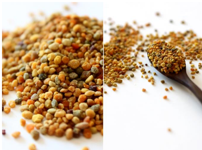
Slika 5. Sušeni cvjetni prah

Pelud kao namirnica ima vrlo veliku nutritivnu i energetska vrijednost. Između raličitih vrsta peludi velike su razlike u nutritivnoj vrijednosti. Sastojci peluda su vrlo različiti te ovise o vrsti biljke s koje su ga pčele sakupljale. Per oralna (na usta) konzumacija je osnovna konzumacija peluda. Nutritivna vrijednost peludi očituje se u nutrijentima koji se u njoj nalaze. Pelud je kao namirnica vrlo kvarljiv zbog velikog sadržaja vlage, te ga treba odmah po skupljanju sušiti ili zamrznuti. Veće količine suše se u sušarama 48 sati, pri stalnoj temperaturi od 40 do 45°C. Pravilno sušenje osigurava očuvanje svih bitnih svojstava cvjetnog praha.