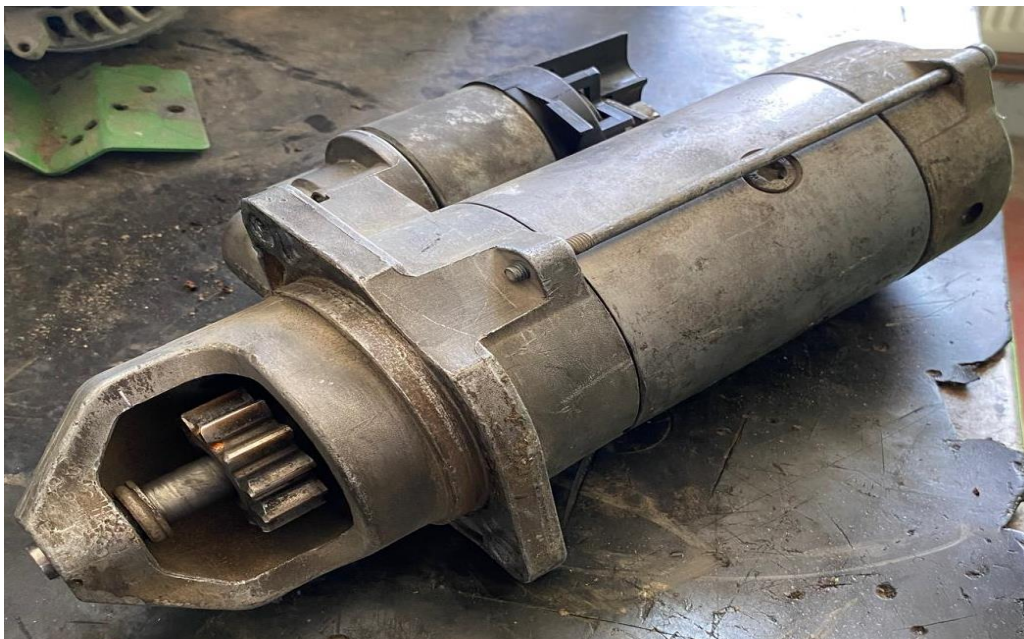
Slika 10. Neispravan elektropokretač