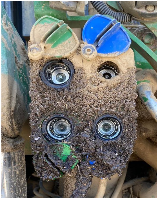
Slika 11. Neispravni hidraulični priključci