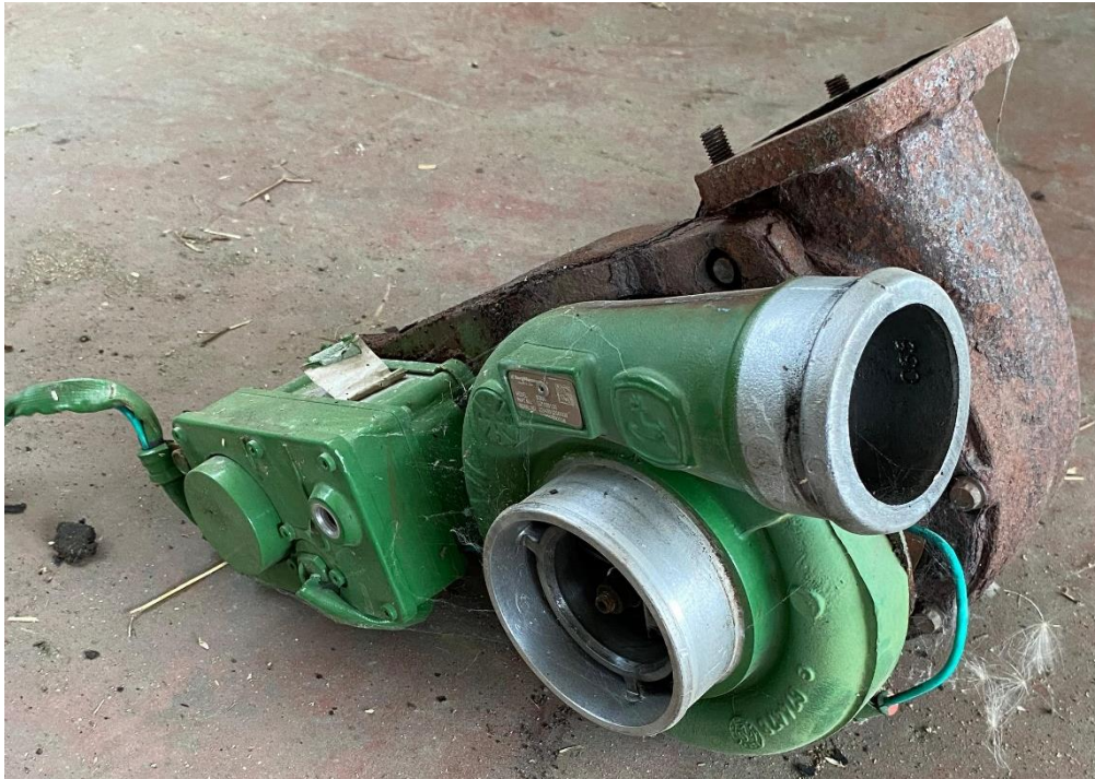
Slika 12. Neispravan turbopunjač