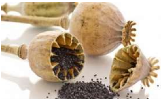
Slika 7.: Zreli tobolci i sjeme maka