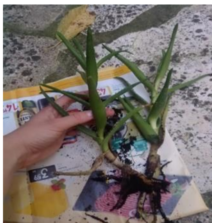
Slika 17.: Mladice Aloe vere

Najjednostavniji način razmnožavanja Aloe i rasađivanja mladica je da se pažljivo odvoji izdanak sa dna ili pupoljak matične biljke i da se on zasadi (Ledwon, 2007.). Već u drugoj godini života Aloa vera obično sama pobrine za svoje potomstvo stvarajući iz korijena nove mladice. Tada ih treba samo odvojiti (rezanjem korijena) i nove biljke presaditi na novo mjesto (Slika 17).