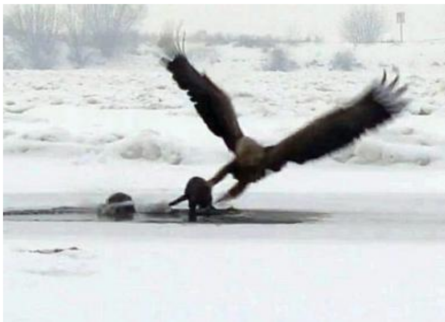
Slika 12. Orafo štekavac neopreznoj vidri krade jegulju ( http://www.naucat.com/admin/phpthumb/phpThumb.php?src=http://www.naucat.com/images/120314/primaryImage-23026-31169.jpg&w=390&h=&zc=0&aoe=0 )