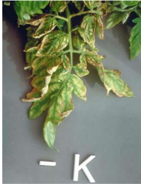
Slika 7. Izraženi nedostatak kalija na rajčici [3]