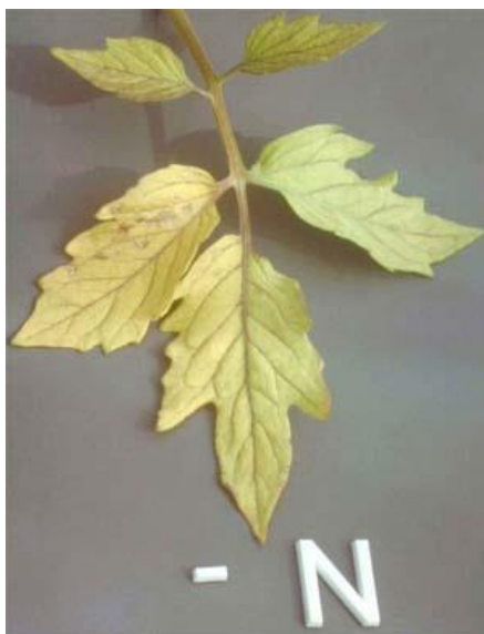
Slika 1. Nedostatak dušika na rajčici Lycopersicon esculentum [3]