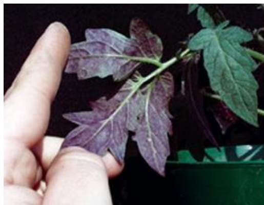
Slika 4. Nedostatka P na rajčici [5]