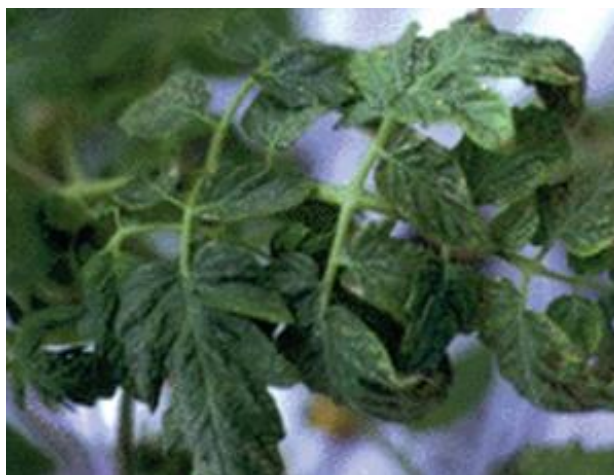
Slika 6. Prvi simptomi nedostatka kalija na rajčici [5]

Suvišak kalija je rijedak a moguć je na zaslanjenim tlima ili kod višekratne obilne gnojidbe [2] .