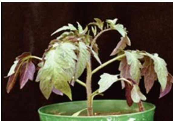
Slika 3. Nedostatka P na rajčici [5]

Višak fosfora je rijedak a nastupa kod koncentracija većih od 1% u suhoj tvari. Rast biljaka je usporen uz tamne pjege na lišću koje se šire prema bazi te lišće na kraju otpada. Metabolizam je ubrzan pa dolazi do skraćenja vegetacije, prijeveremenog cvjetanja i starenja biljaka ( Vukadinović, V., Vukadinović V., 2011 ).