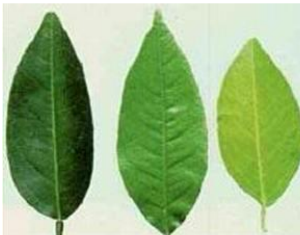
Slika 2. Simptomi slabijeg i intenzivnijeg nedostatka dušika na listu trešnje [2]