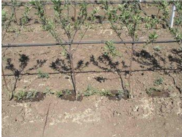
Slika 8. Navodnjavanje kapanjem