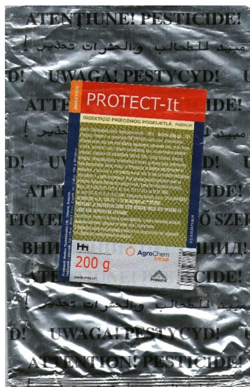
Slika 5. Dijatomejska zemlja Protect-it ® (Hedley Technologies Ltd., Ontario, Kanada)

Korištena je dijatomejska zemlja Protect-it ® (Hedley Technologies Ltd., Ontario, Kanda; AgroChem MAKS d.o.o., Zagreb, Hrvatska). Inertno prašivo DZ Protect-it ® ubraja se u fizikalne insekticide i postiže maksimalnu efikasnost na zrnju s vlagom manjom od 14,5%. Prilikom ispitivanja korištene su tri koncentracije prašiva, od 0,01; 0,02 i 0,04 g/50 g pšenice.