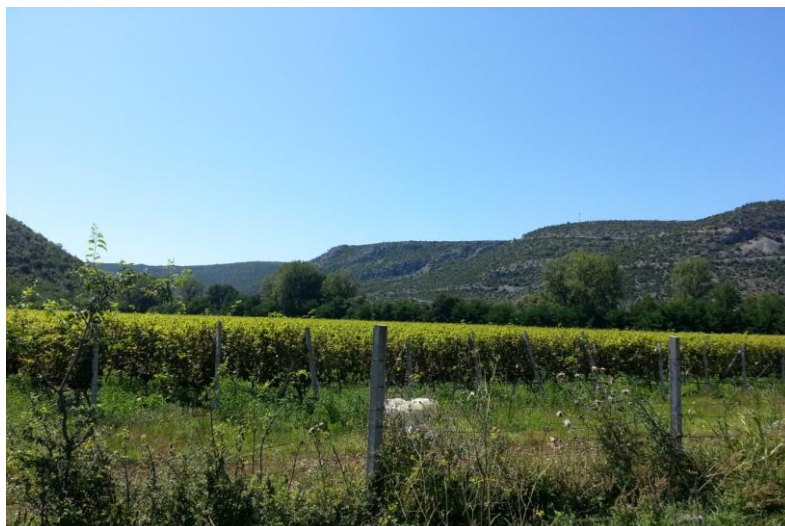
Slika 8. Vinograd Žitomislići