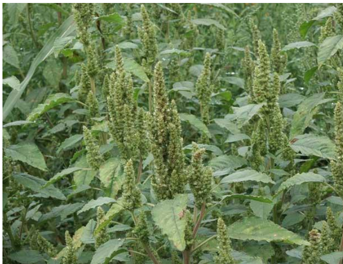
Slika 32. Štir

Nema registriranih herbicida za upotrebu u štiru, pa se zato korov suzbija samo mehanički. U početku raste sporo i tada je neophodno držati korov pod kontrolom sa nekoliko kultiviranja i okopavanja.