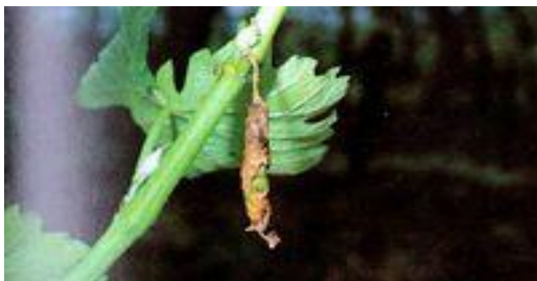
Slika 28. Cigaraš na listu