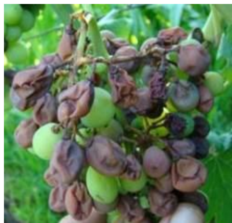
Slika 17. Plamenjača na grozdu