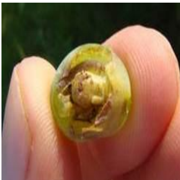
Slika 30. Oštećenje bobe od grozdovog savijača