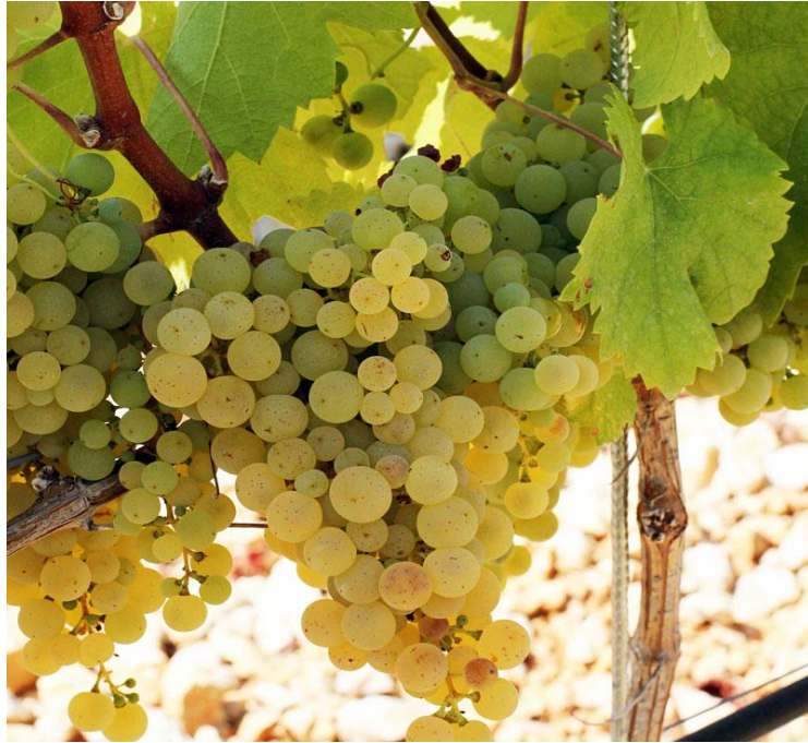
Slika 10. Žilavka