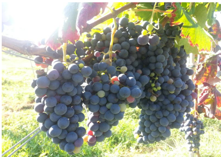
Slika 3. Blatina

Blatina je crvena autohtona sorta Hercegovine (Slika 3.). Ona ima funkcionalno ženski cvijet (autosterilan) zbog čega se u nasadima uvijek uzgaja s drugim kultivarima (sortama) kao što su Alicante bouschet (Kambuša), Merlot i Trnjak koji su ujedno i oprašivači Blatine. Težina grozda je od 200 do 300 grama. Uzgaja se na srednjem visokom stablu, na toplim i suhim položajima. Mošt Blatine sadrži od 19-22% sladora, ponekad i više, a količina ukupnih kiselina je 6-7 g/l.