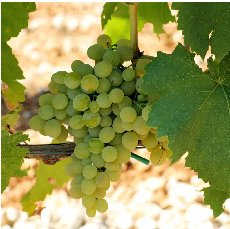
Slika 11. Prateća sorta žilavke –Bena