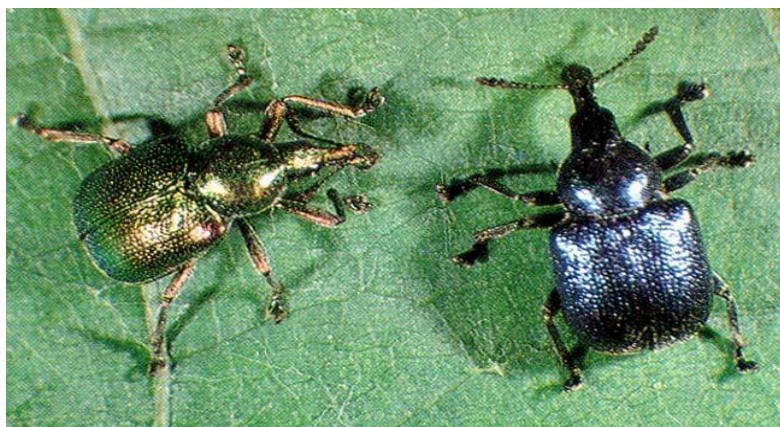
Slika 27. Cigaraš

Suzbijati se može skidanjem i uništavanjem tuljaca (cigara) zajedno s ličinkama i jajima čime smanjujemo napad naredne godine. Odrasle pipe su dobro primjete pa se također mogu skupljati i uništavati. Kemijsko zaštita se može provesti u vrijeme dok je broj tuljaca još malen, a odrasli cigaraši su brojni. Najpovoljniji rok za kemijsko tretiranje je u svibnju. Od insekticida koriste se oni na bazi endosulfala, fentiona, fosalona, fenitrotiona.