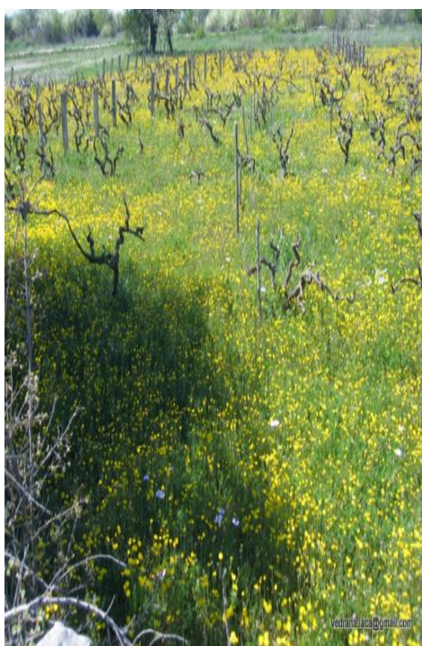
Slika 33. Maslačak