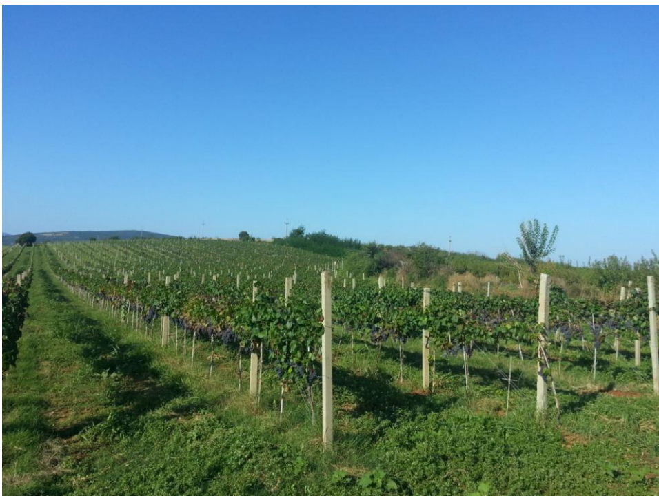
Slika 2. Vinarija Hepok- vinograd 2.