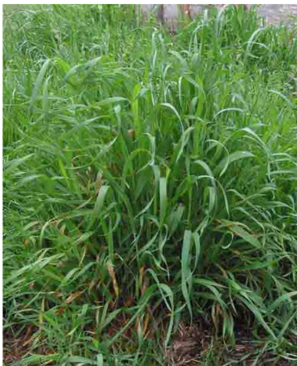
Slika 31. Pirika

Hrvatski naziv: Pirika, puzava pirika, tkalac, vornica, pirevina, troskot, pirac, plazeča pirnica, perika, perikovina. Pirika je često nepoželjan gost vrtova. Podanak biljke raste brzo i duboko te ga je nemoguće iskorijeniti jer se veoma lako miješa s onim što se uzgaja u vrtu. To je trajna biljka; dosadan i žilav korov po njivama i vlažnim poljima. (Hulina, 1998.) Širi se podzemnim puzavim rizomom. Nadzemni dio naraste i do 1,2 metra (Slika 31.) Cvjetovi su udruženi u dugim dvorednim klasovima dugačkim i do 10 centimetara. Biljka cvjeta cijelo ljeto.