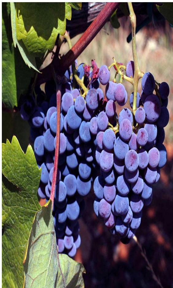
Slika 15. Plavac mali

tomu su svakako tvrda kožica bobice i čvrsta građa. Postoji dosta raznolikosti u botaničkim obilježjima između tipova populacije plavca. Veličina, oblik i težina grozda i bobice znatno variraju. Odrasli list je peterokutan, srednje veličine. Rebra na naličju lista su gola i baršunasta uz plojku. Naličje lista je paučinasto.