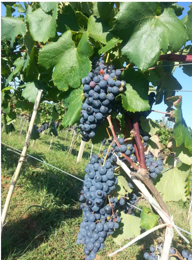
Slika 4. Trnjak

su slabog antocijanskog obojenja. Mladi list je zelene boje s jako izraženim vunastim dlačicama na naličju. Odrasli list je peterodijelnog oblika s tri isječka. Površina plojke je glatka, zupci su pravilni i šiljasti. Sinus peteljke je otvoren i u obliku slova U. List je gol i bez dlačica. Spada u listove srednje veličine. Cvijet je morfološki i funkcionalno hermafroditan, a na mladici se uglavnom nalaze po tri cvata. Grozd je kratak, srednje je veličine, piramidalan i zbijen (Slika 4.). Bobica je okruglasta, srednje veličine, izrazito tamne modre boje, neobojenog i čvrstog mesa.