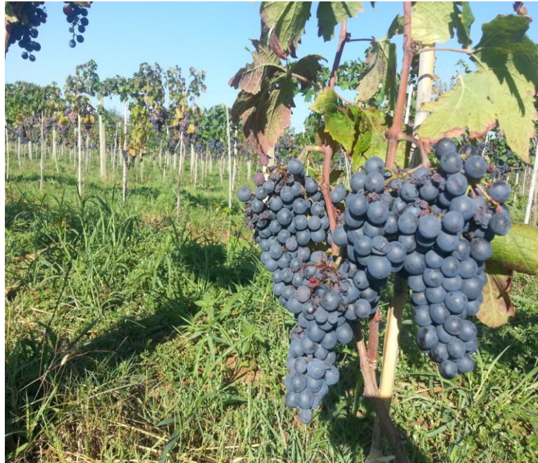
Slika 5. Alicante bouschet

zelen s bakrenim mrljama, a mladice imaju crvene linije na internodijima. Odraslo lišće je zelene jako obojene nervature, naličje lista dosta dlakavo. Grozd je srednje velik, a bobica srednje okrugla, s debelom čvrstom kožicom.