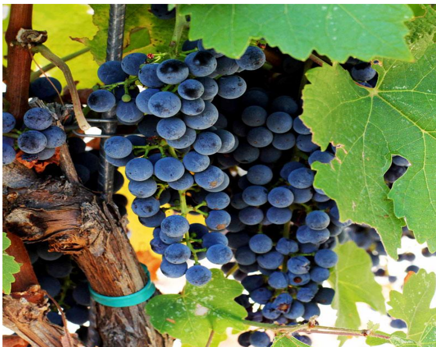
Slika 9. Cabernet Sauvignon