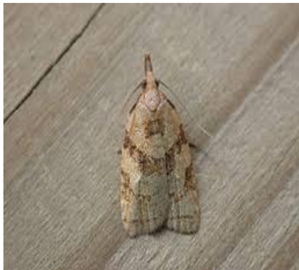
Slika 29. Grozdov savijač

Suzbijanje se provodi zimskim prskanjem organofosfornim insekticidima, a kad se napad uoči prska se insekticidima koji se koriste u zaštiti grozdova moljca kao što su: biotehnički insekticidi na bazi fenoksikarba i teflubenzurona.