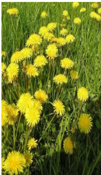
Slika 34. Maslačak