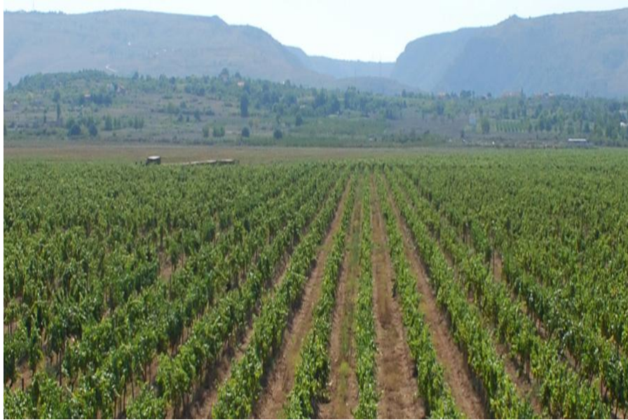
Slika 41. Vinograd Tepčić