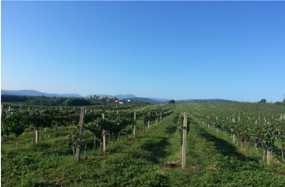
Slika 37. Vinarija Hepok – Vinograd 1.