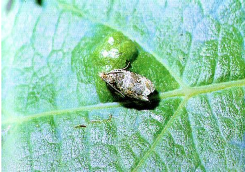
Slika 23. Pepeljasti groždani moljac