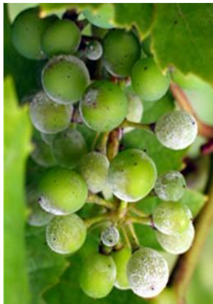
Slika 19. Pepelnica na grozdu