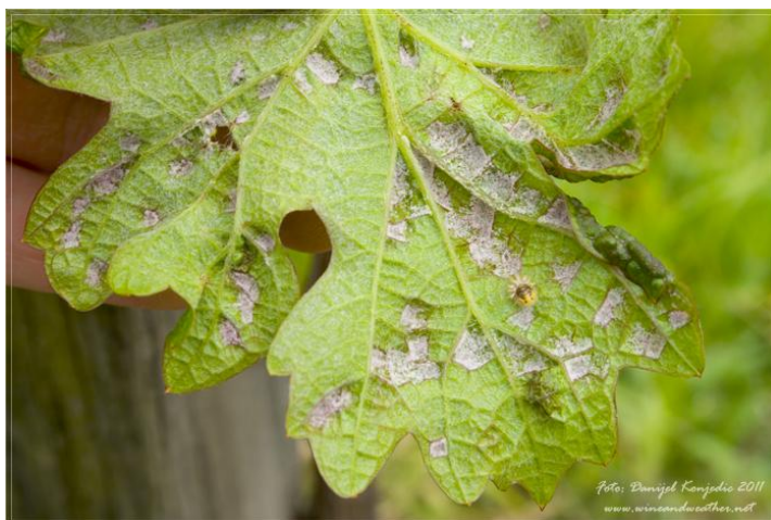
Slika 25. Lozina grinja kovrčavica-akarinoza