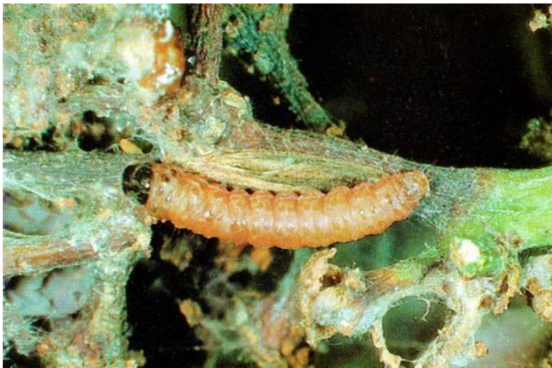
Slika 24. Pepeljasti groždani moljac