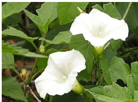
Slika 35. Poljski slak

Višegodišnja biljka, visina 20-100 cm (Slika 35.). Korjen prodire duboko u tlo, preko 200 cm. Stabljika je polegla ili se povija oko drugih biljaka, list je strijelicašast s peteljkom i vrlo promjenjiva oblika. Plod je tobolac i sadrži 4-5 tamnosmeđi do crnih sjemenki koje mogu klijati tijekom cijele godine, biljka proizvede oko 500 sjemenki koje mogu klijave biti u tlu i do 200 godina. Vrijeme cvatnje: svibanj – rujan. Stanište: okopavine, vinogradi, pašnjaci.