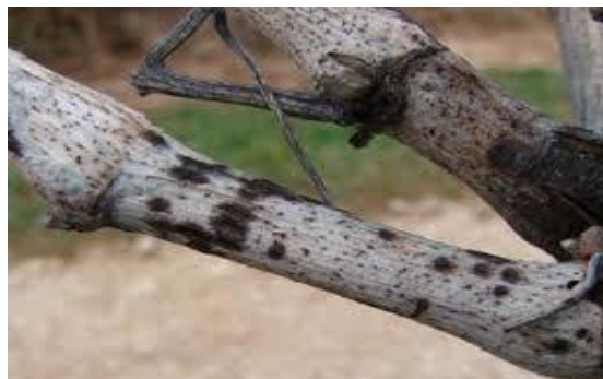
Slika 21. Crna pjegavost loze

U zaraženim vinogradima, uspjeh se može postići samo upornom zaštitom tijekom dužeg razdoblja. Prilikom rezidbe, koliko je moguće, treba odstraniti zaraženu rozgvu. Nakon rezidbe rozgvu treba iznijeti iz vinograda jer predstavlja vrlo važan izvor zaraze. U vinogradima u kojima postoji zaraza neophodno je obaviti zimsko prskanje s jednim od fungicida na osnovi bakra. Od fungicida za suzbijanje crne pjegavosti u vegetaciji registrirani su Mikal, Dithane M-45, Polyram DF, a djelotvorni su i Folpan, Antracol combi i strobilurini – Quadris i Stroby.