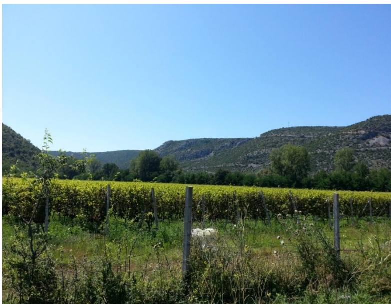
Slika 40. Vinograd Žitomislići