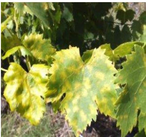
Slika 16. Plamenjača na listu

U ranijoj fazi razvoja se preporučuje primjena pripravaka na bazi propineba (Antracol, Antracol combi). U najosjetivijem razdoblju u cvatnji i trenutku razvoja bobice preporučuju se pripravci na bazi kontaktnog i sistemičnog djelovanja, a tu spadaju: Mikal Flash, Verita, Profiler, Mikal Premium i Melody Duo. Za kasni napad se preporučuje Profiler i bakreni Antracol.