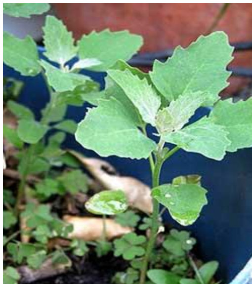
Slika 36. Loboda

Postoji nekoliko vrsta lobode, neke su od njih jestive, dok druge nisu. Bijela loboda ( Chenopodium album ) je europski rođak špinata i cikle. Raste uz rubove ceste, u poljima, na gradilištima, voćnjacima, vinogradima. Bijela loboda može narasti i do 6 metara u visinu. Ova biljka ima listove u obliku dijamanta, koji su pokriveni bijelim prahom, zbog čega je i dobila svoj naziv (Slika 36.). (Hulina, 1998.) Jednogodišnja biljka, može narasti 15-100 cm, stabljika uspravna i razgranata, listovi izmjenični i duguljasti (jajoliki), plod je bubrežasti oraščić, s crnom hrapavom sjemenkom koja nije srasla s usplođem.