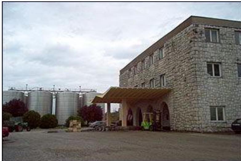
Slika 12. Vinarija Čitluk

Vinogradi koji se nalaze u sklopu vinarije: Kameni vinogradi, Dubrava (stara i nova plantaža), Kručevići, Tepčići, Konjuši (vinograd, voćnjak maslenik), Žitomislići 1 (gornje polje), Žitomislići 2 (donje polje).