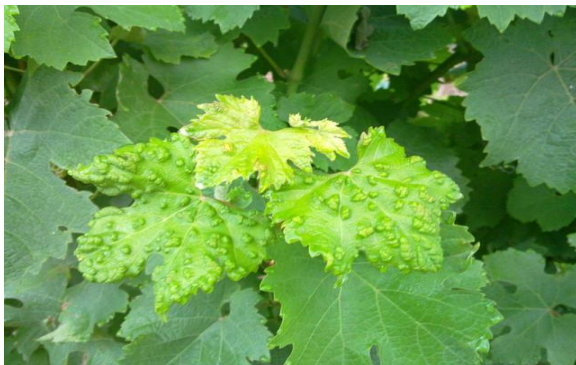
Slika 22. Filoksera

Suzbijanje se ne provodi na cjepljenoj europskoj lozi. U matičnjacima američke loze napad uši šiškarića suzbija se prskanjem tijekom mirovanja vegetacije sredstvima za zimsko prskanje koja ubijaju jaja.