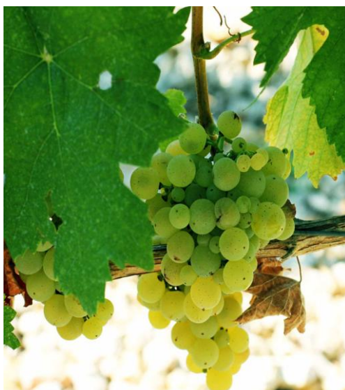
Slika 14. Prateća sorta Žilavke – Krkošija

Sazrijeva u trećem razdoblju kao i Žilavka i ima neredovitu oplodnju zbog pojave anomalija u građi cvijeta. Težina grozda varira od 100 do 200 g (Slika 14.). Odgovara joj kratka rezidba te voli propusna zemljišta s dovoljno vlage, kakve su uglavnom crvenice na prostorima Brotnja, Dubrave i oko Ljubuškog. Slabije podnosi sušu i neplodna tla. Na plodnim zemljištima daje grožđe dobre kvalitete s dobrim sadržajem šećera i kiselina. Daje trpkovo vino zelenkasto-žute boje s dobrim ekstraktom, ali bez izražene arome. U čistom sortnom sastavu ne predstavlja neku kvalitetu, ali u kupaži sa Žilavkom i Benom mogu se postići dobra i kvalitetna vina.