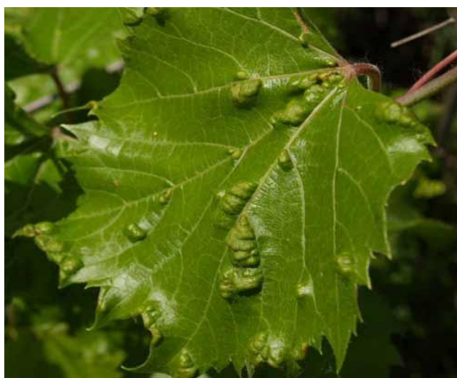
Slika 26. Lozina grinja šiškarića-erinoza