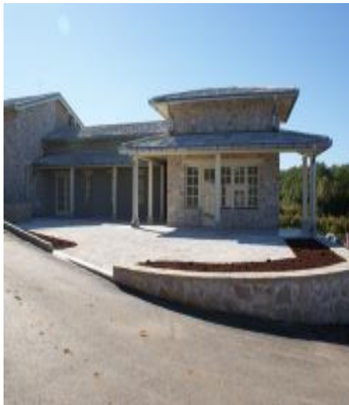
Slika 6. Vinarija Domanovići Zadro

Vinarija Zadro, osim što proizvodi autohtone sorte vina poput Žilavke i Blatine, poznata je i kao prva vinarija u Bosni i Hercegovini koja je 1998. godine proizvela domaći pjenušac "Domano". Pjenušac je napravljen na bazi sorte Žilavka klasičnom metodom vrenja u boci.