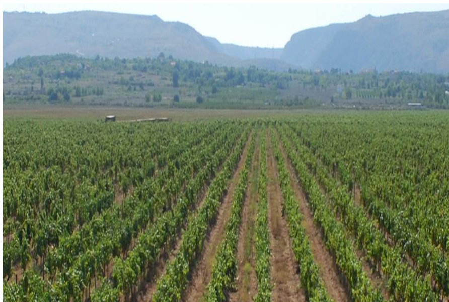
Slika 13. Vinograd Tepčić