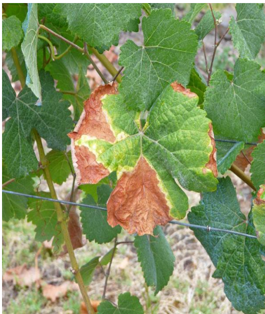
Slika 18. Pepelnica na listu