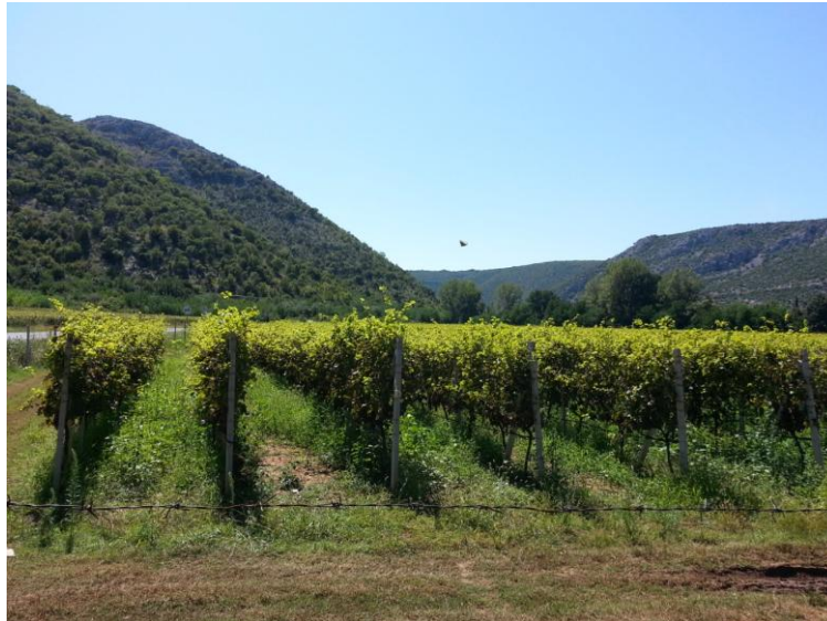
Slika 7. Vinograd Žitomislići