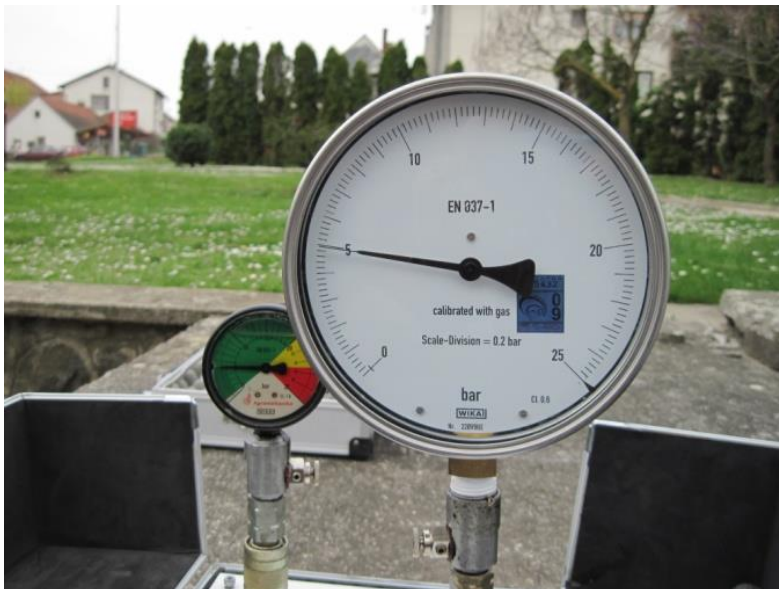
Slika 5. Uređaji za kontrolu tlaka