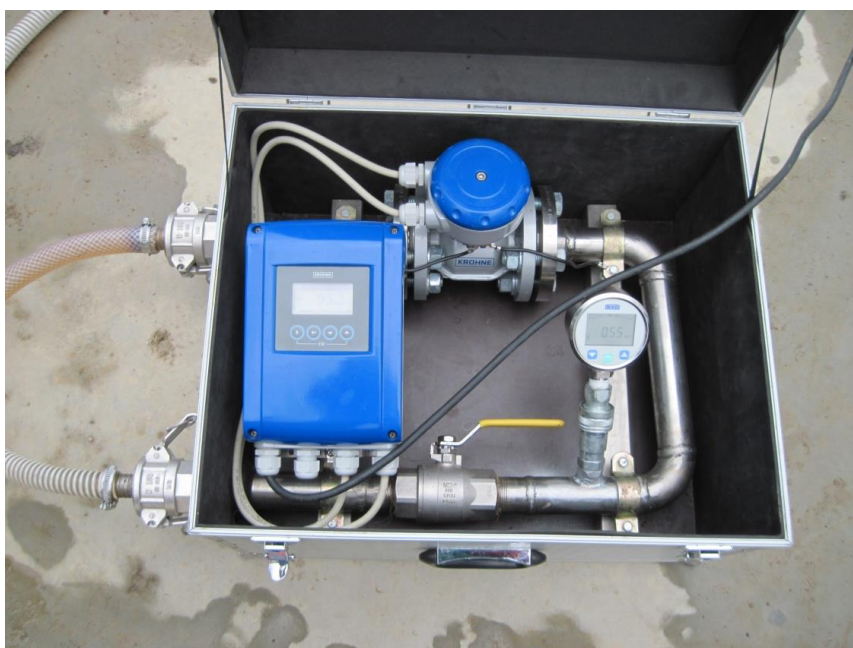
Slika 6. Elektromagnetski mjerač kapaciteta crpke tvrtke Krohne

Prema normi EN 13790 dozvoljeni pad kapaciteta crpke može najviše iznositi do 10 % od nazivnog kapaciteta. Kod ispitivanih prskalica ugrađenih crpki polučile su vrijednosti smanjenja kapaciteta unutar dozvoljenih 10%. Kontrola kapaciteta crpki mjerena je sa elektromagnetskim mjeračem prikazanim na slici 6.