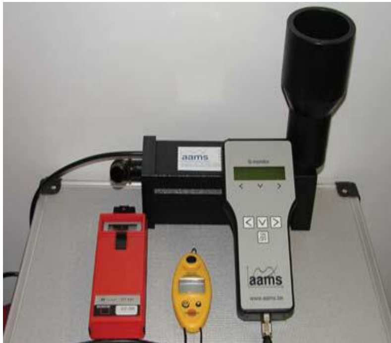
Slika 8. Uređaj AAMS za mjerenje protoka mlaznica

Ispitni stol ima elektronsku jedinicu za mjerenje protoka (Slika 8.) koja mjeri trenutni protok mlaznice, te rezultat sprema u vlastitu memoriju. Rezultati se naknadno obrađuju u posebnom softveru – spray monitor .