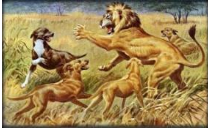
Slika 3. Rodezijski goniči u lovu na lavove

Dolaskom u Europu, rodezijski gonič dobiva višestruku namjenu. Postaje izuzetno cijenjen kao kućni pas, pas za pratnju i društvo te zaštitu i čuvanje. U nekim zemljama koristi se i kao policijski pas tragač te pas za utrke. ( http://www.rhodesianridgeback.hr/hr/standard )