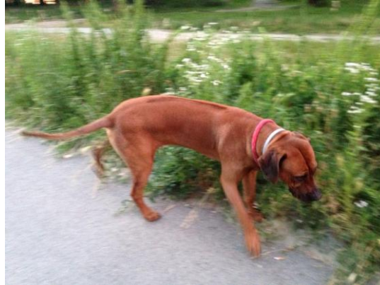
Slika 10. Rodezijski gonič u šetnji bez povodca

neophodno je provesti odgovarajuće odgojne mjere, ali treba misliti i na suradnju, jer ne podnose prisilnu oštrinu. ( http://neomele.com/o-pasmini-rhodesian-ridgeback/o-pasmini-rr )