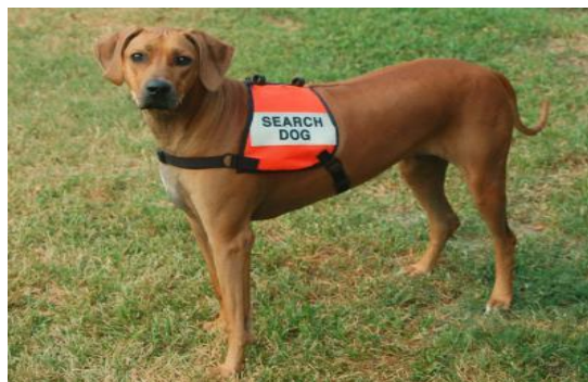
Slika 2. Rodezijski gonič kao tragač