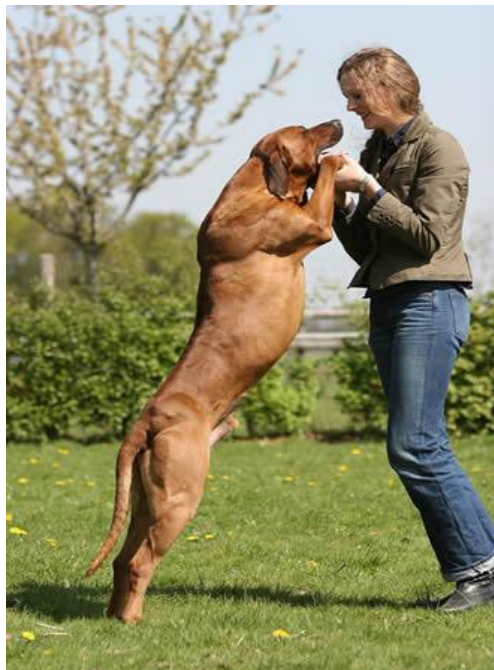
Slika 5. Mišićavo tijelo rodezijskog goniča

•Boja - varira od svijetlo do crveno- pšenične. Dozvoljeno je malo bijele dlake na prsima i šapama, ali previše bjeline je nepoželjno. Tamna njuška (maska) i tamne uši su dopuštene. Nepoželjno je puno crnih dlaka na tijelu. ( http://neomele.com/o-pasmini-rhodesian-ridgeback/o-pasmini-rr ).