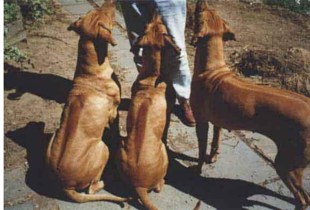
Slika 11. Dresura rodezijskog goniča

ga se snažno pritisne u području vrata i glave. Ukoliko se pas pokuša pomaknuti, ukori gase sa zapovjedi "daun" i u tom ga se položaju ostavi jednu minutu. (Tucak i sur., 2003.)