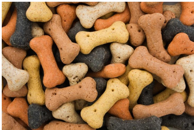
Slika 12. Pseća hrana

Voda mora biti dostupna psu u svakom trenutku. (Tucak i sur., 2003.)