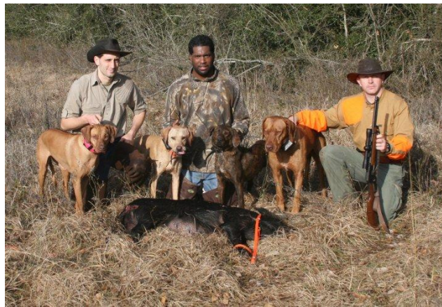
Slika 1. Prikaz lova s rodezijskim goničima

Prema FCI sustavu, goniči su svrstani u VI. skupinu, skupa s krvosljednicima. Podskupina goniča se dijeli na kratkonoge i dugonoge pasmine. Rodezijski gonič pripada u dugonoge pasmine, te se koristi u lovu na planinskim i brdskim lovištima koja nisu pristupačna hajkačima ili u slučajevima u kojima je teren za druge pasmine nepovoljan. Goniči su lovački psi od kojih se zahtijeva da pretražuju teren na kojemu se nalazi divljač, podižu je s ležaja i glasno gone u pravcu lovca ili blokiraju divljači do dolaska lovca. Ovakav način goničima je urođen, premda se neki dijelovi mogu dodatno poboljšati, a negativni smanjiti ili sasvim eliminirati. Lov s goničima razlikuje se od lova s ostalim pasminama jer se obično koriste u manjem ili većem čoporu. Za navedene pse mora se osigurati smještaj koji nije blizu izvora intenzivnih mirisa jer smeta njihovom njuhu. (Tucak i sur., 2002.)