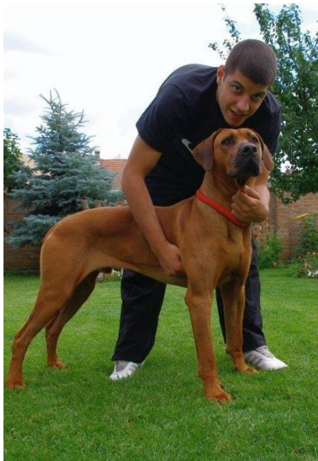
Slika 6. Uspravno držanje rodezijskog goniča

Dlaku ovog psa lako je održavati čistom. Treba biti kratka i gusta, te sjajna i glatka. Boja je od svijetlo-pšenične do crveno-pšenične. Nepoželjno je previše bijelog, pogotovo na trbuhu ili iznad prstiju, a dozvoljeno je na prsima i šapama. Puno crnih dlaka je izrazito nepoželjno. Ridge je dio dlake na leđima koja raste u suprotnom smjeru, mora biti jasno izražen, simetričan i zašiljen prema sapima. Započinje odmah iza grebena i nastavlja se do bedrenih kostiju. Riđ treba imati samo dvije krune, jednake i simetrične. Donji kraj krune ne smije prelaziti trećinu dužine riđa, a dobar prosjek širine riđa je 5 cm. ( http://www.rhodesianridgeback.hr/hr/standard )