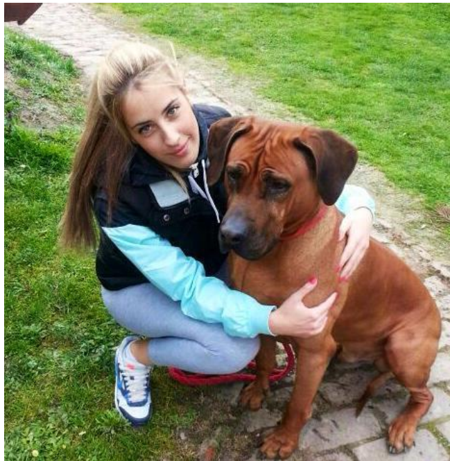
Slika 7. Privrženost rodezijskog goniča vlasniku

Rodezijskog goniča je obično lako naučiti na boravak u kući. Ne laje, osim kada je to potrebno. Kao štene, pun je energije, ali kako sazrijeva postaje sve opušteniji, čak ponekad i jako lijen pa je u stanju provesti cijeli dan u spavanju i ležanju. ( http://www.mojljubimac.hr/pasmine-pasa/rodezijski-gonic-lavova )