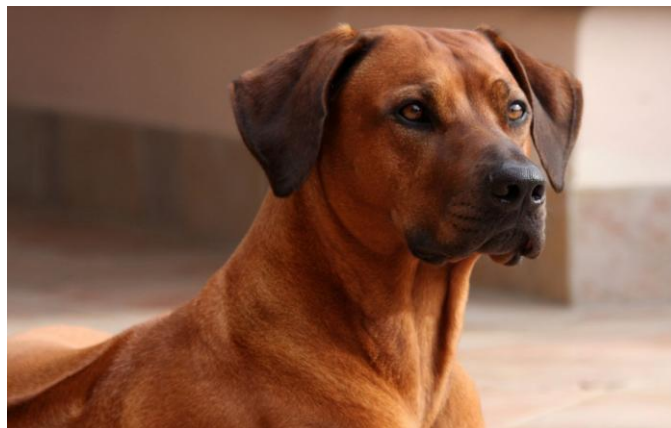
Slika 4. Izgled glave rodezijskog goniča (izvor: http://dog-breeds.findthebest.com/1/130/Rhodesian-Ridgeback )