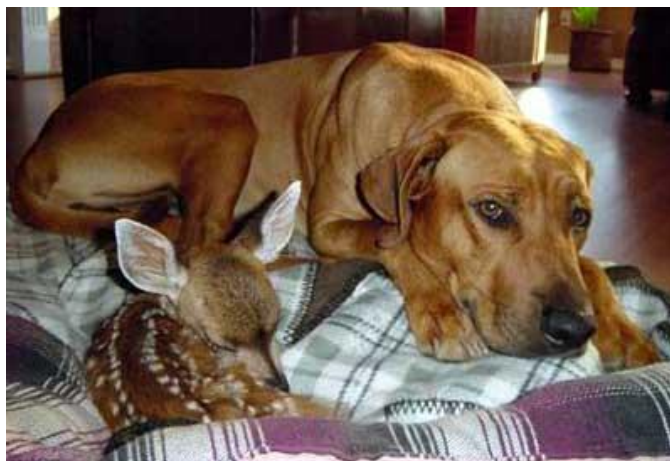
Slika 8. Rodezijski gonič i lane