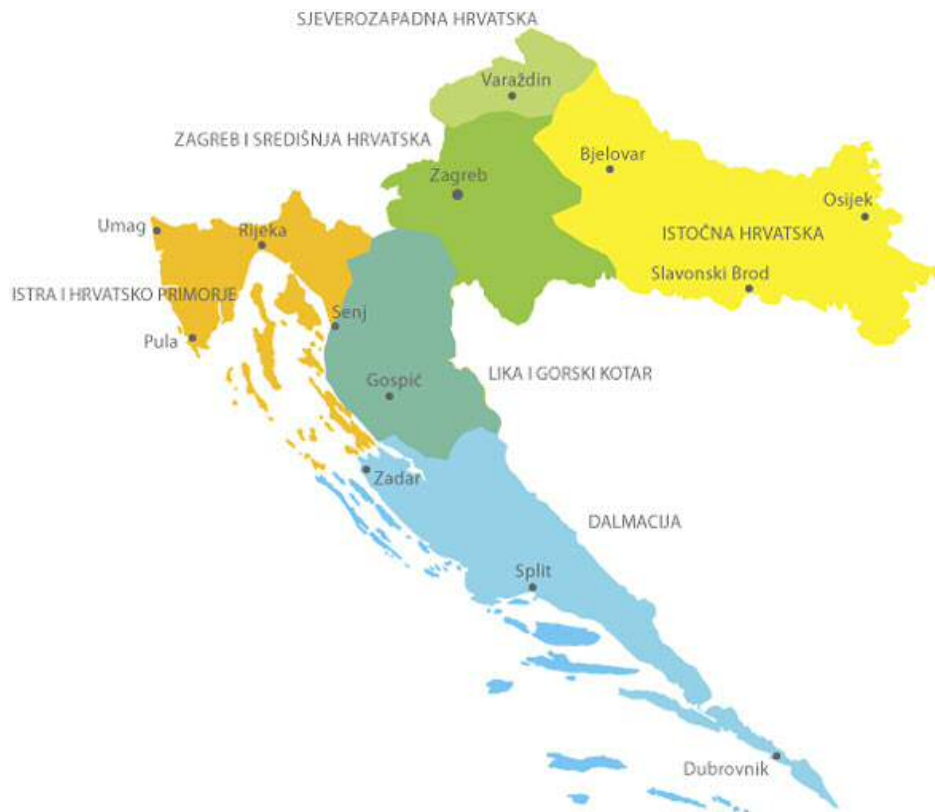
Slika 1. Regije Hrvatske.

U Slavoniji i Baranji, istočnom području Hrvatske, moguć je lov na jelena, srnjaka i divlje svinje, te na sitnu, dlakavu i pernatu divljač. Središnja Hrvatska dijeli jednake mogućnosti kao i istočna područja, dok je na području Like i Gorskog Kotara moguć lov medvjeda. Primorje i Dalmacija pružaju mogućnost lova na divokozu i muflona, te posebice sitnu pernatu divljači koja obitava na većim nadmorskim visinama, jarebica kamenjarka, griva i lještarka.