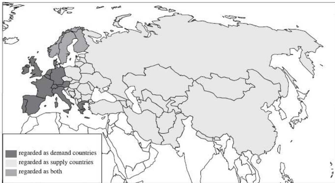
Slika 6. Geografski prikaz lovnih destinacija Europe i Azije.

Europsko okruženje (Slika 6.), za razliku od svjetskoga, je najkompleksnije, regulirano zakonima o lovstvu i ribarstvu. Lovstvo u Europi sadrži mnoge tradicionalne i autohtone elemente, te ih pretvara u raznolike običaje i sustave, koji su kombinacija tradicionalnog i novoga. Europa, sa 18 zemalja, predstavlja drugi po redu lovni blok u svijetu (nakon SAD-a), s gotovo 6,5 milijuna aktivnih i registriranih lovaca, što čini gotovo 2 % europskog stanovništva (slobodan prijevod, Johannes Bauer i Alexander Herr, Hunting and Fishing Tourism ). U zadnjih 20 godina potrebe lovaca su se izmijenile, lovni turizam poprima elitni karakter, pa tako Pinet (1995) procjenjuje da 30% europskih lovaca putuje u inozemstvo radi lova. Dugogodišnja promatranja pokazuju da njemački lovci preferiraju istočnu Europu, talijanski lovci ostaju u Europi ili odlaze u Južnu Ameriku ili na Kubu, španjolski lovci preferiraju Sjevernu Ameriku, a lovci država Beneluks putuju u Afriku, no većinom lovci turisti posjećuju destinacije koje su relativno neposredno blizu prebivališta. Sve veći broj lovaca traži iznimna iskustva u udaljenim i divljim dijelovima svijeta, gdje je zakonodavstvo liberalnije.