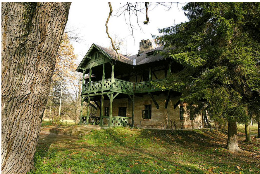
Slika 3. Lovački dvorac (ladanjska vila)