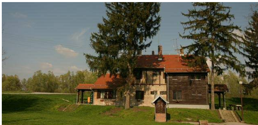
Slika 11. Lovački dom Monjoroš Zmajevac