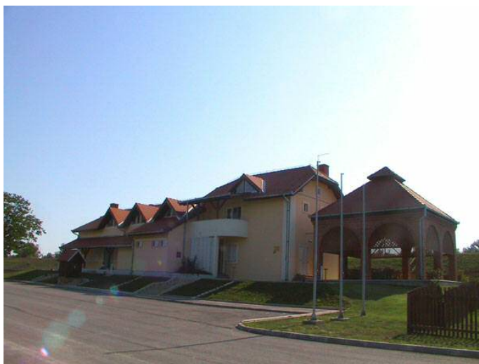
Slika 10. Lovački dom Zlatna greda

Lovački dom Zlatna greda, jedan od najljepših lovačkih domova u vlasništvu Hrvatskih šuma. Smješten je u Baranji uz sam dunavski nasip u Lovištu Podunavlje - Podravlje koje predstavlja jedno od najvažnijih europskih lovišta poznato po ritskim šumama uz Dravu i Dunav te po bogatstvu krupne divljači posebno jelena i divlje svinje te predstavlja biser hrvatske lovne ponude. Posebno je upečatljiva rika jelena u ritu, te skupni lov na divlje svinje. Udaljen je 3 km uskom asfaltnom cestom od Zlatne Grede u Baranji. Otvoren je 2000. godine i od tada njime uspješno gospodari Uprava šuma podružnica Osijek, šumarija Tikveš. Smještajni kapacitet čini 9 dvokrevetnih soba s ukupno 18 ležaja. U prizemlju doma nalazi se restoran s kapacitetom od 30 mjesta.