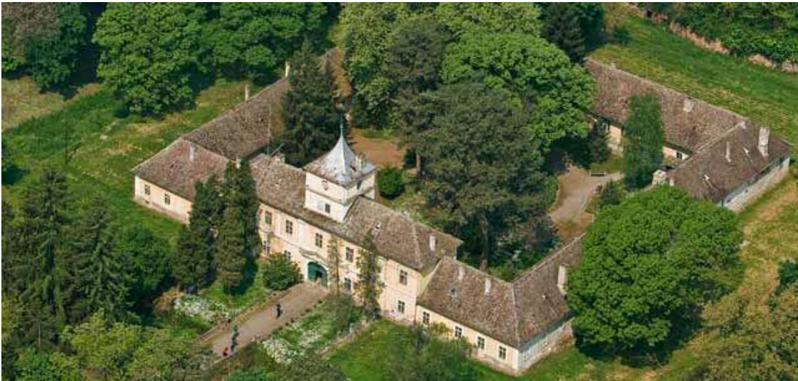
Slika 2. Lovački dvorac Eugena Savojskog u Bilju

Oslobađanje od Turaka počinje krajem 17. stoljeća, a u 18 stoljeću posjede dobivaju najuglednije srednjeeuropske plemenitaške obitelji. Podižu se plemićki dvorovi, a neki od njih (npr. lovački dvorac Eugena Savojskog u Bilju (Slika 2.) ili lovački dvorac, tzv. Jelengrad, obitelji Normann (Slika 3.) služe upravo u lovačke svrhe.