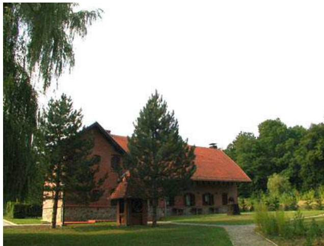
Slika 9. Lovački dom Kondrić.

Lovački dom Kondrić smješten je u blizini grada Đakova u lovištu Kujnjak, poznato po prekrasnim slavonskim šumama, plodnim poljima i ugodnoj klimi te bogatstvu krupne i sitne divljači. Luksuzno uređen prostor, okićen vrhunskim trofejima divljači, jamči dobar odmor nakon uspješnog lova. Ovaj lovački dom poznat je po dobroj slavonskoj kuhinji, te po ponudi visokokvalitetnih đakovačkih vina. Smještajni kapacitet čini 6 dvokrevetnih soba s kupaonicom, blagovaonica, dnevni boravak, TV.