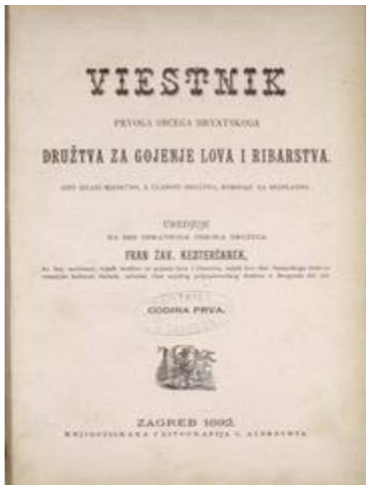
Slika 4. Lovački vjesnik.