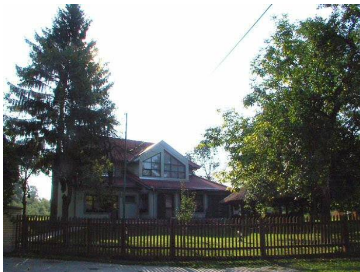
Slika 12. Lovački dom Čošak šume

Lovački dom "Čošak šume" smješten je na području Baranje, u lovištu Podunavlje - Podravlje koje predstavlja jedno od najvažnijih europskih lovišta poznato po ritskim šumama uz Dravu i Dunav te po bogatstvu krupne divljači posebno jelena i divlje svinje. Smještajni kapacitet čini 5 kreveta.