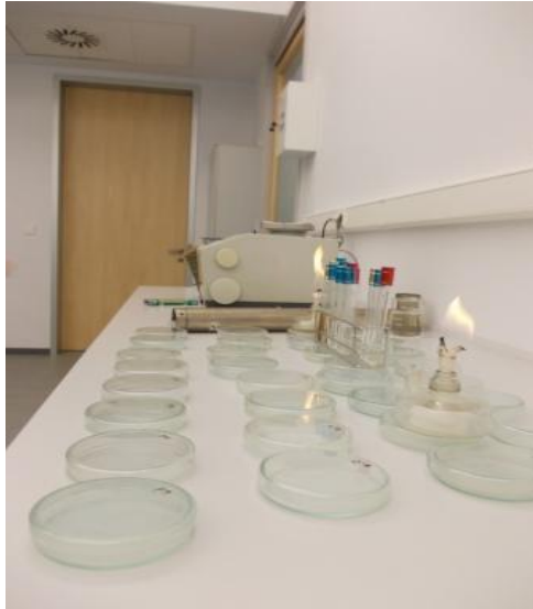
Slika 9. Zasijavanje hranjivih podloga