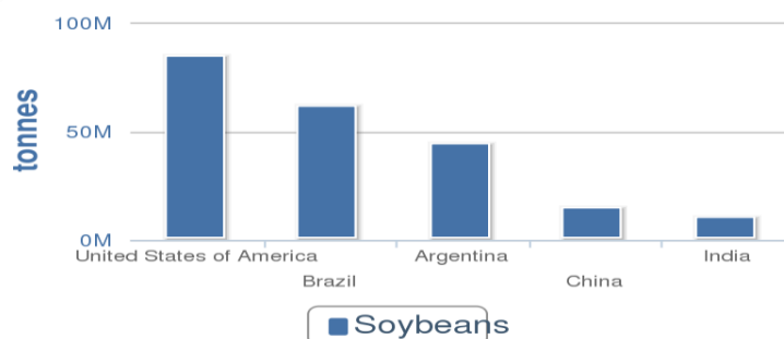
Graf 1. Pet najvećih svjetskih proizvođača soje ( http://faostat3.fao.org/home/index.html#VISUALIZE )

U Hrvatskoj se soja pojavila u razdoblju između 1876 i 1878. godine, a donio ju je austrijski biokemičar Friedrich Haberlant (Vratarić i Sudarić, 2008.). Iz toga razdoblja potječu i prva uputstva za proizvodnju soje u Hrvatskoj. Obimniji rad o širenju soje u Hrvatskoj proveo je Stjepan Čmelik (Vratarić i Sudarić, 2008.) koji je iz Kine nabavio novu kolekciju sorata soje. Kasnije su te sorte izvezene u Bugarsku i Rumunjsku gdje su korištene u križanjima radi dobivanja novih sorti. U par navrata dolazilo je do pokušaja značajnijeg povećanja proizvodnje soje u Hrvatskoj, ali su uglavnom završavali neuspješno. Početnom godinom stabilnije proizvodnje soje u zemlji može se smatrati 1987. godina. U razdoblju do 1997. došlo je do stabiliziranja površina pod sojom na oko 20000 ha, a najveće površine pod sojom u Hrvatskoj su u Slavoniji i Baranji. U posljednjih nekoliko godina površine soje u širokoj proizvodnji u Republici Hrvatskoj su stabilizirane u rasponu od 40 000 do 55 000 ha, s prosječnim urodom zrna od 2 500 do 3 000 kg/ha (Vratarić i Sudarić, 2008.). Prema Statističkom ljetopisu iz 2012. godine u Republici Hrvatskoj soja je uzgajana na 58 896 ha (2011.g), a prosječni prinos je iznosio 2,5 t/ha.