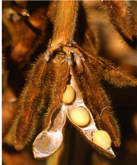
Slika 5. Mahuna soje ( http://www.jgi.doe.gov/News/lores_dried_soybean.jpg )

Prve mahune se formiraju oko 14 dana poslije pojave prvih cvjetova i poželjno je da se formiraju više na stabljici, jer su na taj način smanjeni gubitci prilikom žetve. U normalnim uvjetima razvoj mahuna traje oko tri tjedna. Maksimalan broj zrna po stabljici i mahuni je svojstvo uvjetovano uglavnom genetski, a stvarni broj i njegova veličina zavise od uvjeta u formiranje sjemena (Vratarić i Sudarić, 2000.).