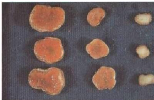
Slika 3. Presjek kvržica

Soja koristi dušik iz zraka preko bakterija koje žive na korijenu biljke u kvržicama (Slika 3.) i nazivaju se kvržične bakterije.