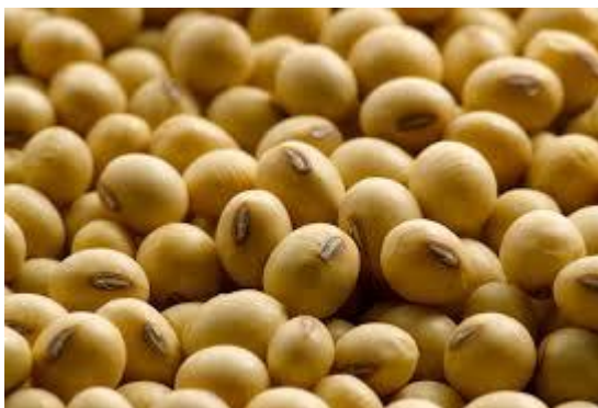
Slika 1. Zrno soje

Sjeme soje (Slika 1.) je različitog oblika, veličine i boje što ovisi o sorti i načinu uzgoja (Vratarić i Sudarić, 2008.). Masa tisuću zrna se kreće od 20 do 500 grama (Vratarić i Sudarić, 2008.). Sjeme može biti okruglog, ovalnog, jajastog oblika te na krajevima blago spljošteno, dok mu veličina i krupnoća ovisi o sorti i agroekološkim činiteljima. Sjeme je sastavljeno od embria koji je obavijen sjemenskom opnom. Embrio se sastoji od dva kotiledona, plumule s dva primarna listića koji zatvaraju primordij prvog lista, epikotila, hipokotila i korjenčića (Vratarić i Sudarić, 2000.).