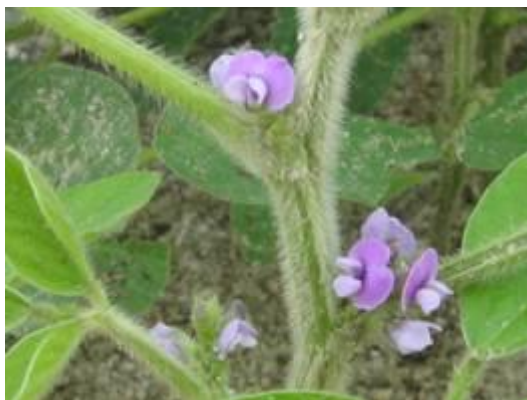
Slika 4. Cvijet soje

Kod determiniranog tipa rasta biljke soje narastu i procvjetaju u svim nodijima i terminalnoj racemi koja se neznatno proširuje (Vratarić i Sudarić, 2000.). Cvjetovi se nalaze u pazušcima gdje su skupljeni u racemoznu cvat sastavljenu od 3 do 15 cvjetova, a stabljika se završava s terminalnim cvatom (vrh stabljike) koji sadrži oko 35 cvjetova po čemu se i uočavaju razlike u tipovima rasta između determinirane i indeterminirane stabljike. Soja stvara više cvjetova nego što može razviti mahuna, pa je njihovo opadanje normalna pojava.