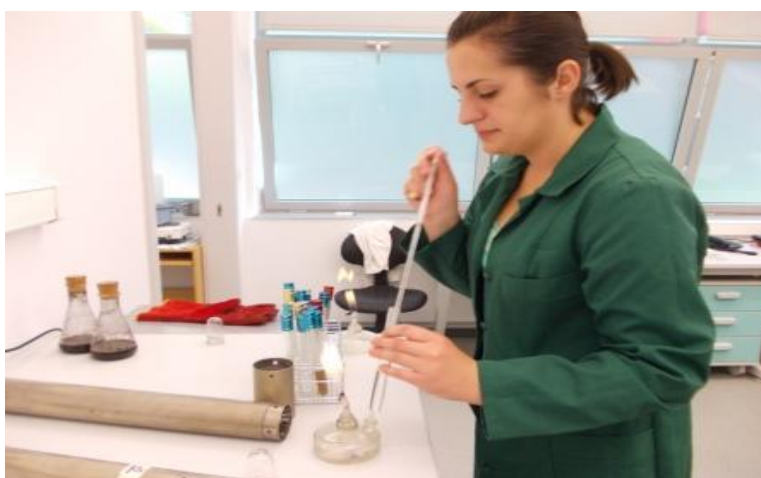
Slika 8. Pripravljnje uzoraka metodom razrjeđenja