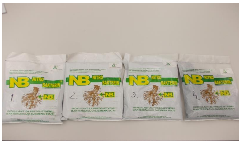
Slika 7. Ispitani uzorci

Ispitani uzorci pripravka za predsetvenu bakterizaciju sjemena soje trgovačkog naziva Nitrobakterin S su različitih datuma proizvodnje kako slijedi: 15.02, 01.03, 15.03 i 20.3.2013 godine (Slika 7.). Analiza kontrole kvalitete uzoraka obavljena je 04. lipnja i obuhvatila je pripremu uzoraka metodom razrjeđenja (do 10 9 ) u sterilnim uvjetima (Slika 8. i 9.). Metodom prelijevanja u tri ponavljanja izvršena je inokulacija uzoraka. Podloga korištena za rast B. japonicum je manitol-kvašćev agar. Inkubacija je provedena kroz sedam dana na 28°C. Nakon inkubacije prebrojane su specifične kolonije koje su okrugle, konveksne i poluprozirne. Broj bakterija je izražen kao CFUg -1 . Dodatno, morfološka identifikacija specifičnih kolonija je provjerena bojenjem po Gramu i mikroskopiranjem na mikroskopu Olympus BX41.