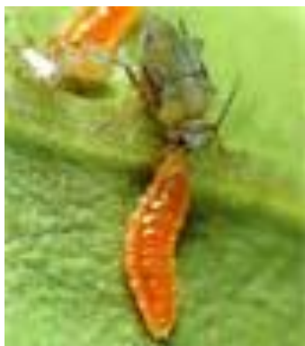
Slika 25. Parazitska osica

hodajući po listu. Parazitska osica Aphelinus abdominalis kao i vrsta Aphidius ervi parazitira vrste većih lisnih uši (mlječikina i krumpirova lisna uš).