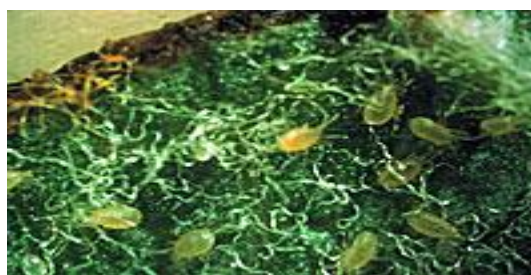
Slika 29. Kampimodromus aberrans