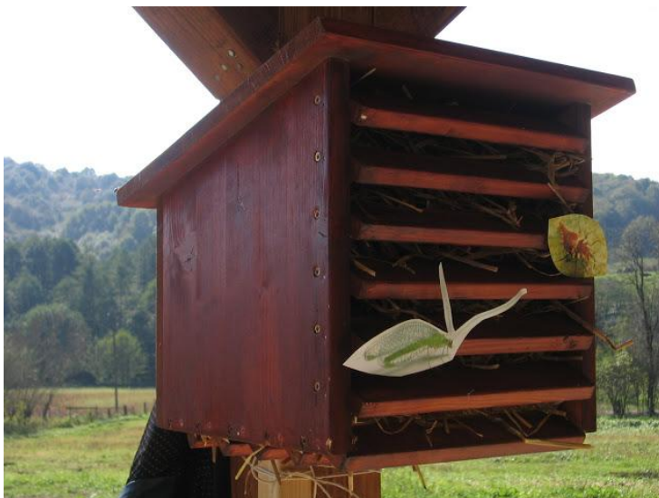
Slika 21. Kućica za zlatooke

Kućicu treba izgraditi od dasaka, oblika kocke s povišenom prednjom stranom. Unutrašnjost kućice treba ispuniti slamom: pšenicom, ječmom, sijenom ili pak suhim lišćem (slika 21.). Kućica se postavlja sredinom rujna uz rub livade ili neobrađenog zemljišta.