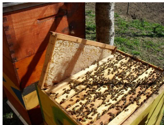
Slika 7. Košnica s pčelinjom zajednicom