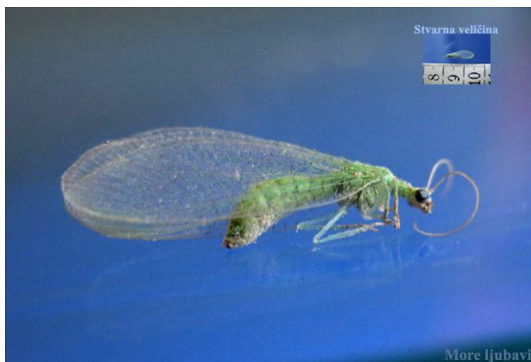
Slika 19. zlatooka ( Crysoperla carnea )

Prava je ljepotica među kukcima jer ima vitko, zeleno tijelo, dva para mrežastih krila, velike, zlatne, sjajne oči i duga ticala (slika 19,20.). Odrasle jedinke hrane se peludom, nektarom i mednom rosom. Ženka zlatooke polaže do 350 jaja, koja na dugim nosačima uvijek postavi na naličje lista, najčešće u blizini kolonije biljnih uši. Iz jaja se razvijaju ličinke, osobito korisne u vrtu jer se hrane biljnim ušima, jajima leptira i grinja, te štitastim ušima i resičarima. Ličinka se intenzivno hrani i jača tijekom dva tjedna svog razvoja te pojede između 200 do 500 biljnih uši, 500 jaja leptira ili 12 000 jaja grinja. Obitavaju u živicama, odakle polijeću u povrtanjak ili voćnjak. Privlači ih crvena boja pa tako treba obojati kućice koje ćemo postaviti.