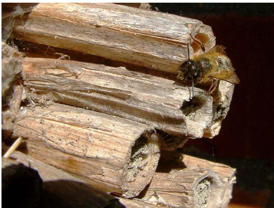
Slika 3. Solitarna pčela Osmia rufa ,