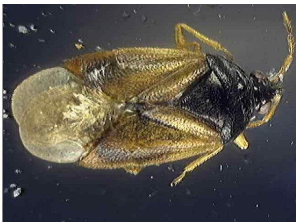
Slika 24. Orius minutus