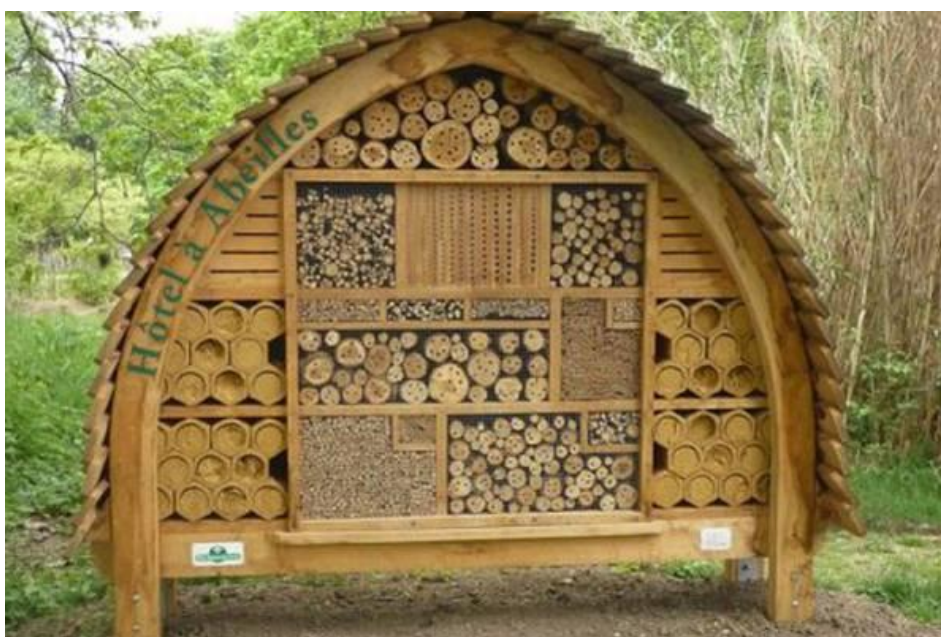
Slika 2. Stanište pogodno za život solitarnih pčela,