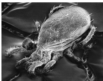
Slika 28. Typhlodromus pyri