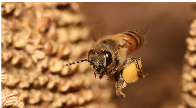
Slika 5. Pčela medarica ( Apis mellifera ),