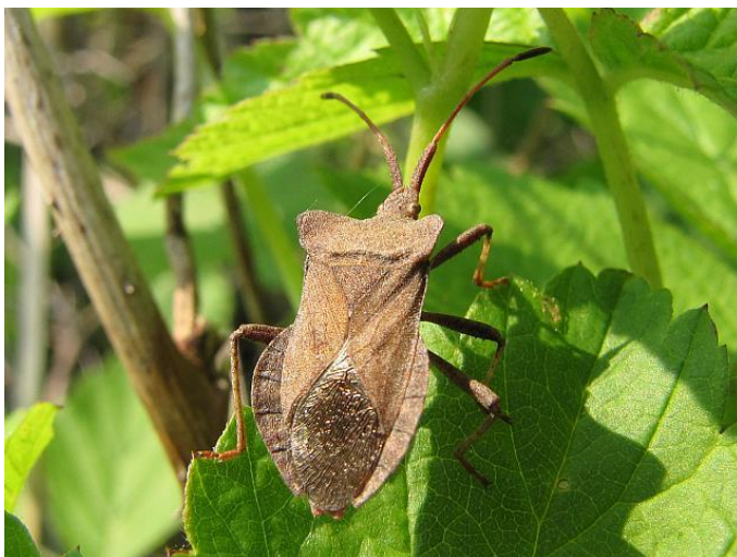
Slika 23. Grabežljiva stjenica, izvor : http://leptiri.net/