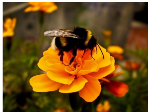
Slika 9. bumbar ( Bombus spp. ),