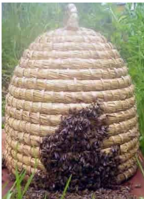
Slika 6. Pletena košnica