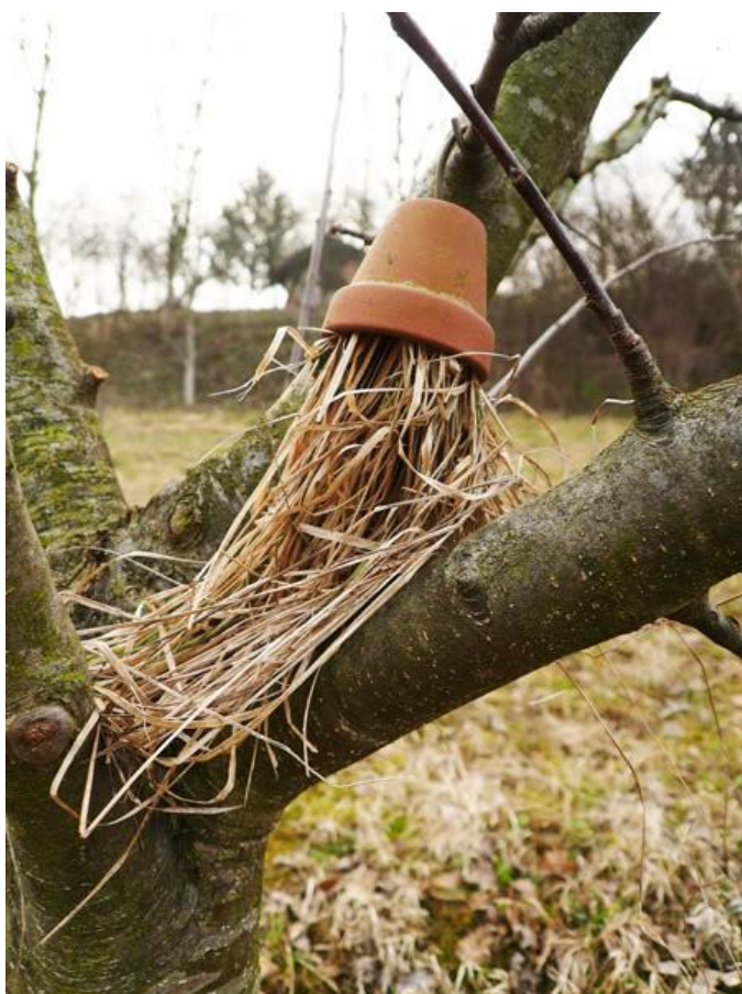
Slika 18. obrnuto postavljena glinena lončanica na grani