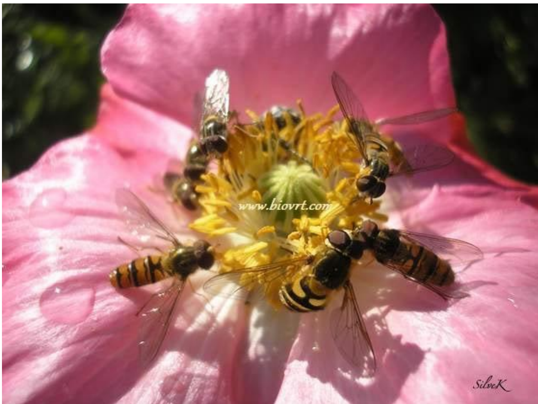
Slika 13. Episyrphus balteatus ,

Muhe cvjetare sreću se najčešće na cvijeću i cvijetnim livadama, gdje se hrane nektarom, cvijetnim prahom i mednom rosom. Imaju izduženo i zdepasto tijelo 3-25 mm, često prekrivene dlakama, uočljivih boja. Iako izgledom slične osama, letom oponašaju pčele, ose i druge vrste kukaca da bi se zaštitile od grabežljivaca. Let im je osobit. Pokretima krila lebde iznad cvijeta, poput leta u jednom mjestu. Nakon sparivanja ženka odlaže jaja pojedinačno na biljke, uvijek pored kolonije biljnih uši. Jaja su duguljasta, bijela, dužine 0,5-1 mm. Ličinke su grabežljivci bez nogu. Hrane se biljnim ušima koje nalaze na voćnim vrstama i cvijeću. Ličinke prvog stupnja su prozirne, a ličinke drugog i trećeg stupnja mijenjaju boju ( zelena, siva, crna) ovisno o vrsti biljnih uši kojom se hrane. Ovisno o vrsti, jedna ličinka muhe cvjetare isiše dnevno 40-150 biljnih uši, a tijekom svog razvoja 500. Među brojnim vrstama u nas su poznate : Episyrphus balteatus (slika 13.), Eupeodes (slika 15.) vrste ( susrećemo ih na cvjetovima voća, povrća i cvijeća) i Syrphus ribesii (slika 14.).