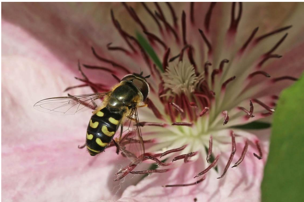
Slika 15. Eupeodes corollae