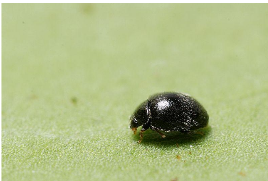
Slika 12. Stethorus punctillum ,