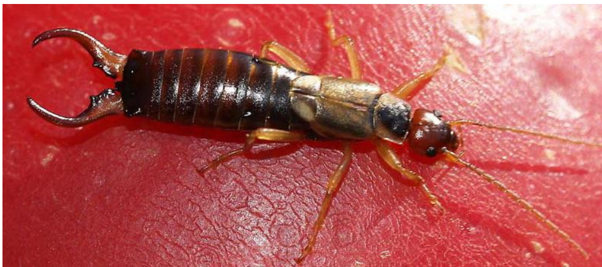
Slika 17. uholoža na jabuci