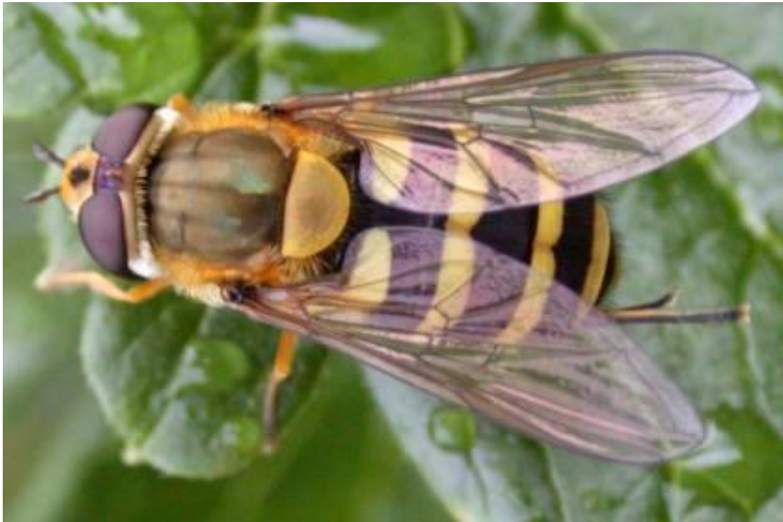
Slika 14. Syrphus ribesii