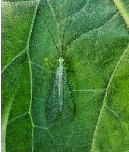
Slika 20. zlatooka ( Crysoperla carnea )