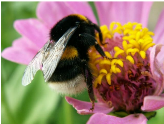
Slika 8. bumbar ( Bombus spp. ),

Bumbari spadaju u malobrojne kukce koji mogu kontrolirati vlastitu tjelesnu temperaturu, na način da tresu svoje letne mišiće proizvodeći toplinu, a njihovi čupavi kaputi, koji služe kao izolator im u tome svemu pomažu. Ova prilagodba omogućava im život u hladnijim podnebljima i na velikim visinama. Bumbari od cvijeta do cvijeta lete puno brže od pčela medarica, a lete čak i na niskim temperaturama ( < 12\text{ }^{\circ}\text{C} ), te rade za oblačna i kišna vremena. Bumbar je svojim krupnim tijelom na kojemu se nalaze guste duge dlačice, sposoban prenijeti vrlo velike količine peluda s cvijeta na cvijet (slika 8,9.). Za razliku od pčela medarica, bumbar nema naviku skupljati hranu samo s atraktivnih cvjetova, već skuplja hranu sa cvijeća bližeg svojoj košnici, a radilice bumbara u odnosu na pčele medarice ostaju puno duže vani tijekom skupljanja hrane. Pčele medarice, oprašuju samo u određenom dijelu godine, dok su kolonije bumbara uzgojene u kontroliranim uvjetima, dostupne za oprašivanje tijekom cijele godine. Kolonije bumbara ne ugrožavaju nametnici, što nije slučaj kod pčela (akarinoza i varinoza pčela), te ih nije potrebno tretirati kemijskim sredstvima.