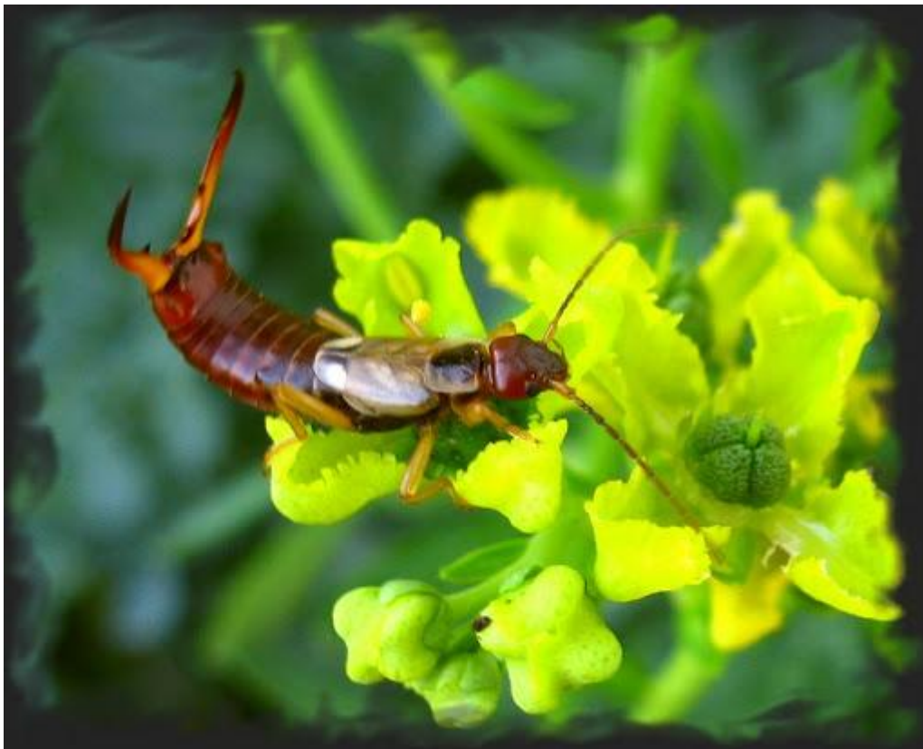
Slika 16. uholoža ( Forticula auricularia L.)

Uholoža (slika 16,17.) pripada redu kožaša ( Dermaptera ). Tijelo je malo i spljošteno i prilično izduženo, 10-16 mm, tamnosmeđe do crne boje, sa sjajnim hitinskim omotačem, koji sličí koži. Tijekom dana obitava u mračnim i vlažnim staništima u voćnjaku ili vrtu, te se rijetko može vidjeti, osim ako se ne potraži ispod kamenja, trule kor, lišća ili među otpacima. Aktivna je tijekom noći, kada se i hrani. Uholoža se često može naći na grožđu, plodovima jabuke, kruške, ali i u plodu breskve. Osim plodovima voća hrani se i nježnim dijelovima nekih biljaka, primjerice cvijeća i povrća. Smatraju je stoga štetnom. Ipak, hrani se i hranom životinjskog podrijetla : biljnim ušima, krvavim ušima, grinjama i jajima leptira te je zbog toga od osobite važnosti njezina prisutnost u voćnjaku i vrtu. Korisna je jer regulira brojnost štetnih kukaca. Budući da voli mračna i vlažna staništa, na stablo u vrtu ili voćnjaku možemo postaviti staništa u kojima će uholoža obitavati. To može biti : obrnuto postavljena glinena lončanica ispunjena suhim sijenom ili slamom, dio starog vatrogasnog crijeva duljine 30 cm, tkanina kružnog oblika u sredini svezana i obješena na granu. Staništa treba tako postaviti da donjim dijelom dodiruju granu voćke, radi lakšeg kretanja uholože (slika 18.).