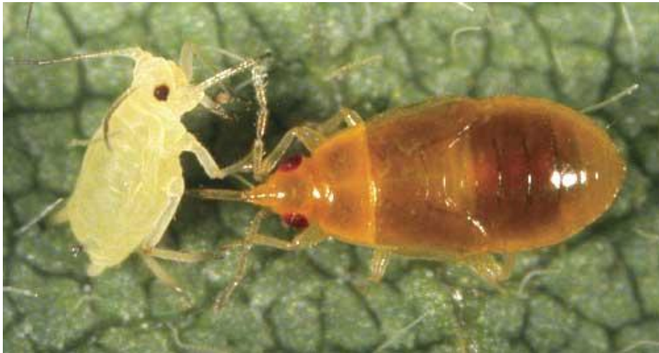
Slika 22. Grabežljiva stjenica, izvor : http://www.bius.hr/