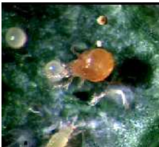
Slika 27. Grabežljive grinje ( Phytoseiulus persimilis )