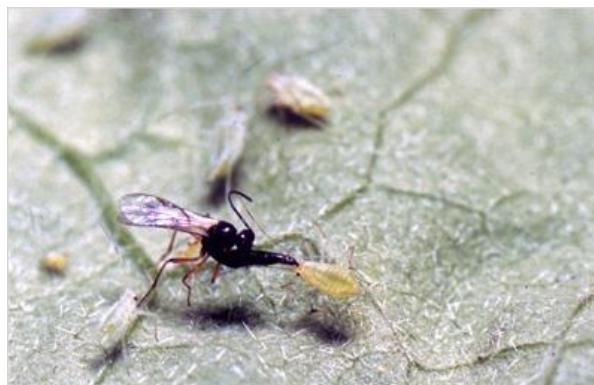
Slika 26. Osica Aphidius ervi napada lisnu uš