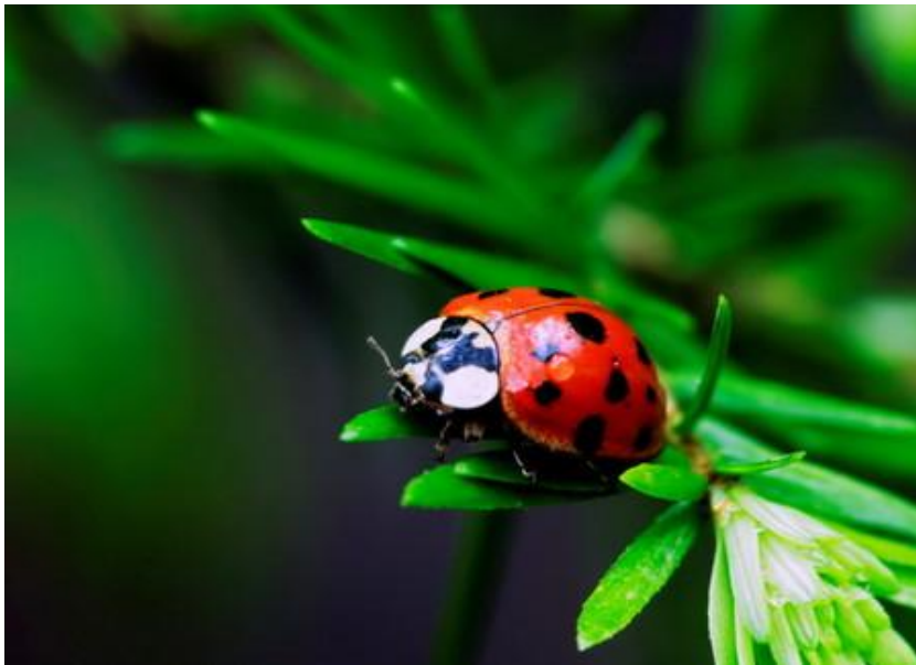
Slika 10. Božja ovčica ( Coccinellidae ),

Postoji još Stethorus punctillum (slika 12.) koja je crne boje, 1-1,5 mm i predator je crvenog pauka. Nalazimo je u intenzivnim voćnjacima, a u ekstenzivnim se gotovo i ne pojavljuje. Hrani se grinjama, preferira koprivinu grinju.