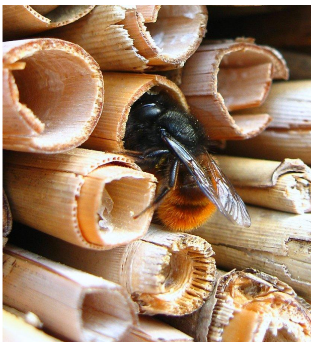
Slika 4. Osmia cornuta ,