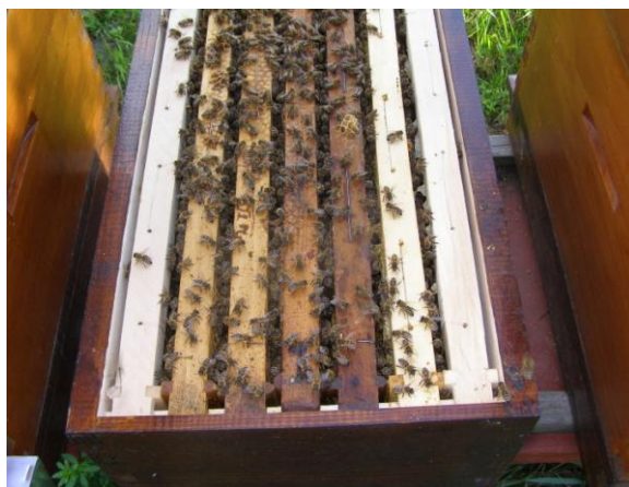
Slika 20. Nukleus

Zajednica od 60 000 pčela vrijedi više od četiri zajednice po 15 000 pčela.