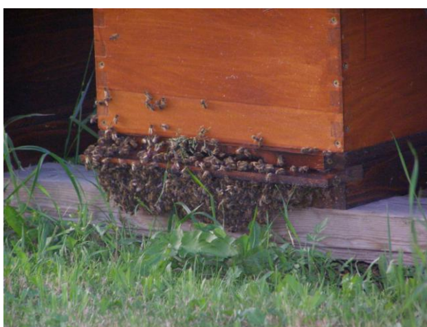
Slika 19. Brada na letu