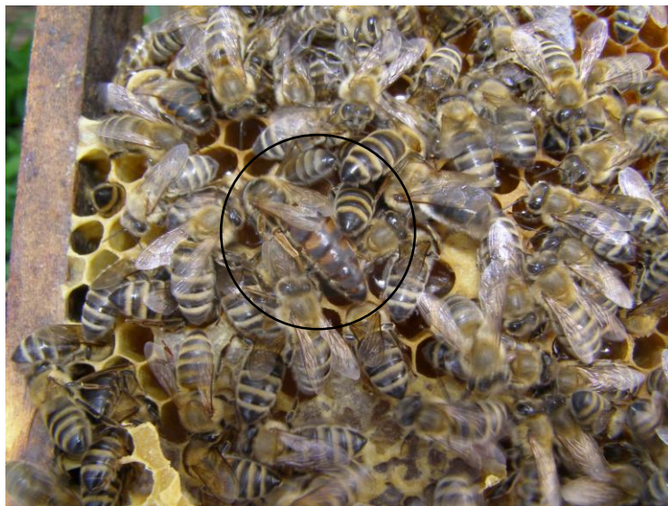
Slika 9. Matica

Dajte mi dobru maticu pa ću vam dati puno meda. (Doolittle, 19.st.)