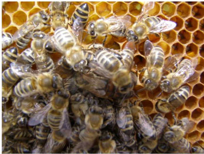
Slika 13. Pčele pratilje skrivaju maticu