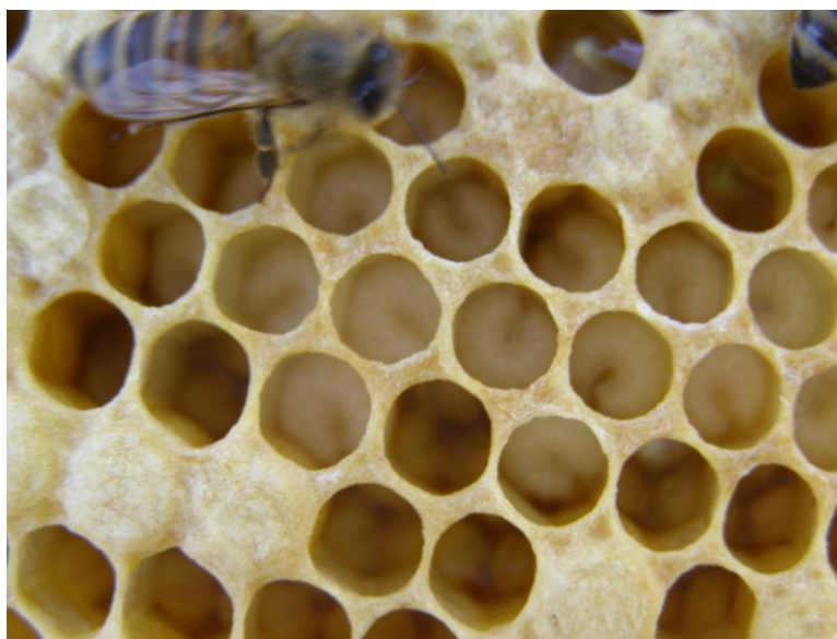
Slika 5. Poklapanje legla ličinki

Pčele radilice razvijaju se iz oplodjenog jaja. Razvoj oplodjenog jaja traje tri dana, a četvrtog dana razvije se ličinka. Prva tri dana mlade pčele ju hrane matičnom mliječi, a poslije peludom i medom. Desetog dana pčele pokriju ličinke poroznim voštanim poklopcem (stadij poklopljenog legla). Dvadeset i prvog dana gotova je metamorfoza i nova mlada pčela progriza porozni voštani poklopac i izlazi van iz stanice saća (Belčić, J. 1985.).