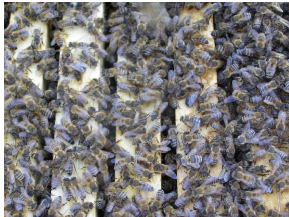
Slika 1. Pčelinja zajednica

Od pčela se može učiti redu i radu. Život pčele je vrlo dinamičan jer su uvjeti u kojima živi podložni stalnim promjenama. Životne pojave u svakom društvu odigravaju se na različit način. Tako i svaki član pčelinje zajednice ima određene dužnosti, a od njihovog izvršenja ovisi opstanak cjelokupne zajednice (Avram, Z. 1998.).