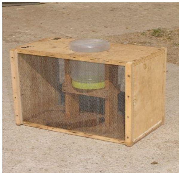
Slika 22. Transportna kutija sa hranilicom

varoa samo na odrasloj pčeli. Ostale pčelinje bolesti, koje se prenose leglom, skoro su isključene.