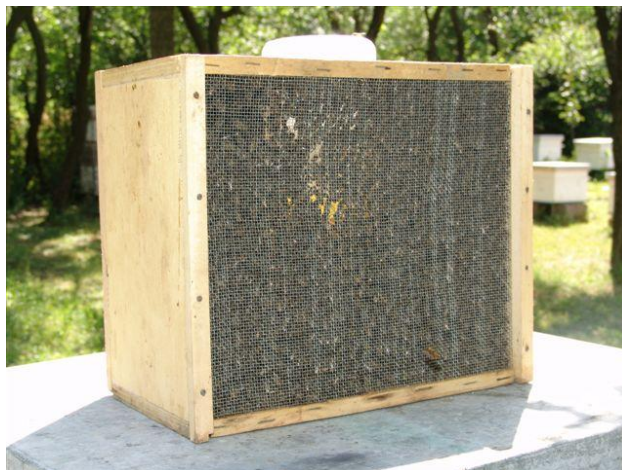
Slika 21. Paketni roj

Paketni roj čine oplodena matica u kavezu i oko 1.2 kg natrešenih pčela iz jedne ili više košnica u kutiju, tj. paket.