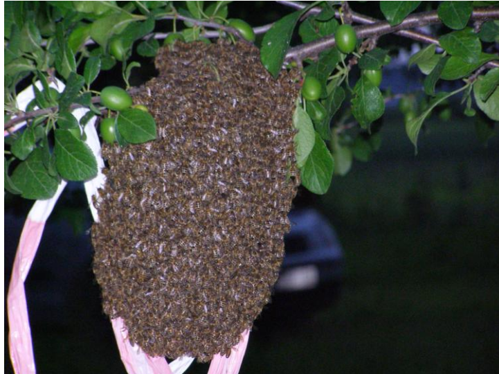
Slika 14. Roj na grani

znanstvene tehnike da bi se ta pojava svela na minimum i da bi zajednice održali što jače za glavne paše, a nakon paša umjetno razrojili i formirali nukleuse (Laktić, Z. 2008.).