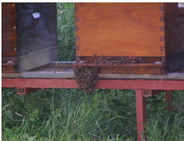
Slika 18. Brada na letu

Kao i sve u životu bolje je spriječiti nego liječiti. Mnogo je lakše sprječavati rojenje nego se s njim boriti kada ti procesi započnu (Laktić, Z. 1999.).