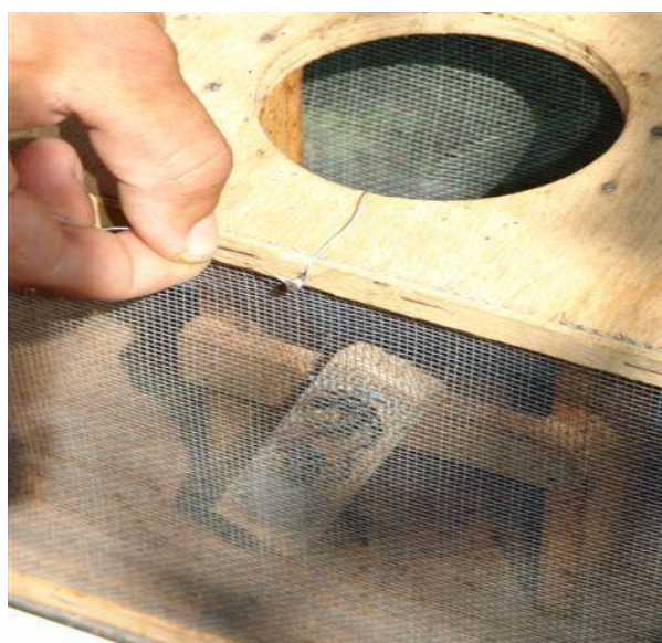
Slika 23. Postavljanje matice u kavezu u kutiju