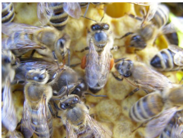
Slika 4. Pčela radilica sa peludi

Pčele radilice razvijaju se iz oplodjenog jaja. Razvoj oplodjenog jaja traje tri dana, a četvrtog dana razvije se ličinka. Prva tri dana mlade pčele ju hrane matičnom mliječi, a poslije peludom i medom. Desetog dana pčele pokriju ličinke poroznim voštanim poklopcem (stadij poklopljenog legla). Dvadeset i prvog dana gotova je metamorfoza i nova mlada pčela progriza porozni voštani poklopac i izlazi van iz stanice saća (Belčić, J. 1985.).