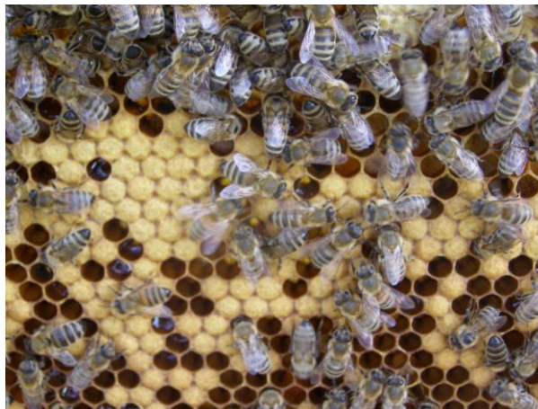
Slika 3. Zatvoreno leglo i radilice

Radilice su najbrojniji članovi pčelinje zajednice i broj im varira od nekoliko tisuća do nekoliko desetaka tisuća. Dugačke su 12 do 13 mm, a teške 0.1 gram, tako da u jednom kilogramu pčela ima oko 10 000 pčela.