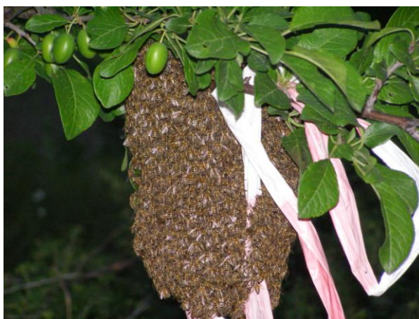
Slika 15. Roj na grani