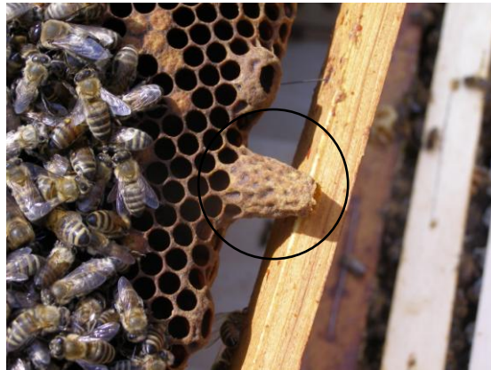
Slika 10. Matičnjak

Matice uzgojene iz prisilnih matičnjaka su najslabije i manje plodne, stoga ih prvom prilikom trebamo zamijeniti.