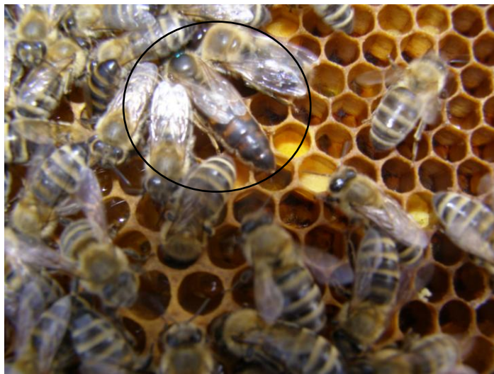
Slika 12. Matica

Matica ima veliki značaj i ulogu u jakoj pčelinjoj zajednici.