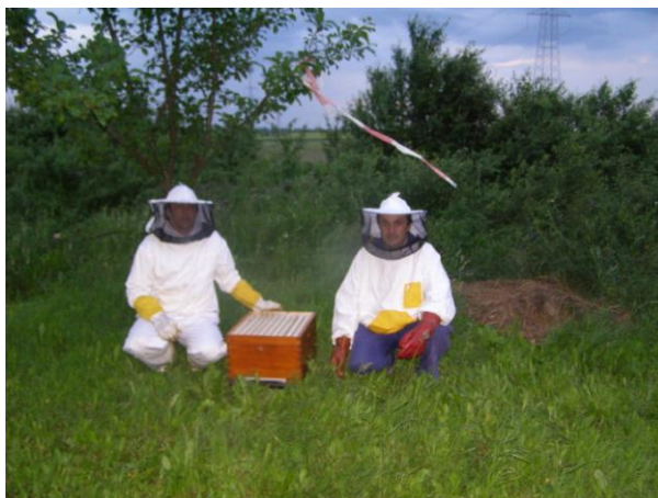
Slika 16. Uhvaćeni roj smješten u košnicu