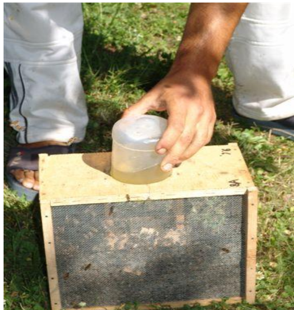
Slika 25. Stavljanje hranilice