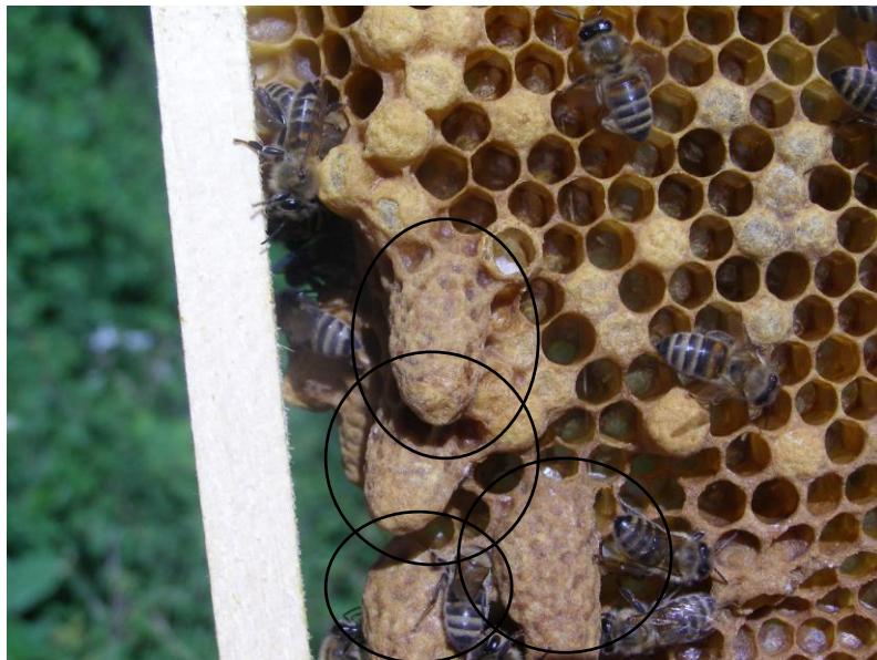
Slika 11. Matičnjaci