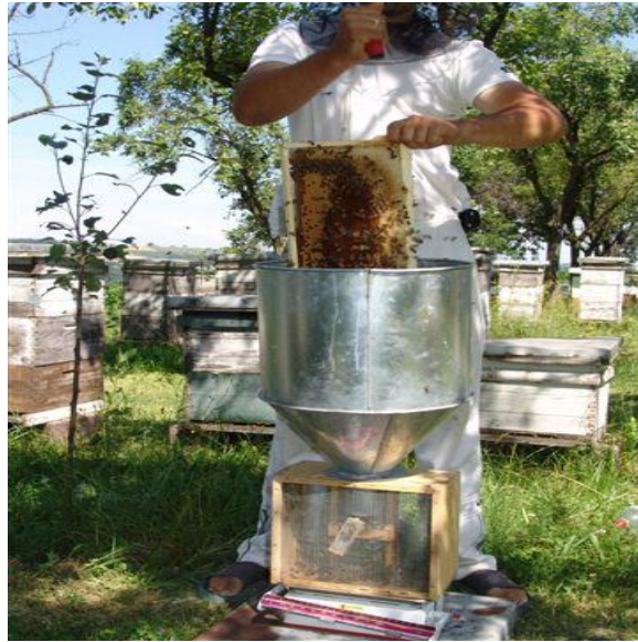
Slika 24. Stresanje pčela u kutiju i vaganje