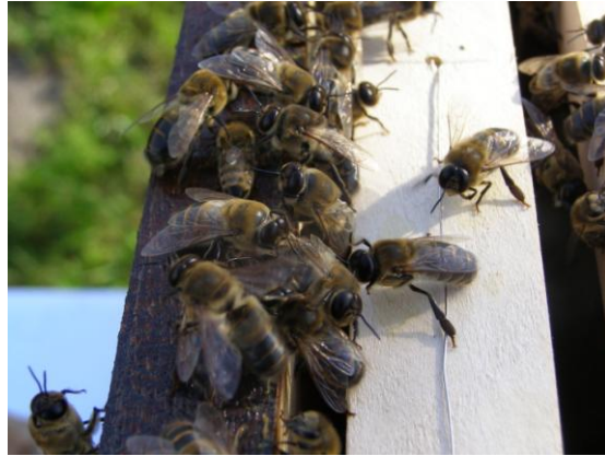
Slika 7. Trutovi

Korist od trutova je višestruka. Nekada se vjerovalo da trutovi u zajednici samo troše hranu i da nemaju poseban značaj u košnici. Danas se zna da trutovi svojom prisutnošću potiču pčele radilice na sakupljanje više meda, griju leglo u prvim danima svog života i na taj način omogućuju pčeli radilici da se bavi sakupljanjem nektara, pomažu u ventiliranju košnice. Njihova najvažnija funkcija je u genetskoj raznolikosti i onemogućavanju sparivanja u srodstvu (Todorović, V. 1988.).