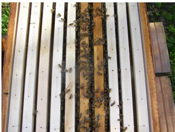
Slika 17. Formirani nukleus od roja sa grane

Kada se roj smjesti na neku od obližnjih grana, potrebno je uzeti košnicu u koju će se smjestiti roj i staviti ju ispod roja, potom treba dobro zatresti granu da roj padne u košnicu i košnicu ostaviti na mjestu na kojem je da se sve pčele smire. Ako je mjesto nepovoljno za stresanje pčela u košnicu, onda se uzme pletara pa se s njom prebaci roj do košnice. Dobro je u košnicu staviti jedan okvir zatvorenog legla da ga pčele odmah počnu grijati i ujedno nam je to garancija da nam roj neće otići. U košnicu nije preporučljivo odmah staviti okvire s izgrađenim saćem jer mlade pčele imaju potrebu za izvlačenjem satnih osnova pa to treba iskoristiti. Kada se roj smiri i počne dobro popunjavati okvire u plodištu, potrebno mu je dodati jedan medni nastavak i roj prihranjivati svaki drugi dan sa 1-2 litre šećernog sirupa pošto novonastali