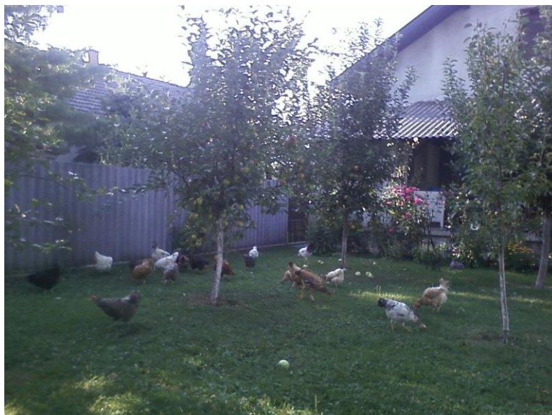
Slika 5. Pilići na travnatim ispustima u hladu (Biter, 2011.)

Životinje se moraju hraniti ekološki proizvedenom hranom s vlastitog gospodarstva ili onom kupljenom od druge ekološke proizvodne jedinice (N.N. 139/10). U slučaju da gospodarstvo ne može osigurati dostatne količine proizvedene hrane tada se može dozvoliti nabava konvencionalne hrane, ali najviše do 20% godišnjih potreba (Pavičić i sur., 2005.). Krmne smjese za piliće treba sastavljati od različitih dopuštenih krmiva biljnog, životinjskog i mineralog podrijetla. Osnovni dio obroka čine žitarice (kukuruz, pšenica, ječam i zob). Niti jedna žitarica nije dovoljna s obzirom na njihov kemijski sastav i potrebe životinja pa treba kombinirati više njih. Kukuruz je u smjesama najviše zastupljen sa 50-70% i predstavlja osnovno energetska krmivo (Domaćinović, 2006.). Pšenica je manje bogata energijom a daje se u smjesama do 20%. Ječam i zob imaju dosta vlakana koje perad slabo probavlja te ih maksimalno dodajemo do 10% u smjese za piliće.