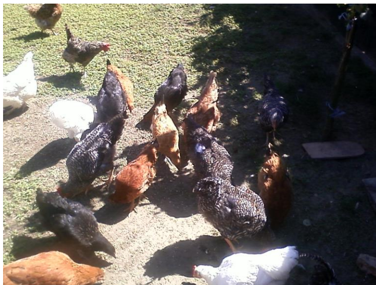
Slika 1. Slobodan uzgoj kokoši (Biter, 2011.)

hladno im je, pa je potrebno jače zagrijavati prostoriju. Ako su pilići na periferiji kruga, dahću i šire krila, onda im je pretoplo, pa grijanje valja smanjiti. (Vučemilo, 1993.).