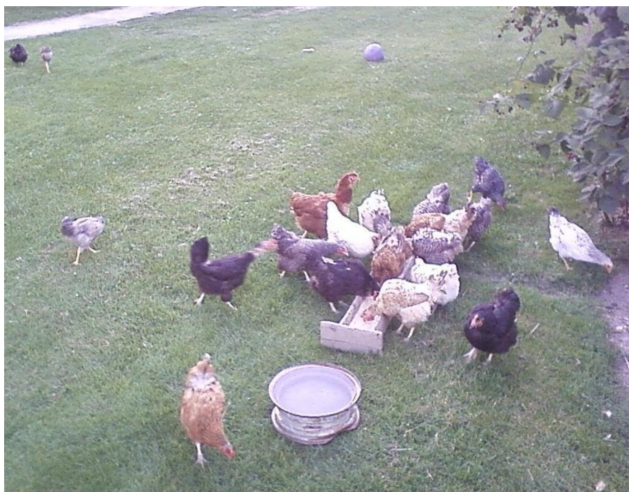
Slika 7. Hranilica s krmnom smjesom i posuda s vodom na ispustu (Biter, 2011.)

Pilići zahtijevaju minimalne količine masti u hrani kako bi osigurali unos esencijalnih masnih kiselina (linolnu i linolensku) u organizam. Normiranje smijese kod tova pilića uključuje praćenje energetske i hranjive vrijednosti, kao i biološko-djelatnih tvari. (Domaćinović, 1999.).