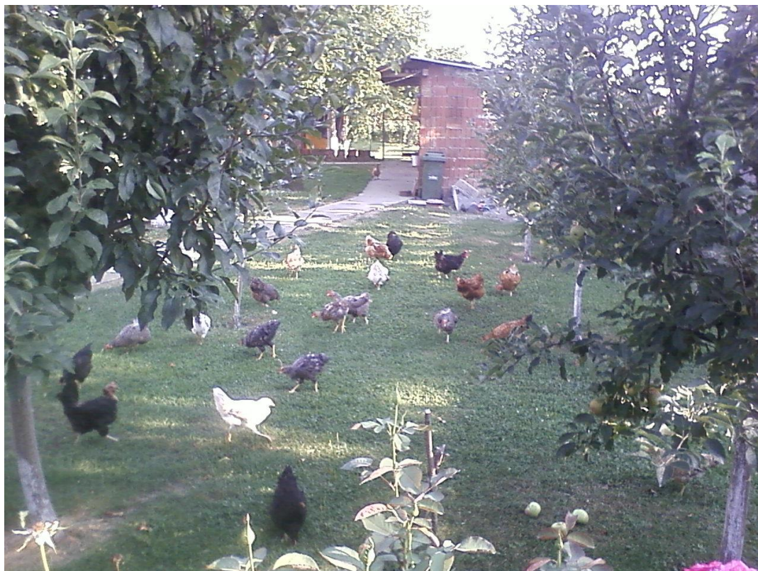
Slika 9. Slobodni uzgoj pilića na zatravljenim ispuštima i prirodnim hladom (Biter, 2011.)

Prema zakonu o ekološkoj proizvodnji životinjskih proizvoda, pilićima se mora omogućiti izlaz na otvorene površine kad god to vrijeme dopušta. Otvorene površine trebaju većim dijelom biti prekrivene vegetacijom, a perad mora imati nesmetan pristup hranilicama i pojilicama (N. N. 12/01.).