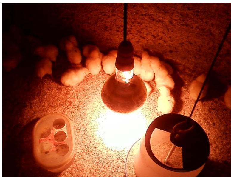
Slika 2. Topla faza uzgoja (Biter, 2011.)

Temperatura ispod umjetne kvočke mjeri se pomoću koljenastog toplomjera, a regulira se podizanjem i spuštanjem žarulje („umjetne kvočke“). Za hranjenje se koriste manji valovčići ili posude, te okrugle ili pravokutne limene plitice. Pojilice mogu biti različitog oblika, te moraju osigurati pristup vodi i neprestano uzimanje, a da se pri tome pilići ne smoče. Dobre su se pokazale plastične posude izrezane na rubovima s tanjurićem.