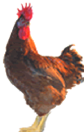
Slika 4. SASSO T44 (crveni)