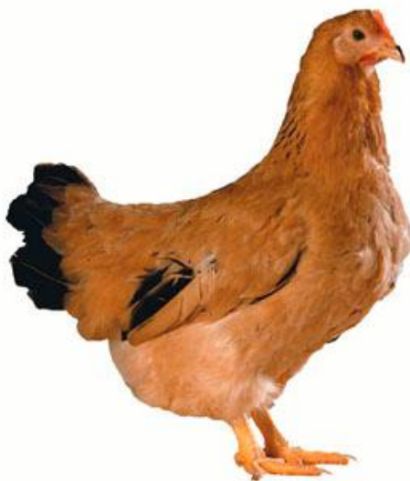
Slika 6. COBB SASSO 150 TM.

genetski odgovara slobodnom načinu uzgoja. Maksimalni prosječni prirast iznosi do 45 grama po danu. Trup je uniformnog izgleda, a meso sočnog okusa (The Poultry Site, 2011).