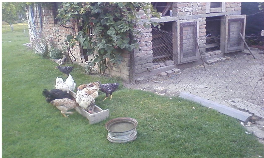
Slika 8. Peradarnjak u slobodnom uzgoju (Biter, 2011.)

U provedenom istraživanju Janječića i Mužica (2003.) cjelokupni prostor zagrijavan je s 12 infra-crvenih žarulja jačine 250W te peći na drva. Relativna vlažnost zraka u objektu bila je 60%, a izmjena zraka je obavljena korištenjem prirodne ventilacije (otvaranjem prozora kada je to bilo potrebno). Kao stelja na betonski pod stavljena je suha blanjevina debljine 10 cm. Pilići su ograđeni perforiranom žičanom mrežom. Temperatura u zoni boravka pilića postupno je snižavana podešavanjem visine žarulja.