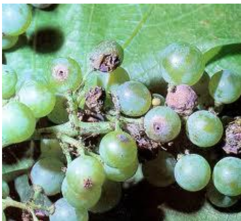
Slika 2. Štete od pepeljastog groždanog moljca

Ako naiđe period kiše, stalne vlage i svježine, oštećena zrna trule, napada ih plijesan, a naročito siva plijesan i cjelokupna berba može biti za kratko vrijeme uništena. Odrasle gusjenice u jesen traže bolje zaklone, pretvaraju se u svojim čahuricama u kukuljice i iduće godine daju leptire, a često već jedan dio ljetnih gusjenica odlazi na zimovanje. Gusjenice ovog leptira mogu izazvati direktne i indirektne štete. Naime, iz položenih jaja izlaze gusjenice koje zapredaju cvijet i oštećuju ga. Osim cvjetova, oštećuju peteljkovinu i bobice vinove loze. Međutim, opasne su i indirektne štete koje se ogledaju u pojavi sive plijesni na grozdovima koji su oštećeni moljcem. Jedna ženka odloži od 40 do 60 a najviše 120 jaja dok gusjenica tijekom svog razvoja može oštetiti oko 50-tak bobica. Ipak, smatra se da će znatniju štetu na vinovoj lozi izazvati populacija groždanih moljaca ako se ulovi 75 leptirića kumulativno po postavljenom feromonskom mamcu. Ali, pošto navedeni moljac ima velike zahtjeve prema toplini za određivanje optimalnog roka tretiranja nužno je voditi računa i o sumi srednjih dnevnih temperatura koje se računaju od vremena ulova potrebnog broja leptira. S praktičnog gledišta, praćenjem dinamike ulova leptira signalizira se optimalan rok suzbijanja, a što je obično 5-10 dana nakon najvećeg (potrebnog) ulova leptira.