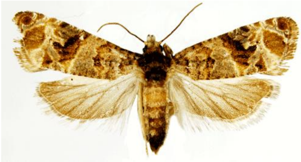
Slika 1. Pepeljasti groždani moljac