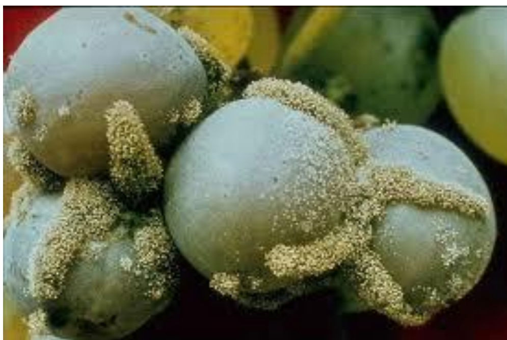
Slika 7. Siva plijesan vinove loze

na 6,5 milijuna trsova u međimurskom vinogorju godišnje košta oko 100.000 eura (Šubić et al., 2003). Unatoč praćenju populacije moljaca pomoću ferotrapova i određivanju stvarne potrebe suzbijanja, mnogi manji međimurski vinogradari su krajem 1990-ih godina još uvijek “za svaki slučaj” koristili jeftinije insekticide iz skupine sintetskih piretroida 6-7 puta tijekom sezone. Mnoge su razvijene zemlje posljednjih dvadesetak godina uvođenjem metode konfuzije ili zbunjivanja značajno smanjile potrošnju insekticida u vinogradima, npr. Švicarska, Italija, Njemačka. Prva domaća pozitivna iskustva primjene ove metode u suzbijanju grožđanih moljaca su dobivena upravo u Međimurskom vinogorju tijekom razdoblja 1998.-2001. godine (Ciglar i sur., 2002; Šubić i sur., 2003), ali zbog nemogućnosti nabave dispenzora na hrvatskom tržištu model konfuzije kod nas nije proširen u praktičnom suzbijanju grožđanih moljaca. Budući da u zemljama EU integrirano vinogradarstvo postaje imperativ uspješne i poticane proizvodnje, višegodišnjim pokusima suzbijanja grožđanih moljaca u međimurskom vinogorju istražuje se djelotvornost novijih i ekološki prihvatljivijih djelatnih tvari, kao i kritične brojeve za određivanje stvarne potrebe njihove primjene u vinogradima prema OILBu.