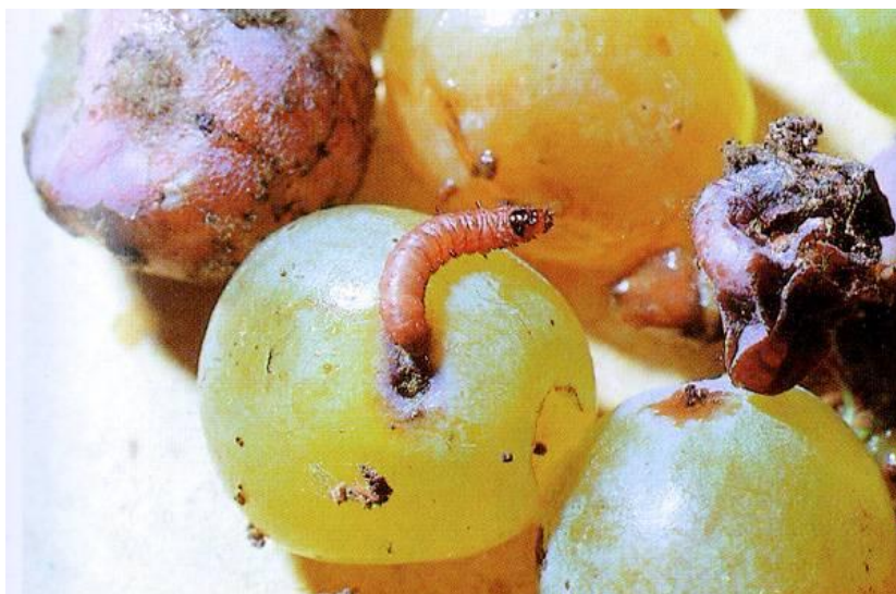
Slika 3. Žuti groždani moljac

Žuti groždani moljac je leptir veličine oko 7 mm, a rasponom krila mjeri oko 15 mm. Glava i grudi su žute. Prednja krila su žuta ili narančasto-žućkasta, sa dobro definiranim (izraženim) tankim slojem vezivnog tkiva. Na krilima se vidi jasno omeđena, široka, tamna poprečna pruga. Zadnja krila su tamnosiva, trbuh siv. Mužjaci i ženke ne pokazuju spolni dimorfizam, iako su ženke malo veće od mužjaka. Mužjacima nedostaje kod prednjeg para krila kostalni (rebreni) preklop. Odrasli se često zamjene za druge vrste Eupoecilia ili European Cochylini , iako E. ambiguella je jedina kohilida uobičajno povezana sa grožđem. Genetička disekcija se može upotrijebiti za potvrđivanje identiteta žutog groždanog moljca.