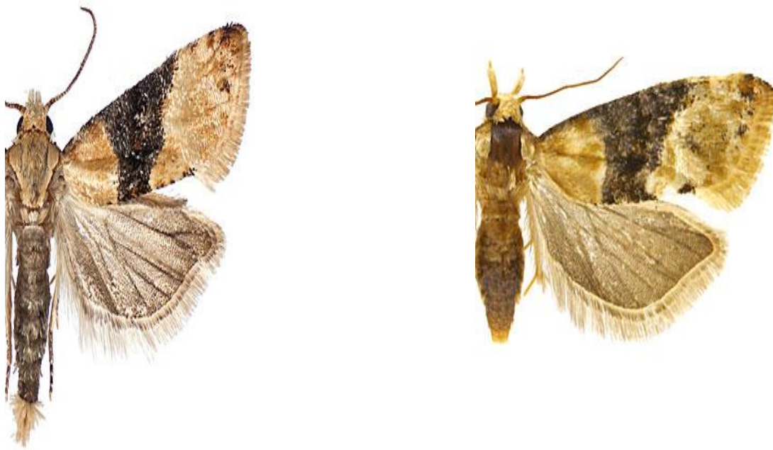
Slika 4. Žuti groždani moljac (muški i ženski)