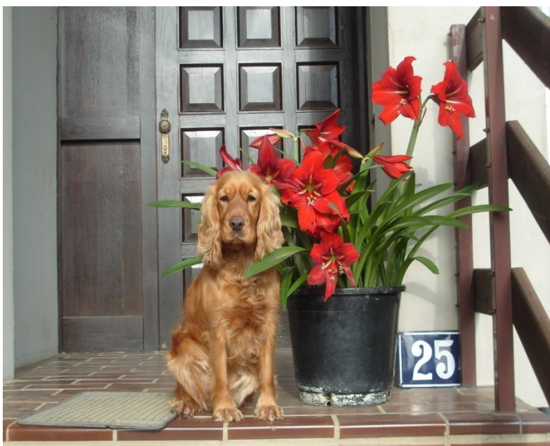
Slika 3. Engleski koker španijel (crvena boja)