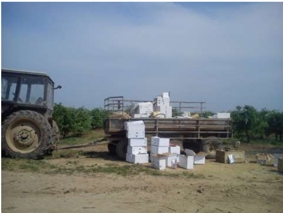
Slika 5. Doprema sredstava do mjesta obavljanja zaštite