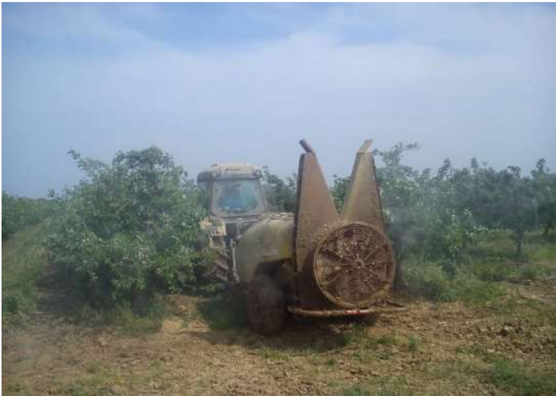
Slika 6. i 7. Izvođenje zaštite atomizerima