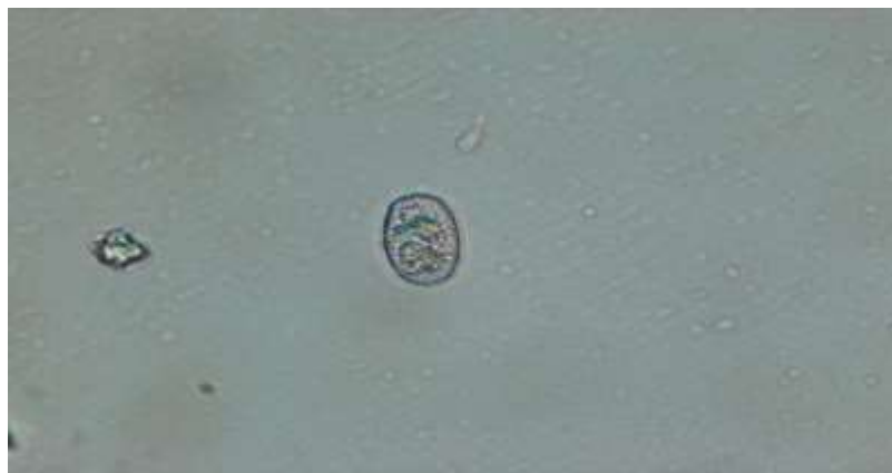
Slika 9. Oidija pepelnice ( Draganić )

Uz pomoć mikroskopa smo utvrdili pojavu oidija (Slika 9.). Bolest se javila na mladom nasadu jabuke sorte Idared, a radi daljnjeg sprječavanja širenja bolesti obavilo se tretiranje fungicidom.