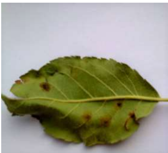
Slika 10. Krastavost na listu

U nasadima smo pronašli listove sa karakteristični simptomima (pojava maslinastih pjega na naličju lista) (slika 10.). Simptomi su također utvrđeni i na plodovima (slika11.).