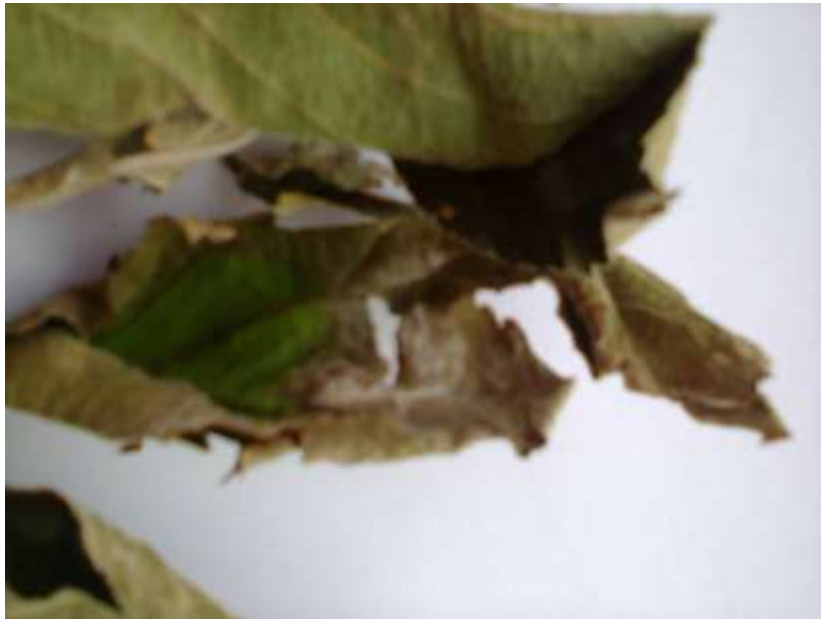
Slika 8. Pepelnica

Pepeljasta prevlaka na listu upućivala je na pojavu pepelnice (Slika 8.).