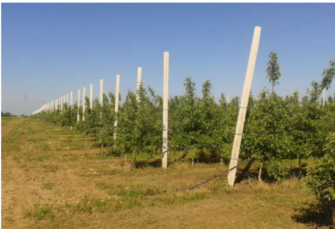
Slika 1. Nasad jabuke u Borincima

Vrlo povoljni klimatski, reljefni i pedološki uvjeti omogućuju da se voće, a posebno jabuke proizvode u većini područja Hrvatske. Jabuka je voćna vrsta koja se s pravom kiti laskavim nazivom „kraljice voća“. Plodovi jabuke imaju prednost nad ostalim vrstama voća zato što pored velike hranjive i vitaminske vrijednosti mogu duže vrijeme čuvati u svježem stanju. Plodovi jabuke dozrijevaju od ljeta pa sve do zime. Od kontinentalnih voćaka jabuka je po količinskoj proizvodnji plodova na prvom mjestu. Stranooplodna je voćka te je potrebno posaditi više sorata istodobne cvatnje i dobre međusobne sposobnosti oplodnje. Ona je temelj voćarske proizvodnje.