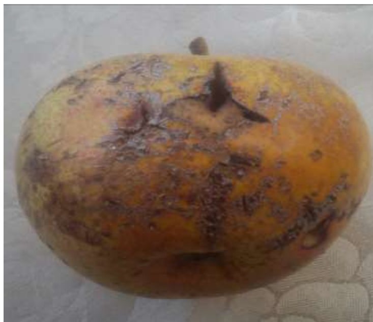
Slika 2. Krastavost na plodu

Uzročnik bolesti u ovom slučaju gljiva prenosi se u drugu vegetaciju pomoću zaraženog lišća koje opada naročito u jesen. Gljiva prezimljuje na dva načina: prvo, na jako zaraženim stablima kao micelij ili u obliku konidija na kori, između ljuski pupa, u udubljenjima na kori grančica. Optimalna temperatura za klijanje konidija je 16°C uz relativnu vlažnost zraka od 90%. Drugi način prezimljavanja je taj da gljiva prelazi u zimski stadij peritecija s askusima u kojima se nalazi 8 askospora, to je saprofitska faza u razvoju ovog uzročnika. Askusi s askosporama javljaju se u proljeće nakon spolnog razvoja, a vratovi plodišta su na licu lista u ožujku i travnju. Najpovoljnija temperatura za stvaranje askusa je 4°C. Za daljnji razvoj ove bolesti potrebno je kišovito vrijeme. Ukoliko nema dovoljno kiše ni dozreli peritecij neće izbaciti askopore. Po tome zaključujemo da se jak razvoj parazita treba očekivati u godinama s čestim kišama u travnju i svibnju uz relativno toplo vrijeme. Za primarnu infekciju lista najpovoljnija je temperatura 2-22°C ; kap vode na listu od 9 do 50 sati. Jačina infekcije i brzina inkubacije ovisi o duljini vlaženja lista i temperaturi.