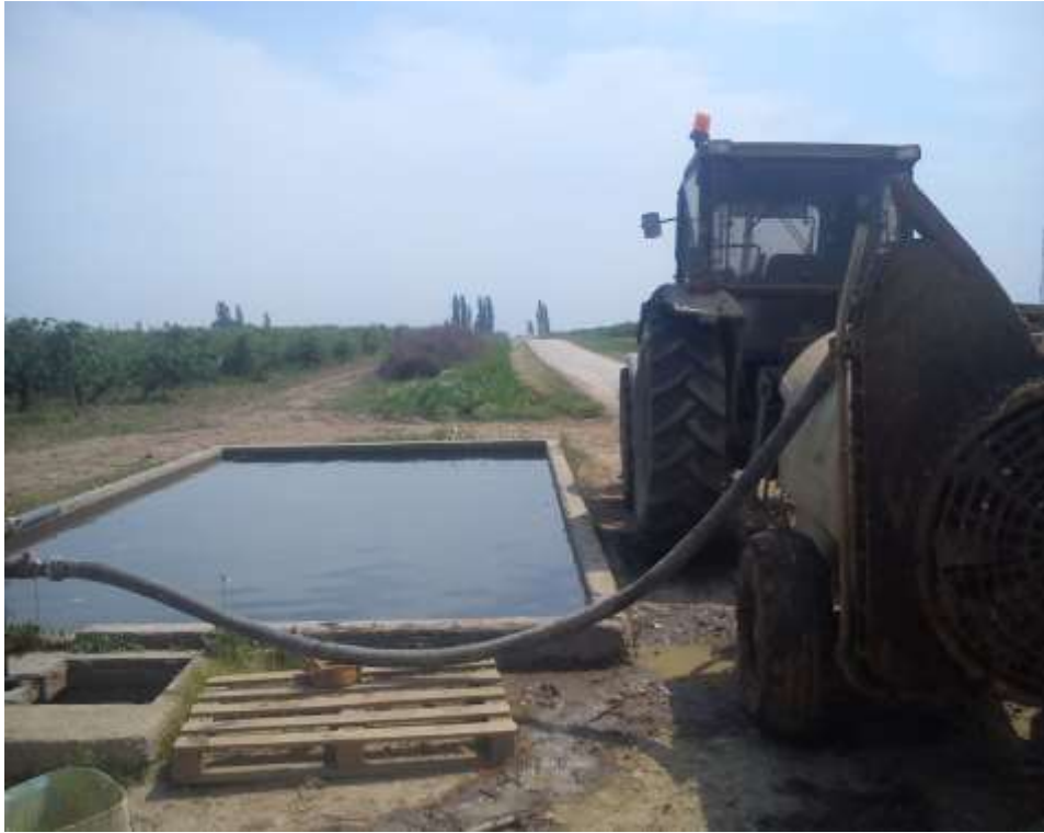
Slika 4. Punjenje atomizera iz bazena