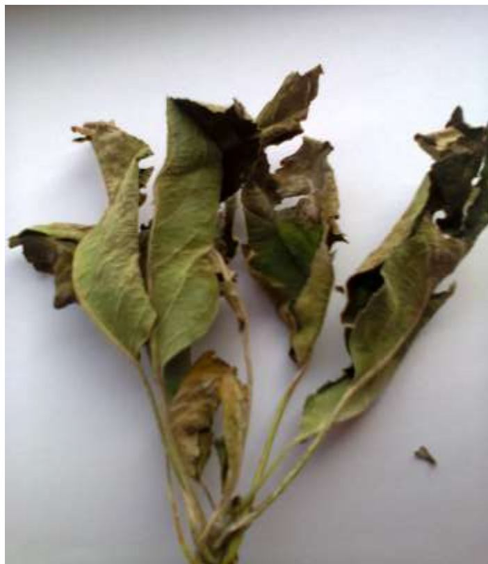
Slika 3. Pepelnica na listu

Za klijanje konidija nije potrebna kap vode na organu biljke. Infekcija je moguća u rasponu temperatura 4-32°C, ali optimum je po danu oko 20°C. Vrijeme inkubacije 6-7 dana pri 22°C, a pri 12°C 9-10 dana. Jak vjetar i jaka insolacija zaustavljaju zarazu, kao i temperatura iznad 33°.