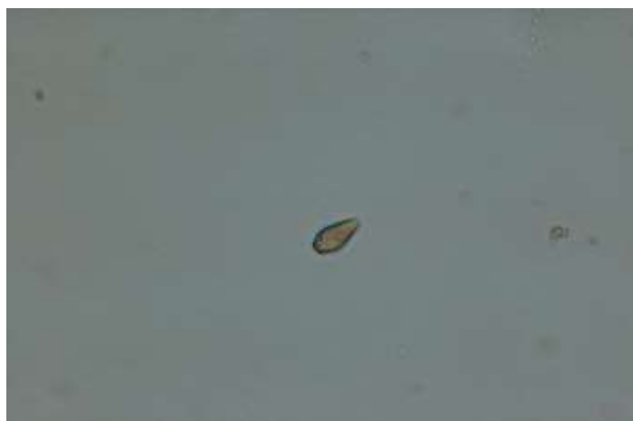
Slika 12. Konidije Venturie (Draganić)

Pregledom mikroskopom otkrili smo konidije Venturie te smo sa sigurnošću moglo reći da se u voćnjaku bolest pojavila (Slika 12.).