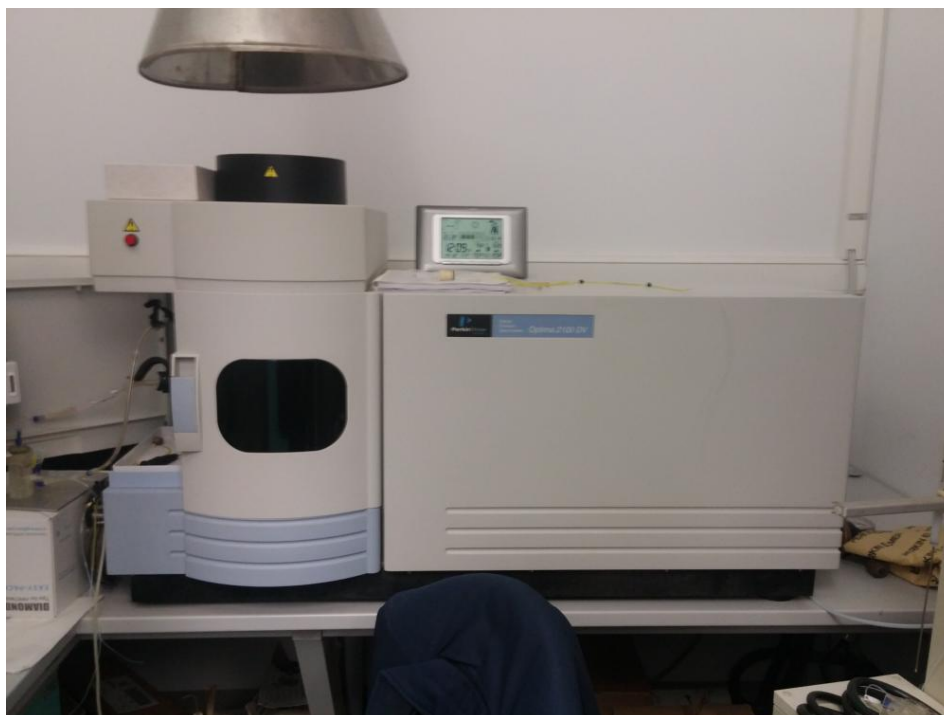
Slika 4. Optima 2100 DV

Očitavanje rezultata koncentracije Fe u zrnju obavljeno je WinLab 32 ICP Continuous - Manual Analysis Control programom povezanom s gore navedenim ICP - OES uređajem.