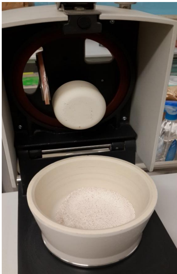
Slika 2. Dobiveni uzorak brašna

Prije samoga mjerenja koncentracije metala zrno pšenice je očišćeno od pljevica i mljeveno u brašno u mlinu Retsch RM200 (slika 2). Svaki uzorak mljeven je 8 minuta.