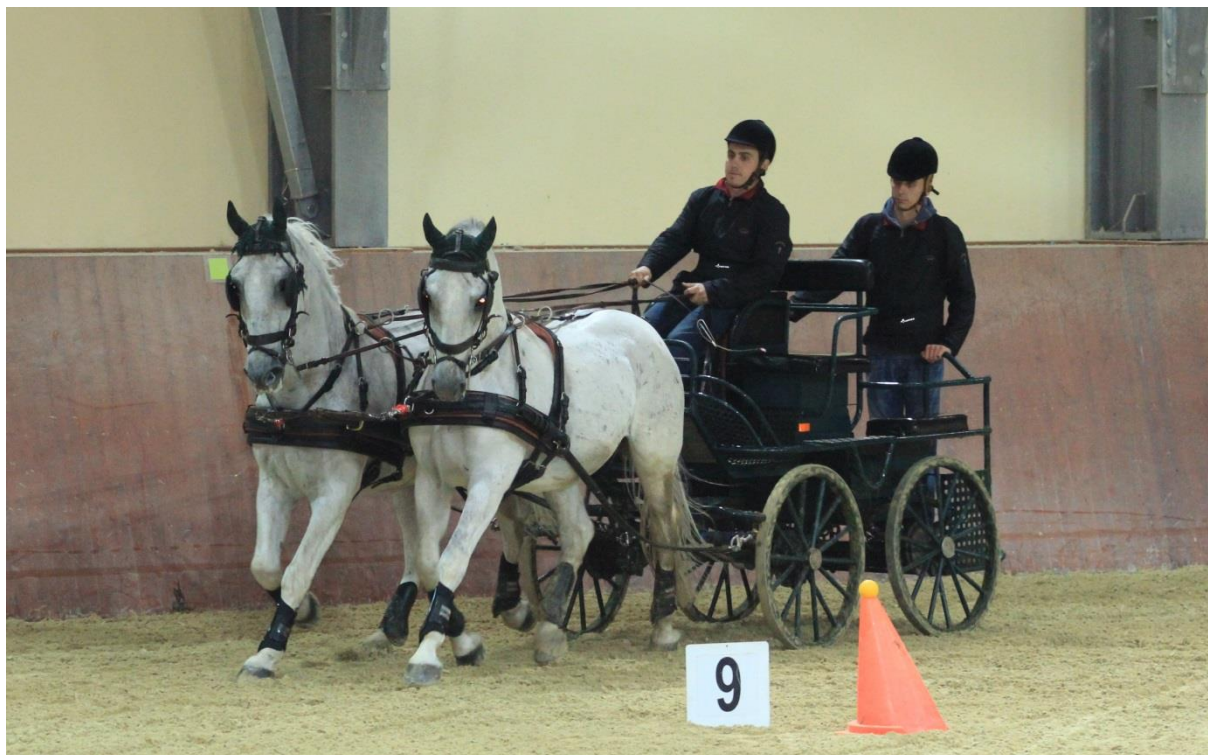
Slika 3. Pravilna hranidba je od iznimne važnosti za konje koji se koriste u trodnevnim zaprežnim natjecanjima

anaerobne glikolize je stvaranje mliječne kiseline i brzo se razvija umor kako dolazi do padanja pH vrijednosti u mišićima. Kao primjer brzina kojom se kreću konji tijekom endurance natjecanja je unutar raspona aerobne proizvodnje ATP-a. Tijekom početka utrke, kraja utrke i penjanja na uzbrdice kod konja nastupa anaerobna proizvodnja ATP-a (Duren, 1995.).