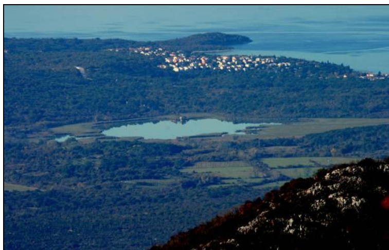
Slika 9: Pogled na otok Krk iz Fužina - lovište VIII/101 Krk