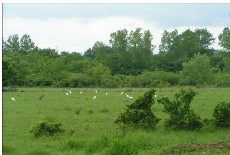
Slika 8: Pogled na centralni dio otoka Krka, «Omišljanski lug» - lovište VIII/101 Krk