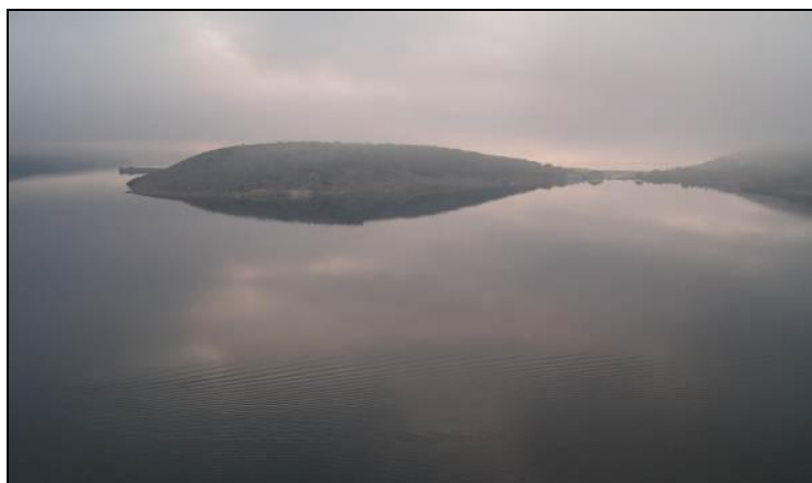
Slika 7: Pogled na sj. istočni dio otoka Krka - lovište VIII/101 Krk