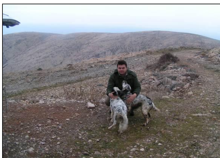
Slika 17: Pogled na jugozapadni dio otoka Krka- lovište VIII/17 Punat