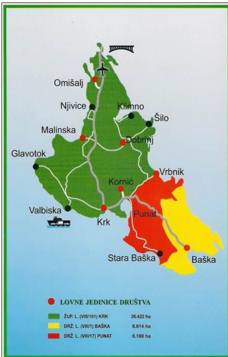
Slika 6: Karta otoka Krka s podijelom na lovišta i oznakom lovnih jedinica