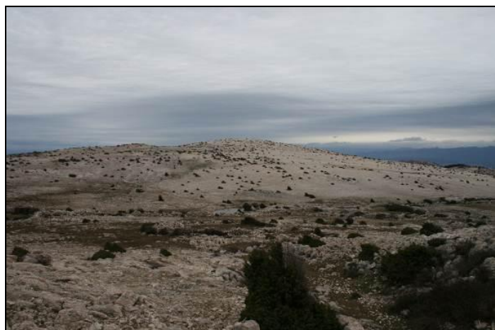
Slika 16: Najviši vrh otoka Krka Obzova (568m.n.m.)-VIII/17 Punat