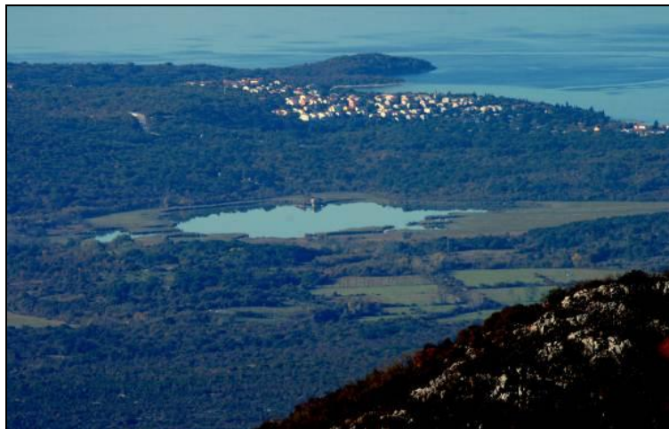
Slika 9: Pogled na otok Krk iz Fužina - lovište VIII/101 Krk