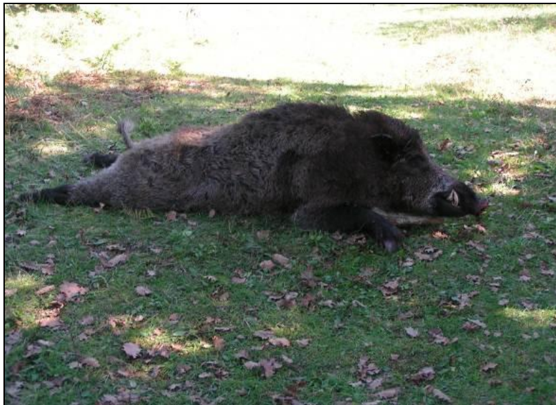
Slika 19: Vepar sa zlatnim trofejom; odstreljen u lovištu VIII/101 Krk 18. studenog 2007., lovac Mauro Mičetić, ocijenjen sa 124,15 točaka

Veoma je atraktivna lovna divljač. Zauzima veliki postotak odstreljene krupne divljači u Republici Hrvatskoj. U pravilu lov se dijeli na pojedinačni i skupni lov. Pojedinačni lov je najčešći način lova. Vršiti se na način dočekivanja divljači s lovačkih čeka ili zasjeda koji se nalaze najčešće u blizini poljoprivrednih kultura pred zriobom. Pojedinačnim načinom lova često se lovi šuljanjem, pretraživanjem uz pomoć psa ili slučajnim susretom. Skupni lov je specifičan i zanimljiv zbog više razloga. Divlja svinja je jedina vrsta krupne divljači u Hrvatskoj koja se smije loviti u skupnom lovu uz upotrebu pasa i upotrebom oružja sa glatkim cijevima. Najčešći je za vrijeme zimskih mjeseci i spada u jedan od najatraktivnijih lovova pružajući potpuni lovni užitek (GRUBEŠIĆ, 2004.) .