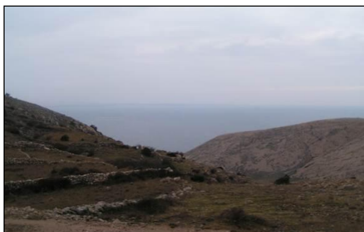
Slika 18: Pogled na jugozapadni dio otoka Krka- lovište VIII/17 Punat