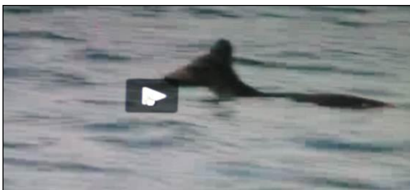
Slika 4: Srna u moru pliva s kopna na otok Krk