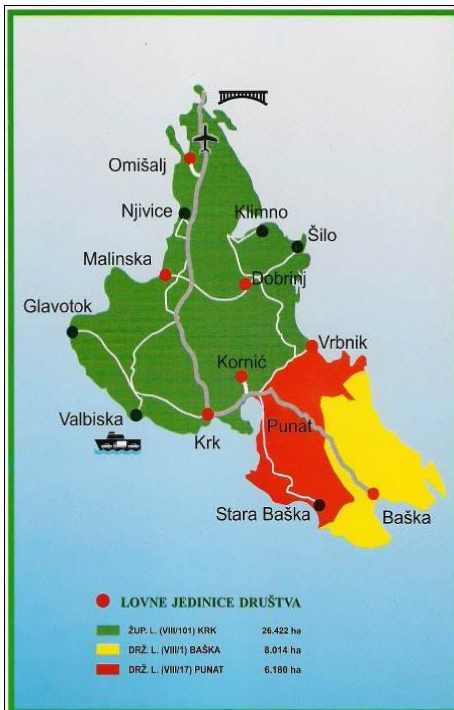
Slika 6: Karta otoka Krka s podijelom na lovišta i oznakom lovnih jedinica