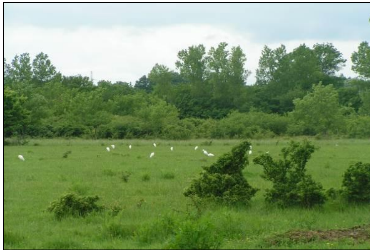
Slika 8: Pogled na centralni dio otoka Krka, «Omišljanski lug» - lovište VIII/101 Krk