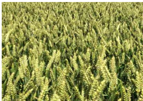
Slika 12. Sorta Kraljica

Kad vlažnost zrna pšenice dosegne 20%, može se krenuti u žetvu ali u tom slučaju zrno se mora umjetno dosušivati. Uobičajeni troškovi sušenja iznose 10% vrijednosti pšenice. Da bi se izbjegli ti troškovi obično se čeka dok vlaga ne padne ispod 14%. Očekivani prinosi ovisno o godini dosežu i 8t/ha. Dio uroda ostavljaju za vlastite potrebe, dio predaju otkupljivačima u silos, a slama se presa u valjkaste bale i koriste za stelju.