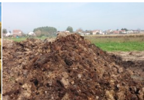
Slika 11. Stajnjak deponiran u polju