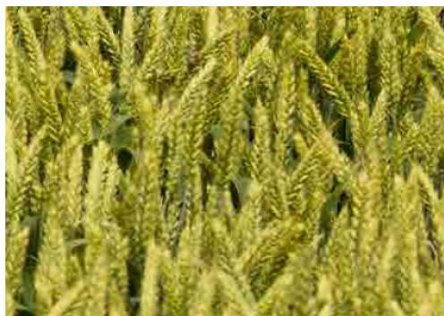
Slika 13. Sorta Katarina