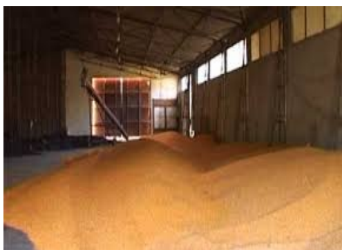
Slika 8. Podno skladište za kukuruz

otvorenom dijelu dvorišta, i nakon toga prekrivaju najlonima koji ih štite od nepovoljnih vremenskih prilika sve do njihovog korištenja. Ovakvim načinom čuvanja se smanjuje propadanje i gubitak slame koja služi kao stelja tijekom čitave godine. Stajnjak (Slika 11.) se nakon čišćenja staje odvozi na polje gdje se deponira na betonsku pistu ili se odmah razbacuje ukoliko je polje slobodno. Kapacitet površine za deponiranje je dovoljan za čitavu godinu, odnosno njihovo pražnjenje se obavlja jednom godišnje. Traktori kao i ostala potrebna mehanizacija parkirana je ispod natkrivenih garaža.