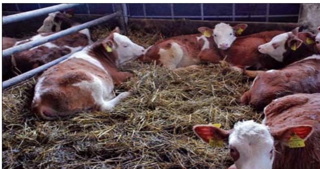
Slika 7. Držanje junadi na dubokoj prostirci