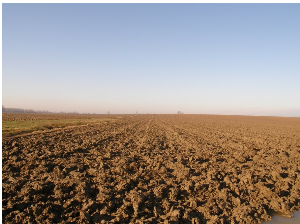
Slika 5. Poorano zemljište (foto: D. Banožić, 2015.)

OPG Ivan Pečić iz Cerne ( u daljem tekstu OPG) bavi se ratarskom proizvodnjom na ukupno 230 ha zemlje. Od toga je 180 ha vlastita (Slika 5.) a ostalih 50 ha je privatno zemljište u zakupu. Sjetvenim planom za 2014./ 2015. godinu zasijali su 75 ha pšenice ( 25 ha sjemenske i 50 ha merkantilne), 90 ha soje i 55 ha kukuruza. Posijana je i lucerna na 10 ha koja se planira koristiti naredne 4 godine. Prevladavajući tipovi tla na ovim površinama su černoze i eutrično smeđe tlo.