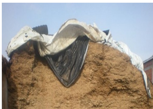
Slika 9. Horizontalni silos