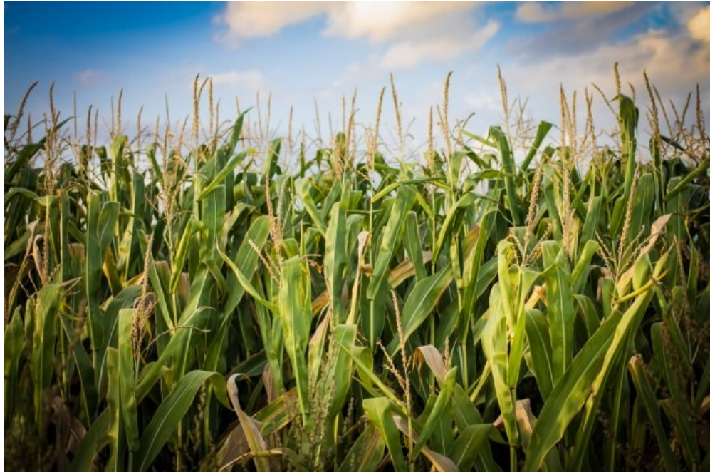
Slika 17. Kukuruz u polju