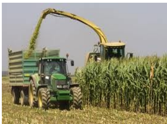
Slika 19. Siliranje kukuruza