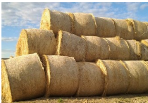
Slika 10. Valjkaste bale slame