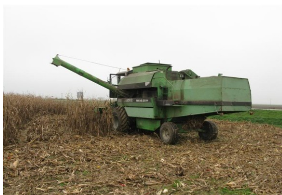
Slika18. Vršidba kukuruza