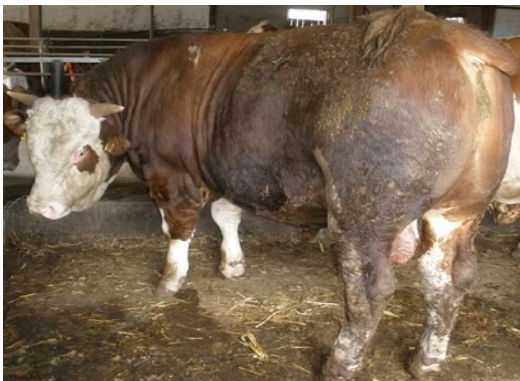
Slika 2. Govedo simentalске pasmine težine oko 500 kg