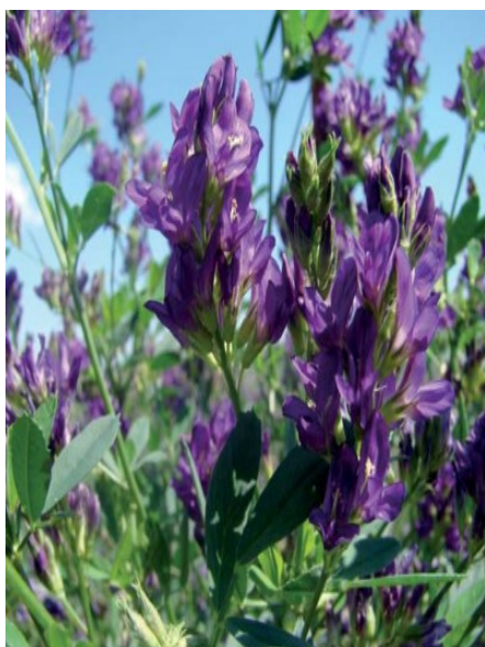
Slika 24.Lucerna OS66 (foto: D.Banožić, 2015.)

Između pojedinih otkosa mora proći dovoljno vremena da se sintetiziraju dovoljne količine organske tvari za obnavljanje lucerne i ishranu korijena. Ovaj razmak između otkosa ne bi smio biti kraći od 35 dana. Visina košnje ovisi o pupovima na glavi korijena, a najčešće je 4 – 6 cm. Posljednji otkos, pred zimu kosimo nešto više na 10 – 12 cm, a za prezimljavanje i uspješno kretanje vegetacije nakon zime trebalo bi između posljednjeg otkosa u jesen do prvog mraza proći 50-ak dana. Lucernu treba kositi predvečer. Lucerna se na ovom OPG-u koristi kao sijeno. Gubici su pri ovakvom načinu spremanja veliki, jer tijekom preokretanja i skupljanja dolazi do opadanja lista. Za košnju lucerne (Slika 25.)koriste diskosnu kosačicu s gnječilicom čime se ubrzava prosušivanje za 1 – 2 dana i smanjuju gubici. Pri spremanju sijena pod djelovanjem topline sunca i vjetra smanjuje se sadržaj vlage sa 70 – 90% u pokošenoj masi na 15 – 20% u sijenu. Gubici tijekom sušenja i spremanja sijena variraju u širokom rasponu od 15 do 100% od početne suhe mase zelene krme. Sušenje u relativno dobrim uvjetima uzrokuje znatno manje gubitke koji iznose oko 15 – 18% , ali kiša povećava gubitak do 30% , a u izrazito lošim uvjetima sušenja može biti izgubljena sva hranjiva krme. Većina gubitka se dogodi za vrijeme skidanja, sušenja i transporta, a samo 5% za čuvanja sijena. Na polju sušeno sijeno balira se do 18% vlage u rolo bale (Slika 26.).